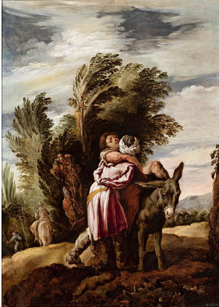
La parabola del buon samaritano, Domenico Fetti e bottega, Roma, 1589 c. - Venezia, 1623, Galleria dell'Accademia, Venezia. 12

seiner Lehre versprach er den Einlass in das Reich Gottes. Dies interessierte die Sadduzäer und viele Juden jedoch nicht, da sie weder an ein Weiterleben der Seele noch an die Auferstehung glaubten. Aber es ist davon auszugehen, dass sie von der radikalen Form beeindruckt waren, in der Jesus soziale Gerechtigkeit lehrte, ohne dabei die hierarchische Struktur zu gefährden, die ihren Besitz sicherte. Angesichts der seit Jahrhunderten andauernden Revolten 11 sehnten sich auch viele gläubige Pharisäer, nach Frieden. Er konnte sie nur überzeugen, indem er ihren Glauben an das Jüngste Gericht nicht erschütterte.