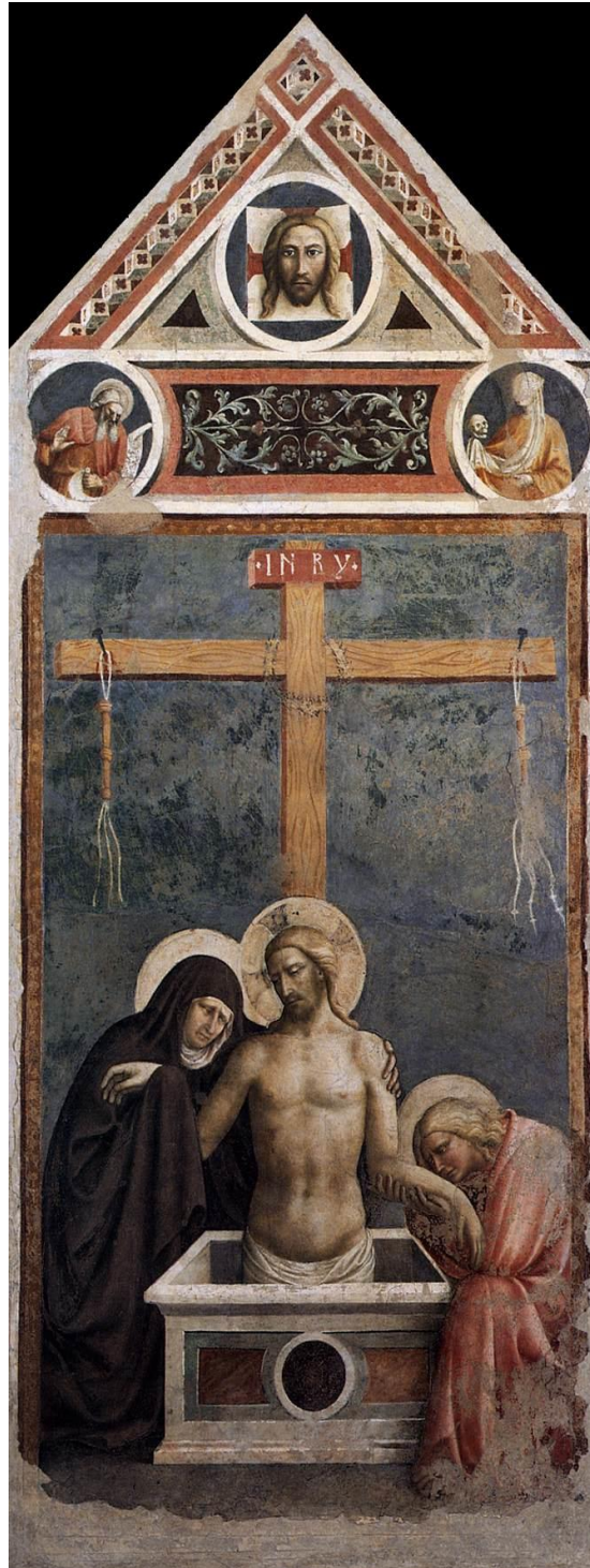
Masolino da Panicale (1383–1447), Pietà, Museo Diocesano, Empoli

er den stehenden Jesus in einem Sarkophag darstellte? Maria und ein Apostel halten die von den Seilen womit er ans Kreuz gebunden war schmerzenden Handgelenke. Maria legt dabei ihren Arm um Jesus, während der Apostel den Unterarm küsst. Bis auf einen Einstich im Brustkorb auf der rechten Seite, ist er unversehrt. Das Herz sollte nicht getroffen werden. Die Seile, mit denen er festgebunden war, hängen noch am Kreuz.