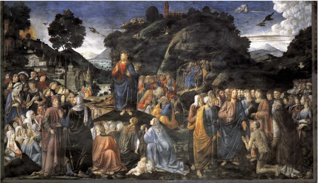
Cosimo Rosselli, Die Bergpredigt, 349 x 570 cm. ca. 1481/82, Vatican, Sixtinische Kapelle. 2

Die „Bergpredigt“ ist ein zwischen 1481 und 1482 von Cosimo Rosselli in der Sixtinischen Kapelle in Rom angefertigtes Fresko. Darauf ist Jesus zu sehen, wie er über der Menge auf einem Stein steht, auf dem ein schwarzes Tuch ausgebreitet liegt. Mahnend zur Selbstlosigkeit und Bescheidenheit erhebt er die rechte Hand. 3 Hinter ihm stehen die Apostel in einer Gruppe, während die Zuhörer vor ihm aufgestellt sind. Im Hintergrund des Freskos sind eine Landschaft und eine mittelalterlich anmutende Stadt zu sehen. In einer zweiten Szene rechts im Bild wird Jesus ein zweites Mal als heilender Arzt eines Leprakranken dargestellt. Links im Bild steht der Maler selbst mit schwarzem Hut. Mit leicht nach rechts gedrehtem Kopf und verschränkten Armen auf der Brust wirkt er hilflos, bescheiden und demütig, angesichts der Aufgabe, dieses denkwürdige Ereignis zu schildern.