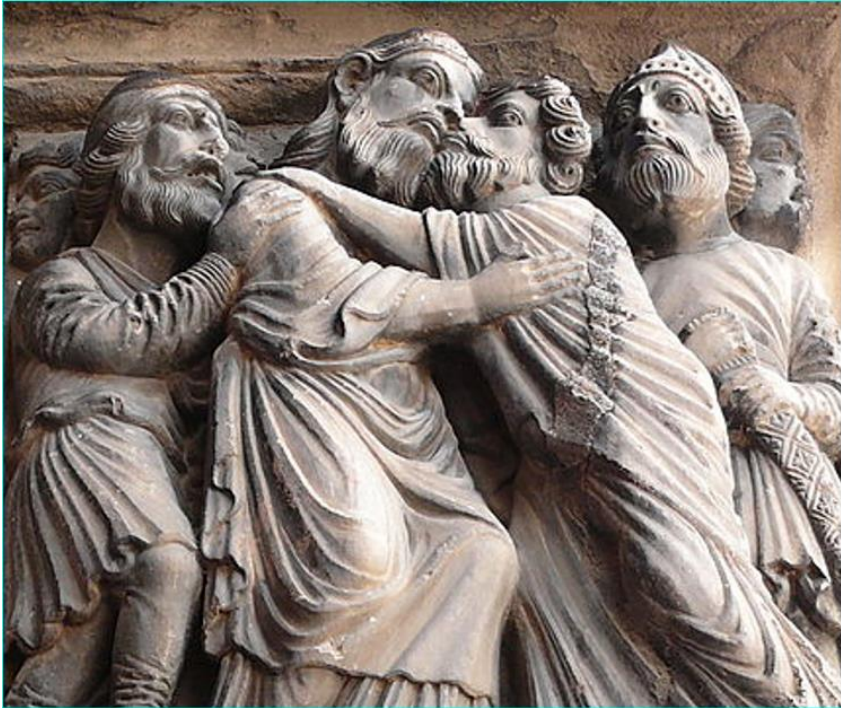
Der Judaskuss, Fries aus der Fassade der Abteikirche in St.Gilles (12.Jh.) 30

Judas küsst den wankenden Jesus innig und stützt sich dabei auf dessen Schulter. Jesus reicht ihm die leicht nach vorne geneigte linke Wange, während er ihn in seine Arme schließt. Ein besorgter Apostel hinter ihm stützt und warnt ihn mit einem schmerzverzerrten Gesichtsausdruck. Ihm folgen die ärmlich gekleideten, und mit Knüppeln bewaffneten Apostel. Sie blicken aufgeregt auf den mit einem verzierten Helm ausgestatteten Amtshüter, dessen Augen mitfühlend und weit aufgerissen sind. Er hält mit beiden Händen sein Schwert an seine Brust gedrückt. Er hat den Befehl der Hohepriester, Jesus abzuholen und ihn dem Sanhedrin zu übergeben. Aus seinem Gesichtsausdruck ist keinerlei Gewalt herauszulesen.