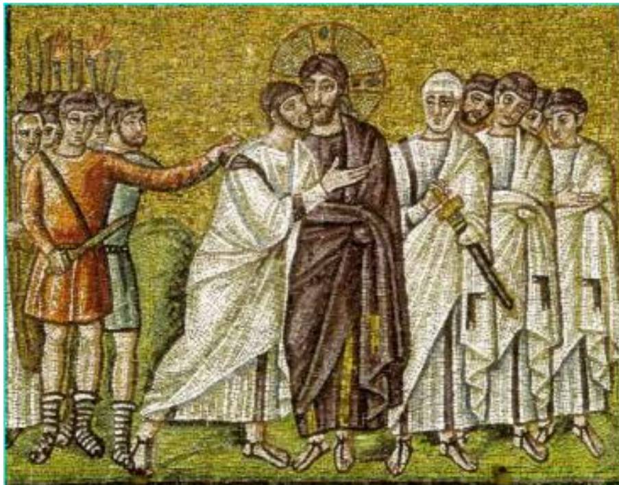
Der Judaskuss, St. Apollinare Nuovo, Ravenna 33

Es gibt noch ein zweites Bild, das im Aufbau diesem sehr ähnelt. Das Mosaik des Judaskusses in der Basilika San Apollinare Nuovo in Ravenna zeigt ebenfalls eine innige Umarmung. Der Apostel hinter Jesus legt misstrauisch seine Hand auf dessen Schulter. Der Soldat hält das Schwert mit beiden Händen. Die Männer, die ihn begleiten, sind unbewaffnet. Ihr Gesichtsausdruck ist teilnahmsvoll. Sie blicken betroffen. Die angespannte Stimmung ist auf beiden Bildern dargestellt. Judas ist jedoch auf beiden Bildern wie ein Apostel dargestellt, der Jesus vor der Gefangennahme noch Mut zuspricht und ihn dabei umarmt. Jesus ist