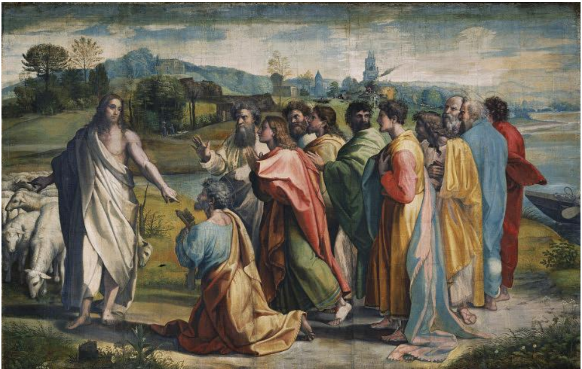
Raphael, Die Beauftragung des Petrus, 1515, Victoria und Albert Museum, London 41

Die Beziehung von Jesus zu den drei jüdischen Sekten (Pharisäer, Essener und Sadduzäer) wurde untersucht. Während Jesus die Pharisäer oft kritisierte, wird eine Nähe zu den Sadduzäern angedeutet, da er ihre hierarchischen Strukturen nicht infrage stellte. Eine Zugehörigkeit zu den Essenern, die eine Gütergemeinschaft praktizierten, ist daher unwahrscheinlich. Zentral bleibt dennoch seine pazifistische und sozial gerechte Lehre, die jedoch nicht den Gerechtigkeitsvorstellungen der Pharisäer entspricht. Dies führte zu einer Spaltung im jüdischen Volk. Um einen Aufruhr am Pessachfest zu vermeiden, zog Jesus die Konsequenz aus seiner Friedenslehre und stellte sich. Aus diesem Grund wird Judas nicht nur als Verräter, sondern auch als Vermittler und Helfer dargestellt.