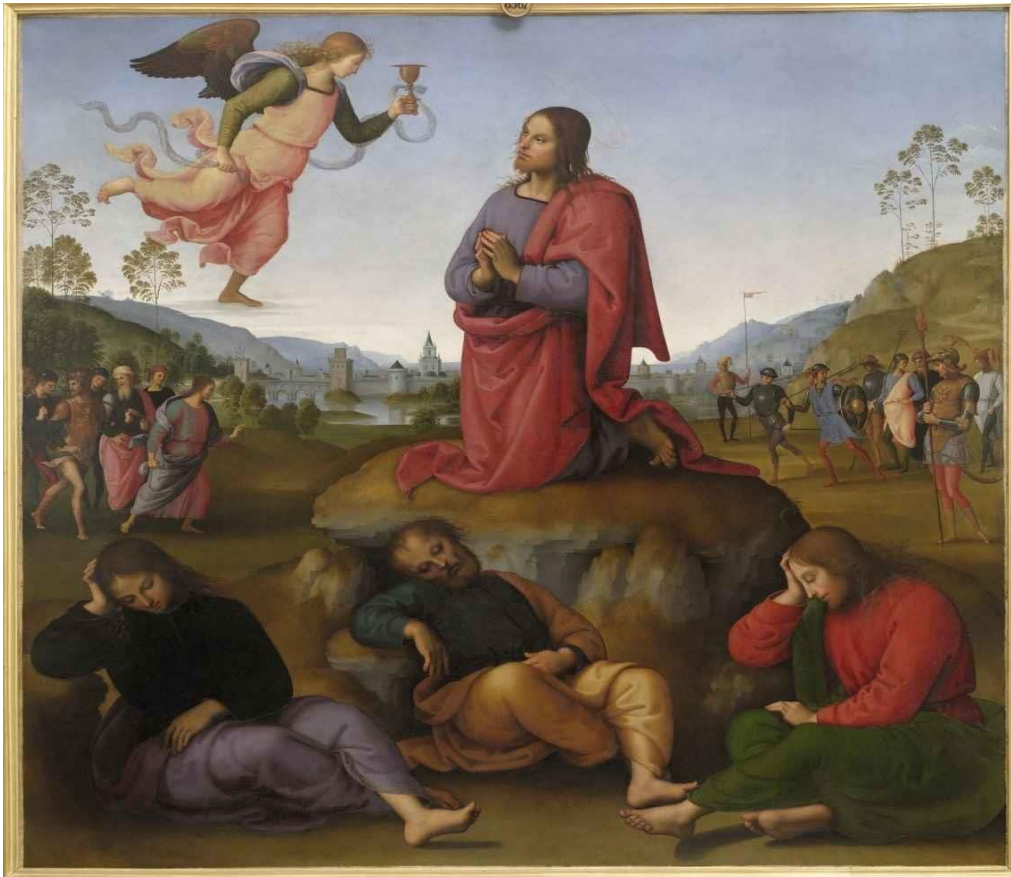
Vannucci Pietro detto Perugino, Christus im Garten Getsemani , (sec. XV), Galleria degli Uffizi, Florenz 21

Abgesehen von seinen derben, martialischen Drohsprüchen, die ihn den Sadduzäern näherbringen, ist an keiner Stelle des Evangeliums irgendeine Gewaltanwendung von Jesus bekannt, außer der ungläubhaften Tempelreinigung.