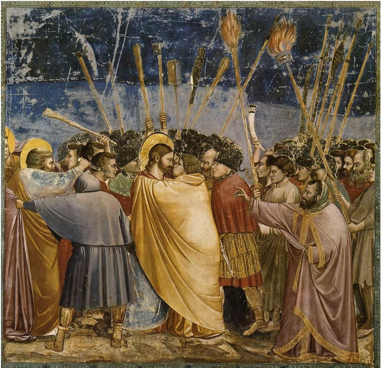
Giotto di Bondone, Der Kuss von Judas, 1304-1306, Padova, Capella degli Scrovegni 34

Warum umarmten sich Jesus und Judas liebevoll vor den betroffenen Amtshütern? Was wussten die anderen Apostel, die glaubten, Jesus mit Holzknüppeln verteidigen zu müssen? Ganz entschieden anders ist die Darstellung von Giotto di Bondone : Jesus blickt zornig auf Judas, der ihn mit einem bössartigen Gesichtsausdruck umschlingt und dabei vollständig in seinen gelben Mantel hüllt.