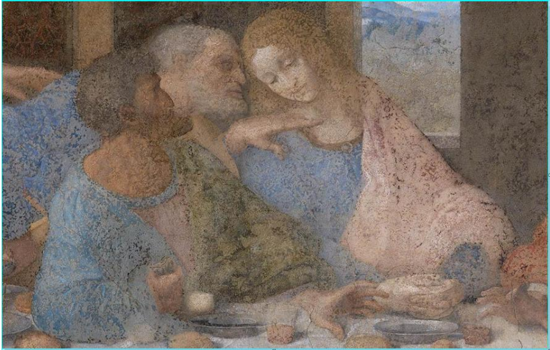
Leonardo da Vinci, Das letzte Abendmahl, Detail.

Der Jüngste Johannes, der ihm am meisten zugetan war, kann sich vor Schmerzen nicht mehr aufrechterhalten und wird von einem Älteren getröstet. Judas schaut zu Jesus auf, als wollte er ihn fragen, was er mit dem Geld, das er für den Verrat erhalten hat, machen soll. Eine aufgeregte Diskussion mit wilden Gesten findet statt, jeder hat etwas Wichtiges mitzuteilen, zu beratschlagen. Der betroffene Jesus bildet den Mittelpunkt. Er bleibt dabei erstaunlich ruhig und entspannt, fast abwesend. Er wird nun alle verlassen, und einen Ort aufsuchen, an dem man ihm nicht folgen kann, hat er Ihnen mitgeteilt und sie sollen sich vor allem lieben. 28