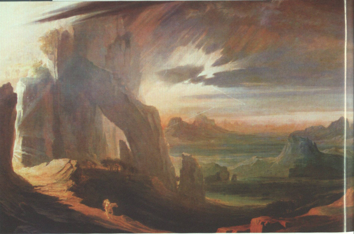
3 John Martin, Die Vertreibung aus dem Paradies , 1813

wird man sagen können, daß diese katastrophisch-apokalyptischen Visionen zu den zentralen Unternehmungen des Malers gehören und daß sie darüber hinaus seine Wahrnehmung in der Öffentlichkeit fast ausschließlich bestimmen. Gerade letzteres ist natürlich kein Zufall und dürfte mit der vorhin angesprochenen endzeitlichen Grundstimmung zusammenhängen, die im England des frühen 19. Jahrhunderts verbreitet war. Wie läßt sich dieser Zusammenhang näherhin bestimmen?