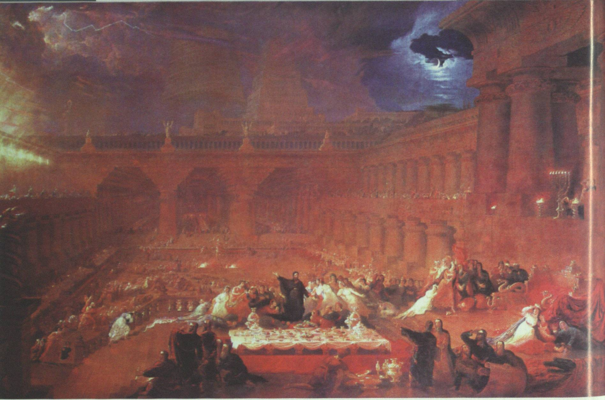
8 John Martin, Das Fest Belsazars , 1821

eines der Urzeit gekennzeichnet zu haben, das wohl kaum nur 6000 Jahre zurückgelegen haben kann. Letzteres nämlich behaupteten die Dogmatiker der christlichen Religion gegen die gerade im England der Zeit heftig diese Überzeugung angreifenden Geologen, welche die kurze Dauer der biblischen durch eine Jahrmillionen währende Dauer der naturwissenschaftlich geprüften Erdgeschichte ersetzten. Einer dieser Geologen war Gideon Mantell, der sich in den hochbeliebten »Wundern der Geologie« aus dem Jahr 1838 mit der urzeitlichen Tierwelt beschäftigte. 8 Anlaß dafür hatte der Fossilienfund eines Iguanodon genannten Reptils in Südengland geliefert. Dem Wunsch des Geologen, daß sein Buch von John Martin und nur von diesem illustriert werden sollte, kam der Künstler mit den bei ihm geläufigen dramatischen Inszenierungen nach, die schon auf Darwin vorauszuweisen scheinen: In einem Mezzotintoblatt zeigt er zwei Iguanodone, die sich gerade mit einem Krokodil herumschlagen. 9 Solche Szenen weisen auf moderne mediale Dinosaurierinszenierungen genauso voraus wie der Turm von Babylon in Belsazars Fest , der seine mittelbare Nachfolge in Filmen wie Fritz Langs Metropolis findet.