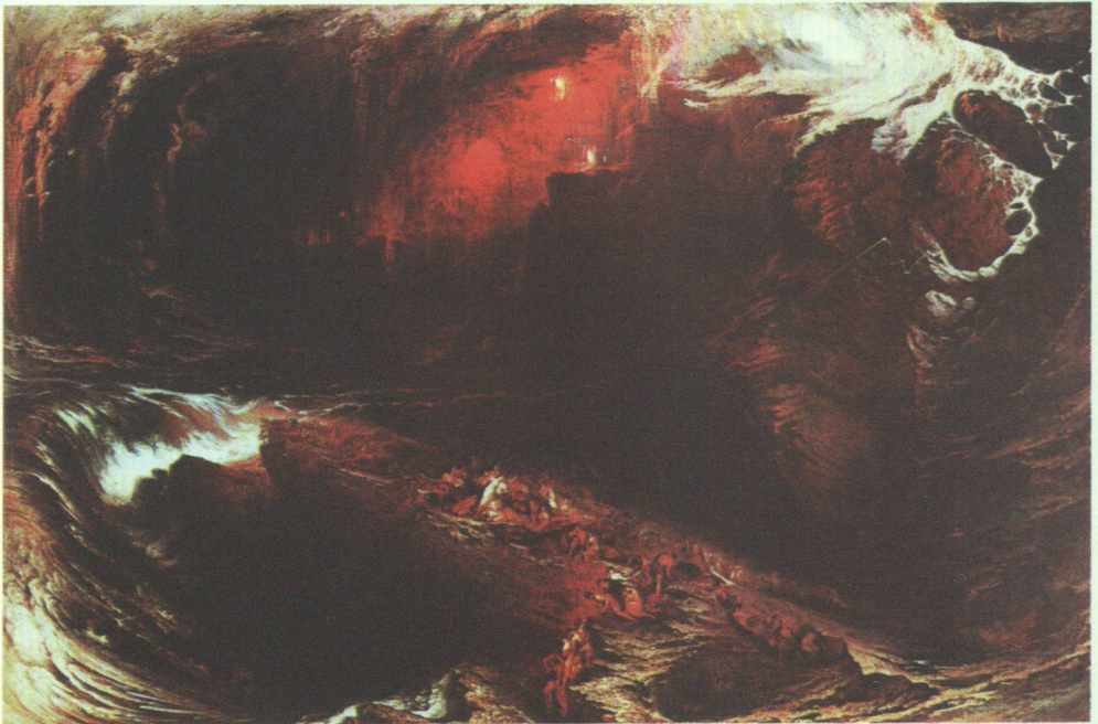
9 John Martin, Sintflut , 1834