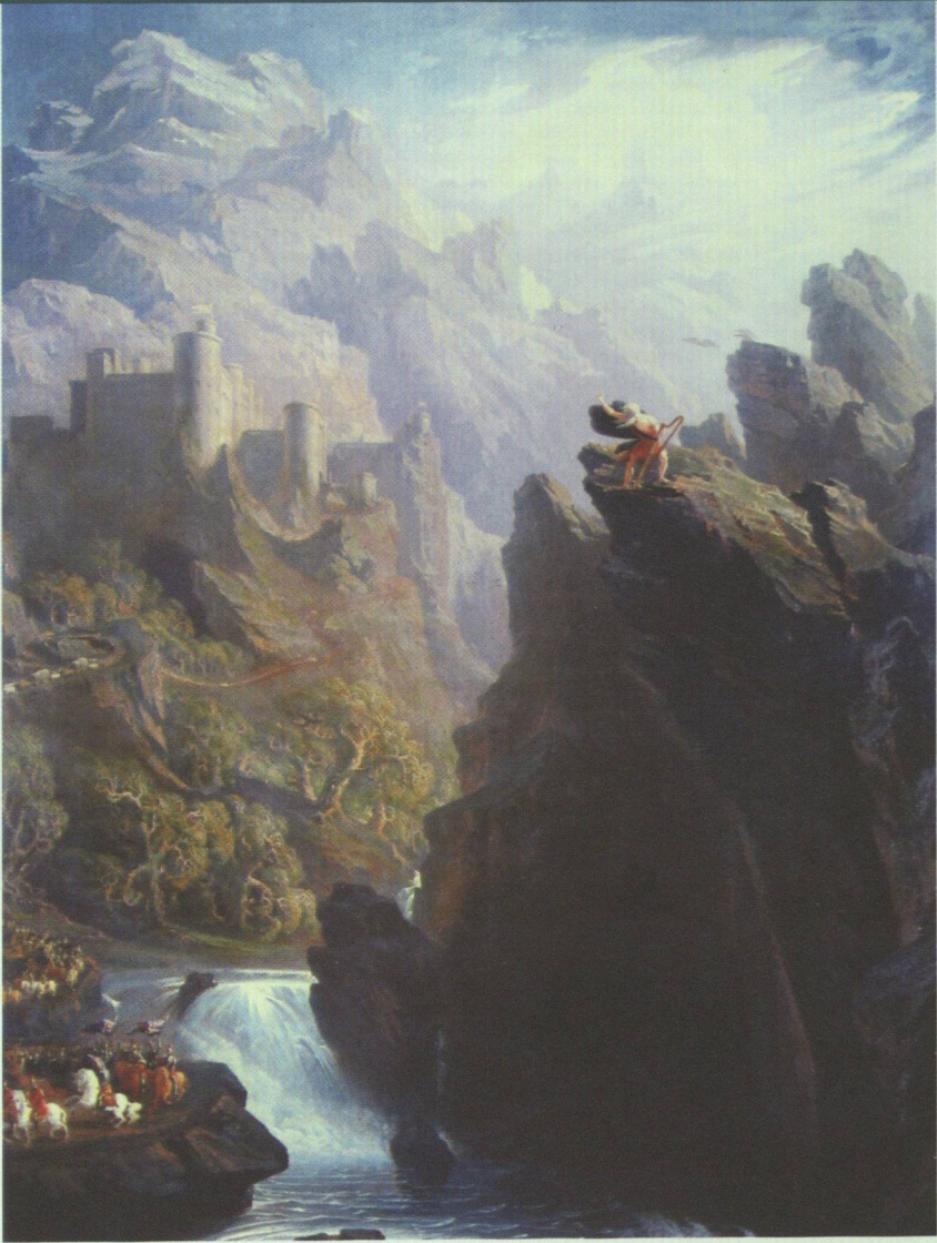
2 John Martin, Der Barde , 1817

auch. Der große Tag seines Zorns , das dann schon aus den 1850er Jahren datiert, (Abb. 10) bildet ganz zweifellos einen Höhepunkt in der vorgestellten Reihe. Man vermeint, den Lärm des Weltunterganges zu hören, so durchschlagend wird das Zerstörungspanorama hier vom Künstler inszeniert.