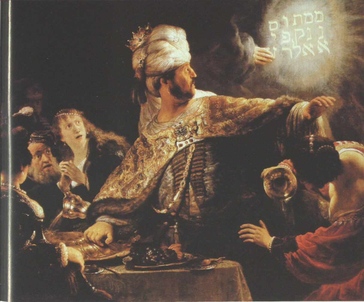
11 Rembrandt Harmensz van Rijn, Belsazars Fest , ca. 1635

Bedrohung empfunden wurde und zu solch pessimistischen Voraussagen wie denjenigen des Thomas Malthus geführt hatte. Etwas Derartiges könnte übrigens der französische Historiker und Zeitgenosse Martins, Jules Michelet gemeint haben, als er 1834 in sein Tagebuch eintrug: »Bentham, Malthus, Martin bringen den englischen Geist zum Ausdruck. Das Interesse, die Masse, die Erstickung der Bevölkerung.« 20 Ob nicht die ameisenhaften Figürchen aus Martins Babylonbildern das Drama der explosionsartig wachsenden Bevölkerung evozieren, welches sich in England abspielte? Malthus hatte es zu seiner einflußreichen, wenn auch durch die weitere Entwicklung widerlegten Verelendungstheorie veranlaßt, die aus der angeblich schneller als der Nahrungsnachschub wachsenden Bevölkerung resultieren sollte.