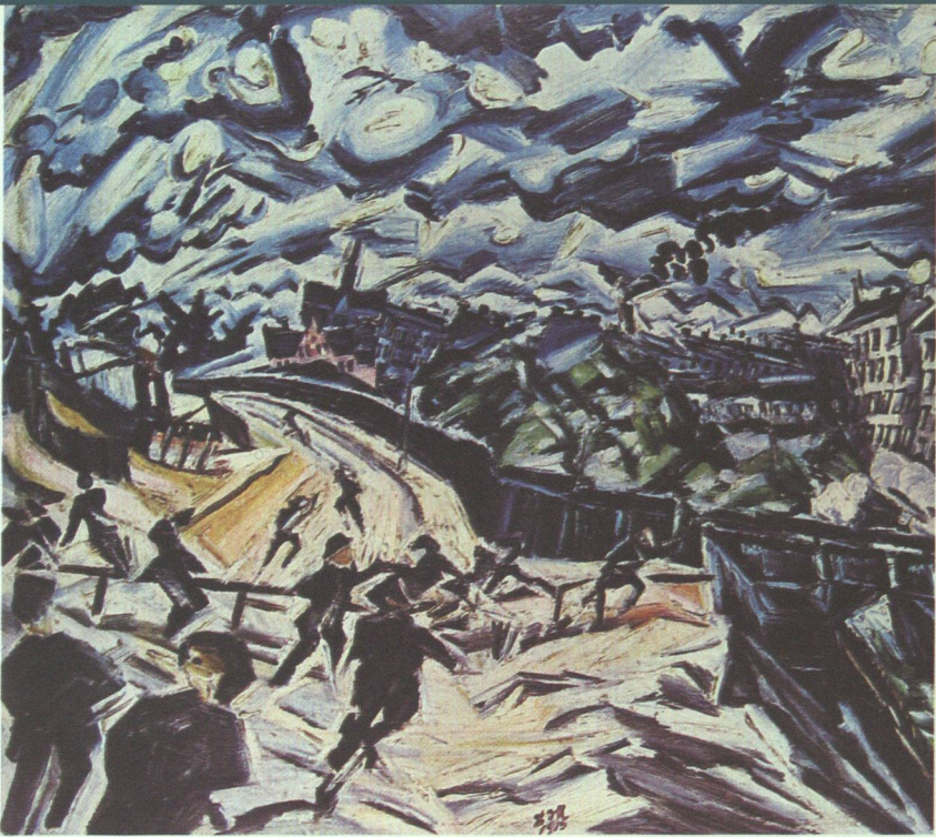
14 Ludwig Meidner, Brennende Stadt , 1913

überboten wird sie eigentlich ebenfalls erst in den filmisch-bewegten Inszenierungen Hollywoods. Die Details der zusammenstürzenden Felsmassen sind übrigens so scharf geschnitten, daß sie wie extrem kurz belichtete Naturaufnahmen wirken und daher die Glaublichkeit der Bewegung indirekt erhöhen.