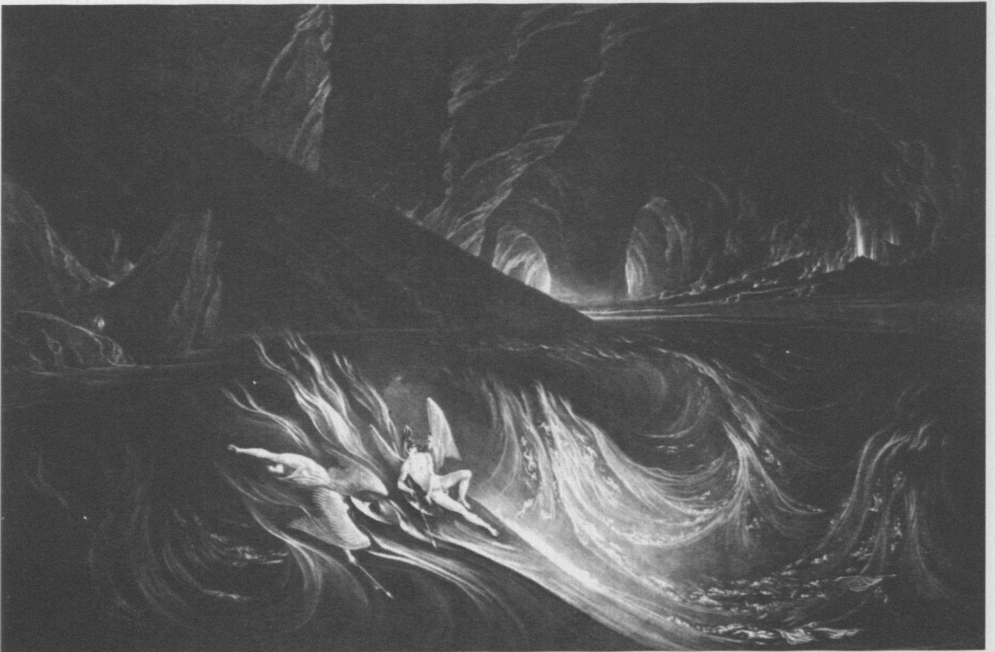
7 John Martin, Satan auf dem brennenden See , Illustration von Miltons Paradise Lost , 1824