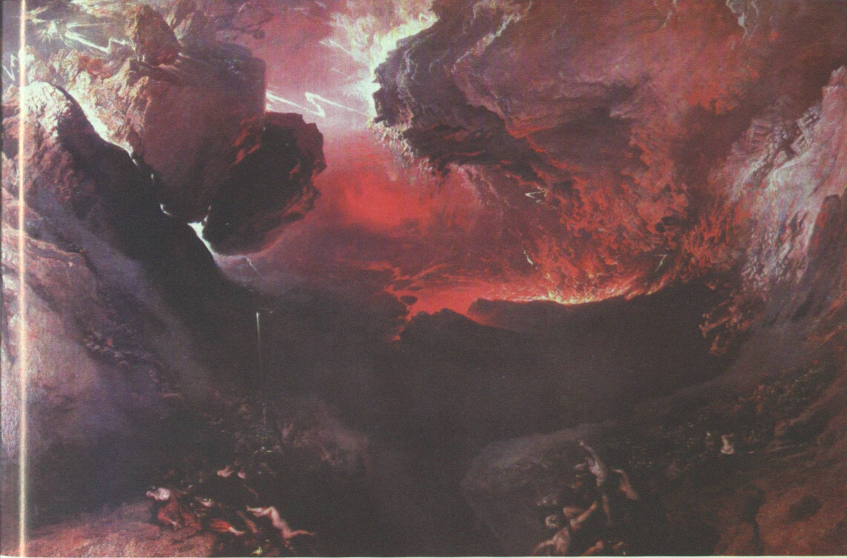
10 John Martin, Der große Tag seines Zorns , 1853

das nicht lange vorher, nämlich ganz am Ende des 18. Jahrhunderts. Beim Diorama haben wir es mit von hinten beleuchteten Panoramen zu tun, in denen durch ausgeklügelte Lichtregie quasi reale Bewegungs-Effekte erzeugt wurden. 15 Die beiden Medien bildeten eine populäre Bildlichkeit aus, die aufgrund ihrer Ephemierität – das Gebäude für ein Panorama wurde nach einer Weile, wenn sich das Zuschauerinteresse erschöpft hatte, abgerissen, die riesigen Leinwände wurden häufig zerstört – neben den musealen Kunstwerken kaum mehr präsent und unter modernen Bedingungen in die neuen Medien abgewandert ist. Ganz bezeichnend, wenn auch von Martin selber mit Argwohn betrachtet, ist die Tatsache, daß der Belsazar von den Besitzern des British Diorama im Queen's Bazaar in der Oxford Street als ein »großes Gemälde« bezeichnet wurde, »das mit dioramatischer Wirkung gemalt ist.« 16 Sie stellten es in ihren Räumen aus und führten es gegen eine Zahlung von einem Shilling dem Publikum vor. So wie die anderen, die Martins Bilder in Rummelbuden wie Bullocks Egyptian Hall ausstellten oder mit ihnen Groschenhefte illustrierten. Genau darauf bezog sich der Malerkollege David Wilkie, als er 1821 bemerkte: »Der Mann auf der Straße scheint von diesem Bild sehr angetan; tatsächlich mehr als von irgendeinem anderen Bild. Aber die wichtigen und ernstzunehmenden Künstler erkennen solche Ansprüche nicht in dem Umfang an.« 17