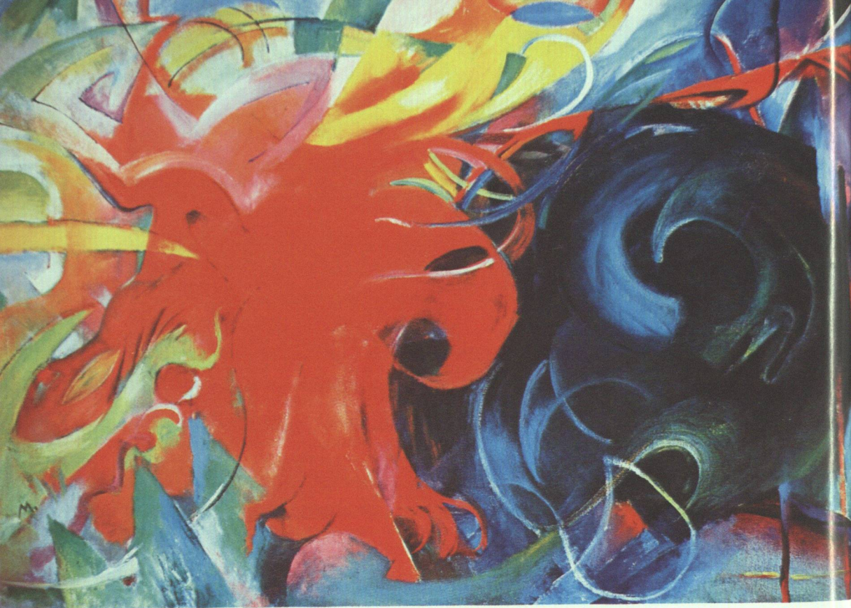
15 Franz Marc, Kämpfende Formen , 1914

stehenden Meidner die Wesensform der modernen Großstadt überhaupt ausmacht. (Abb. 14) Theoretisch beschrieben war diese Auffassung in seiner kurzen, aber ausgesprochen eindrücklichen Anleitung zum Malen von Großstadtbildern : »Eine Straße besteht nicht aus Tonwerten«, hatte er darin gegen die Impressionisten gerichtet formuliert, »sondern ist ein Bombardement von zischenden Fensterreihen, sausenden Lichtkegeln zwischen Fuhrwerken aller Art und tausend hüpfenden Kugeln, Menschenfetzen, Reklameschildern und dröhnenden, gestaltlosen Farbmassen.« 28 Eingeflossen in diese Beschreibung war die Überzeugung, daß die spezifisch städtische Perzeptionsform eine der schnellen Bewegung sei und der extremen Perspektiven.