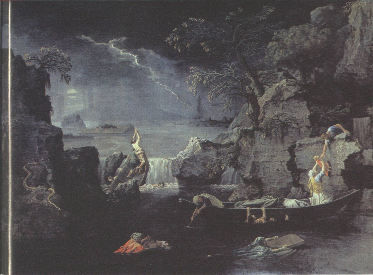
13 Nicholas Poussin, Sinflut , 1660–1664

kanische Maler Washington Allston stellte bei seinem London-Besuch wie so viele andere die extremen Gegensätze von arm und reich, Luxus und Verrohung fest und sah darin gleich wieder die manichäische Logik verwirklicht, die den Millenaristen insgesamt eignete. Und selbst die Geisteskrankheit des englischen Königs George III. begriff man als einen von Gott gegebenen Hinweis auf die Zerrüttung der Verhältnisse.