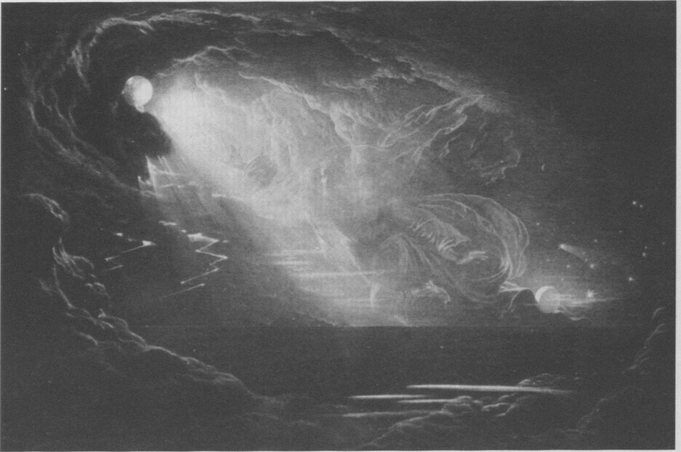
6 John Martin, Die Erschaffung des Lichts , Illustration von Miltons Paradise Lost , 1824