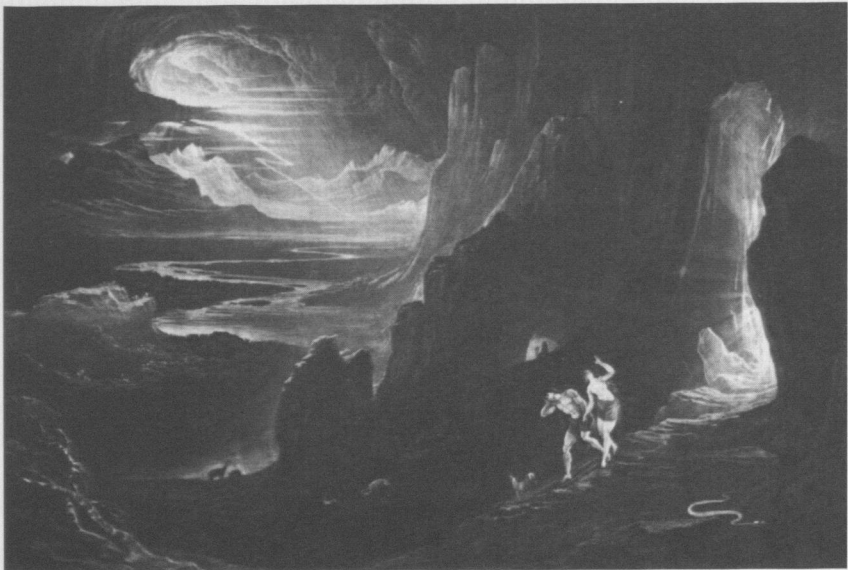
12 John Martin, Vertreibung aus dem Paradies , Illustration von Miltons Paradise Lost , 1824

Es gilt aber im speziellen auch deswegen, weil die extremen Gegensätze und megalomanischen Strukturen der Stadt London zu einem Symbol und Vorschein des Endkampfes von Gut und Böse hypostasiert werden konnten. Allgemein wurde London als das neue Babylon wahrgenommen, 23 eine Tatsache, die durchaus auch auf die Aktualität und die implizite Realistik der Martinschen Visionen verweist. Der mit ähnlichen Themen wie Martin beschäftigte ameri-