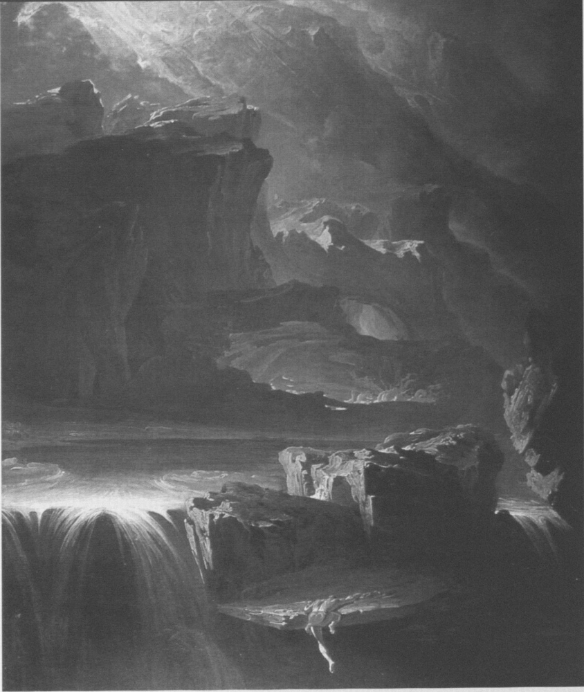
1 John Martin, Sadak auf der Suche nach den Wassern des Vergessens , 1812

Suche nach den Wassern des Vergessens (Abb. 1) aus dem Jahr 1812, das einen in Persien angesiedelten, aber ein halbes Jahrhundert zuvor von einem englischen Dichter erfundenen literarischen Stoff aufnimmt. Vom Sultan dazu veranlaßt, das wundersame Wasser zu besorgen, sehen wir im Vordergrund Sadak, der sich an einer Felsplatte hochziehen versucht. Einigermaßen skurril, ganz dem Geist der englischen Frühromantik entsprechend, ist der erzählerische Hintergrund. Mit dem Wasser nämlich will der Sultan die Frau Sadaks traktieren, die er diesem gestohlen hat, so daß sie sich an ihre Herkunft nicht mehr erinnern möge. Höllengleich wirkt die rot glühende Landschaft, ganz richtig die Assoziation mit dem mythischen Lethefluß, dessen Durchqueren am Anfang der Unterwelt die Seele des Verstorbenen von ihrer Vergangenheit befreit. Die eher bescheiden dimensionierte Figur des Sadak im Bild hat ganz offensichtlich den Effekt, im Kontrast die Größe der Gesamtszene zu steigern, und