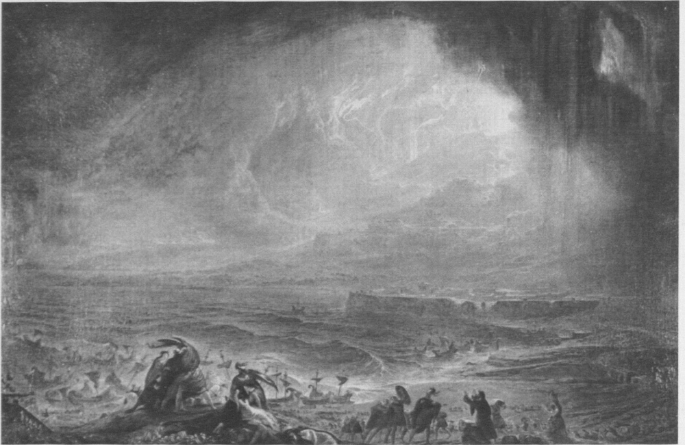
5 John Martin, Der Untergang Pompejis , 1822