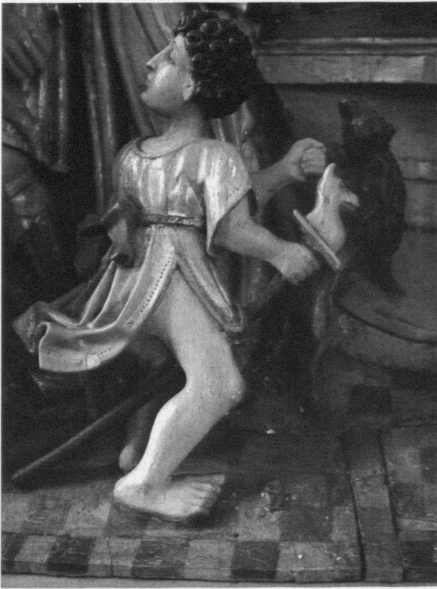
Abb. 3: Retabel auf dem Hochaltar der Dortmunder Kirche St. Petri, das »Goldene Wunder«, Kind auf dem Steckenpferd, Detail aus der Szene mit Christus vor Pilatus, um 1521