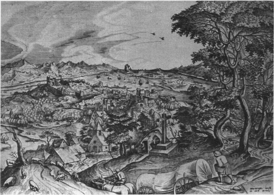
Abb. 4: Pieter Bruegel, Ploustrum Belgicum . Kupferstich, 320 x 423 mm, um 1555/56

de, durch vier Packer in insgesamt 89 Kisten verpackt, die eigens von Tischlern angefertigt worden waren. 32 Die sogenannten casse , die besonders bei größeren Objekten passgenau gearbeitet werden mussten, wurden unter Verwendung großer Mengen Stroh gegen Erschütterungen gesichert. 33 Diese Art der Verpackung entspricht genau dem, was auch schon für das 1399 von Melchior Broederlam verschickte Retabel dokumentiert ist. Genau wie an den Formen der Fortbewegung und des Transportes scheint sich auch in Sachen der Verpackung von Kunstwerken bis ins 18. Jahrhundert hinein nichts geändert zu haben. So zeigt zum Beispiel Antoine Watteaus Ladenschild für den Kunsthändler Gersaint, wie ein Porträt von Ludwig XIV. in eine mit Stroh gepolsterte Kiste verpackt wird (Abb. 5). 34 Jenseits der darin liegenden symbolischen Anspielung auf das Ende der Herrschaft des Sonnenkönigs wird hier zugleich auch die noch damals übliche Speditionspraxis illustriert, an der sich seit dem Mittelalter eigentlich nichts geändert hatte.