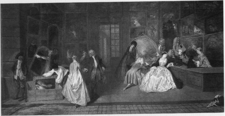
Abb. 5: Antoine Watteau, L'Enseigne de Gersaint , Öl auf Leinwand, 166 x 306 cm, 1720, Berlin, Staatliche Schlösser und Gärten, Schloss Charlottenburg

wachte, muss offen bleiben. Spätestens nach dem Verladen trugen dann allerdings die Spediteure die Verantwortung für ihre Fracht. Derartige Transporte müssen mit Blick auf die große Zahl der in aller Welt erhaltenen Retabel in Antwerpen seinerzeit häufiger vorgekommen sein, wenn auch nur wenige Belege für derartige Kunsttransporte bewahrt geblieben sind. Erhalten ist zum Beispiel das Zeugnis des Fuhrmannes Jan Lambrechts aus Opitter, der am 25. Juni 1512 zu Protokoll gab, dass er neben zahlreichen anderen Waren auch die Predella eines Retabels geladen habe, die er in die Kirche von Grote-Brogel in der heutigen Provinz Limburg transportieren sollte. 35