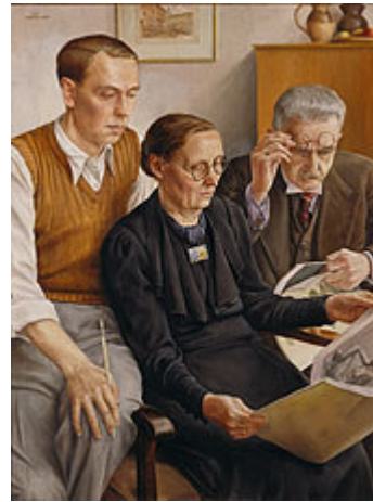
Udo Wendel, Die Kunstzeitschrift, 1939/1940, Öl auf Sperrholz, 110 x 85 cm, im Besitz der Bundesrepublik Deutschland

her, aber auch kein niedriger Preis, sondern Durchschnitt.