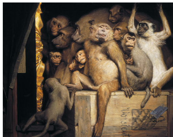
Abb. Gabriel von Max, Kränzchen (Affen als Kunstcritiker), um 1889, Öl auf Leinwand, 84,5 x 107,5 cm, München, Bayerische Staatsgemäldesammlungen, Neue Pinakothek

den: Der Geister Bahnen. Eine Ausstellung zu Ehren von Gabriel v. Max, 1840-1915, München, 1988.