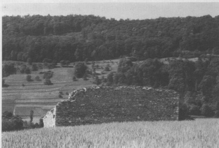
Abb. 3: Die „Zarge“, Ansicht von Nordosten.

Die Ruine steht etwa 50 m über der Talaue auf dem flach gewölbten Rücken des „Zargenberges“ (vgl. zum folgenden Abb. 2, 3, 4). Das Gelände weist in ihrer Umgebung sehr sanfte Gefälle auf, nur südlich zum Kocher ist der Abhang steiler. Als Hauptangriffsseite muß der langsam zur Hochfläche ansteigende Bergrücken im Norden gelten. Ein von Ingelfingen kommender Fahrweg führt direkt südlich an der „Zarge“ vorbei, um durch einen Hohlweg die Brücke über die Deubach zu erreichen.