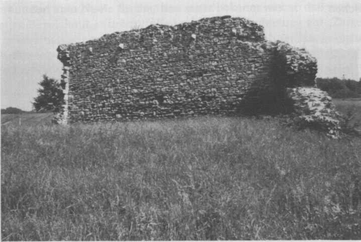
Abb. 4: Die „Zarge“, Ansicht von Süden (Innenseite).

Das vollkommen einheitliche Bruchsteinmauerwerk der „Zarge“ ist von beachtlicher Qualität (Abb. 5). Der anstehende Muschelkalk wurde in meist plattenförmigen Stücken und möglichst regelmäßiger Schichtung verarbeitet, einzelne größere Steine sind an der Sichtfläche geglättet. Die bei dieser Mauertechnik unvermeidlichen Lücken sind mit kleinen Steinbrocken ausgezwickt. Quaderförmig zugerichtete größere Stücke bilden die beiden sorgfältigen Eckverbände. Der Mörtel ist von hellbrauner Färbung und enthält außer wenigen Kieseln kaum Verunreinigungen. Er läßt sich heute zwischen den Fingern zu Sand reiben. Verputzreste sind nicht erkennbar. Der Zustand der Mauern ist noch überraschend gut, wenn man bedenkt, daß sie vermutlich seit mehreren Jahrhunderten ungeschützt der Witterung ausgesetzt sind.