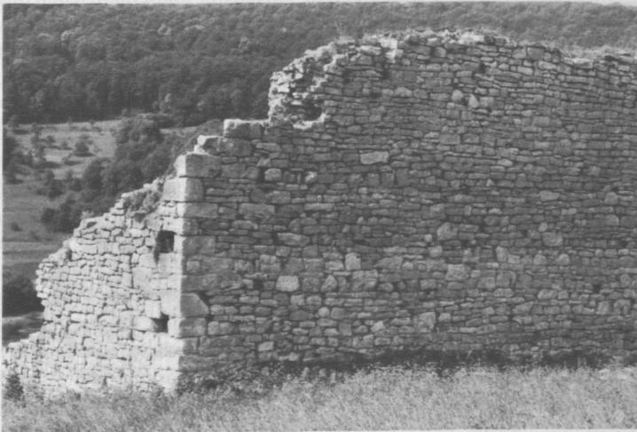
Abb. 5: Die „Zarge“, Mauerwerk der Nordostecke.

Über eine eventuelle Bebauung im Inneren dieser Ringmauer sind kaum Aussagen möglich. Die Kragsteine an der Nordmauer dürften in Anbetracht ihrer großen Höhe entweder zu einem angelehnten, schuppenartigen Gebäude, dessen Dachfirst sie dann getragen hätten, oder wahrscheinlicher zu einer Wehrgangkonstruktion gehört haben. In der „Hällischen Chronik“ 6 ist angeblich ein Keller erwähnt, der auf ein größeres Gebäude schließen läßt, dessen Stelle aber nicht mehr feststellbar ist. An die bestehende Nordmauer lehnte es sich kaum, eher käme die am schlechtesten angreifbare Südseite in Frage 11 . Nach H. Bauer zog sich vielleicht ein Graben um die Anlage, von dem aber schon 1856 „kaum noch eine Spur vorhanden“ war 12 . Vermutlich ist er zur Gewinnung von Weiden bzw. Äckern und beim allmählichen Abbruch der Ruine aufgefüllt worden.