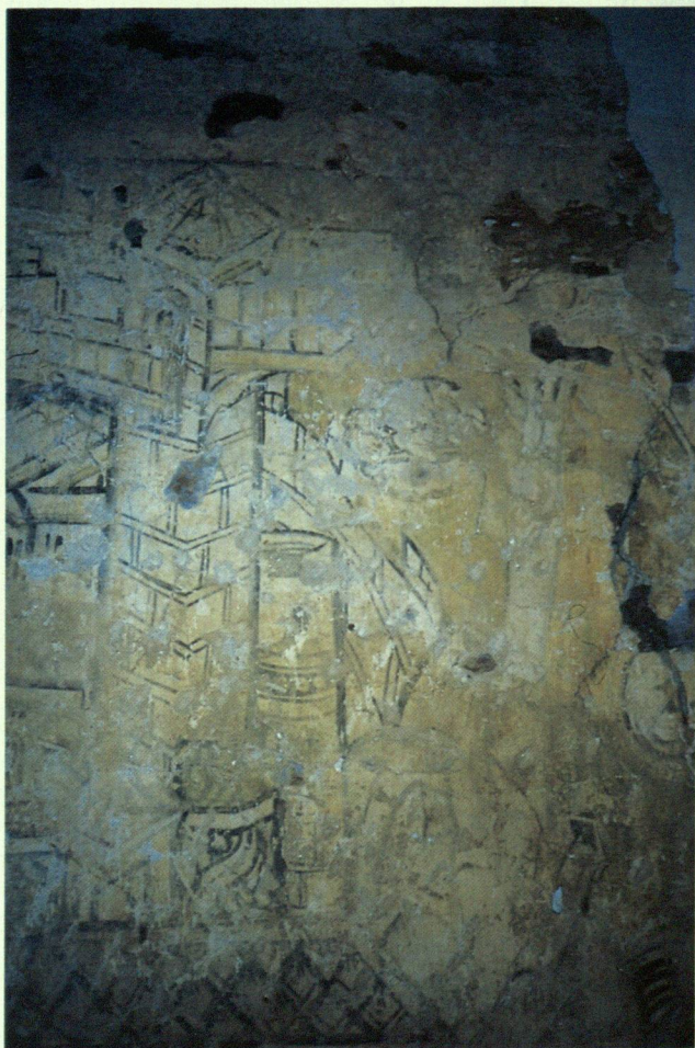
Abb. 1. Stadtdarstellung des späten 12. Jahrhunderts an der Nordwestwand des (ehem.) 2. Obergeschosses (Ausschnitt;).