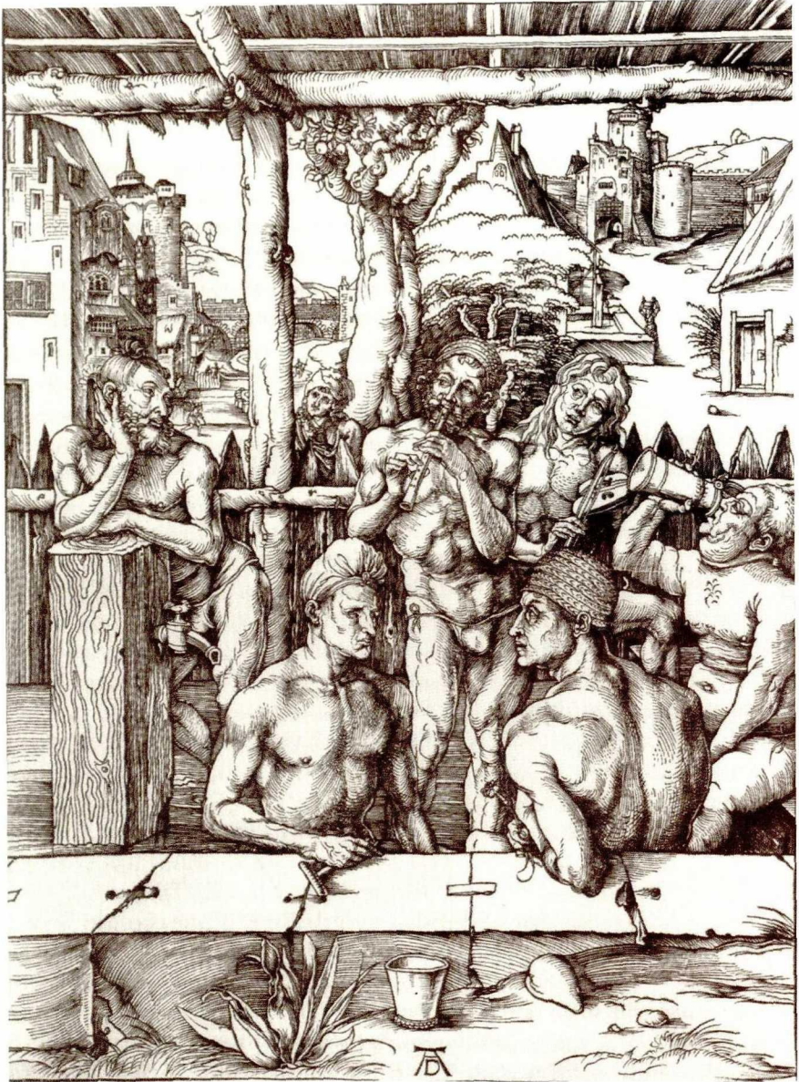
Albrecht Dürer, Das Männerbad (B 128), Holzschnitt, um 1496/97, 391×280 mm, Berlin, Kupferstichkabinett SMPK

führen, die vergleichbar drastisch formuliert sind, aber es reicht aus zu konstatieren, dass ein solch vulgärer Diskurs zwischen den Freunden möglich war.