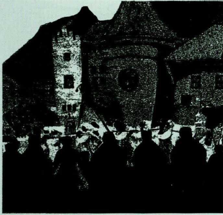
4. Karol Frycz, Procesja na Małym Rynku w Krakowie, wg „Świat”1906