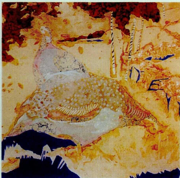
6. Karol Frycz, Perliczki na tle ogrodu , 1906

Frycza talent i „młoda «igrająca siłą».” 24 W „Świecie” zamieszczono reprodukcje Procejsji na Małym Rynku w Krakowie oraz Indyków (dwa ptaki, stojące pod słonecznikami) – wystrzyganki, która sądząc z katalogu nie znajdowała się na wystawie w Wiedniu 25 (il. 5).