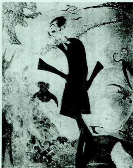
3. Kazimierz Sichulski, Karykatura Karola Frycza, wg „Nasz kraj” 1907

swego rodzaju wirtuozostwa. Były to wycinanki z introligatorskich barwnych papierów, wyklejane w tak misternych kombinacjach, że na niewielką odległość sprawiały wrażenie mozaiki z jakiegoś dziwnego materiału. Świetne rezultaty osiągał tą techniką w krajobrazach architektonicznych lub w takich motywach jak np. widok gęstego lasu ze stadem bażantów na pierwszym planie. Obrazy te miały duże powodzenie. Jan Stanisławski, który nikomu nie mówił komplementów bez przekonania, uznawał bardzo ich artystyczną wartość 9 . „W pierwszym lokalu Polskiej Sztuki Stosowanej, u Jerzego Warchałowskiego przy ul. Wolskiej – zapamiętał Marian Turwid – wisały swego czasu obrazy Frycza, których kształt i świetna barwa okazywały się przy obejrzeniu z bliska... skrawkami kolorowego papieru.” 10