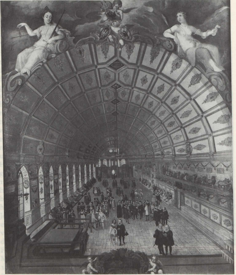
Abb. 3: Lorenz Hess, "Innenansicht des Nürnberger Großen Rathaussaales".

müssen. 18 Die Lichtführung in dem Bild "Johannes der Täufer bei Kerzenschein" setzt die Kunst Caravaggios (1571-1610) voraus. Das gleiche gilt für das in der Augsburger Barockkirche befindliche Bild Vorbrucks "Allegorie auf ein christliches Leben" von den Bayerischen Staatsgemäldesammlungen (Inv. Nr.: 1913; Abb. 4). 19 Heinrich Vorbruck [Porbruck],