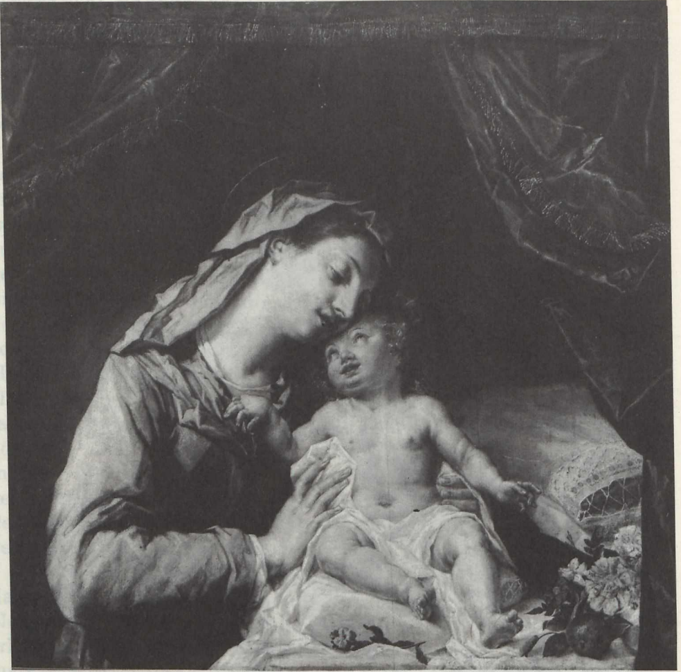
Abb. 7: Anton Langmair, "Maria mit Kind".