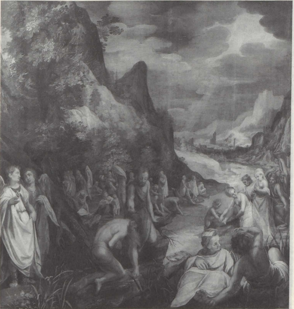
Abb. 2: Paul Juvenel, "Taufe Christi".

Abb. 3: Lorenz Hess "Innenansicht des Nürnberger Großen Rathssaals".