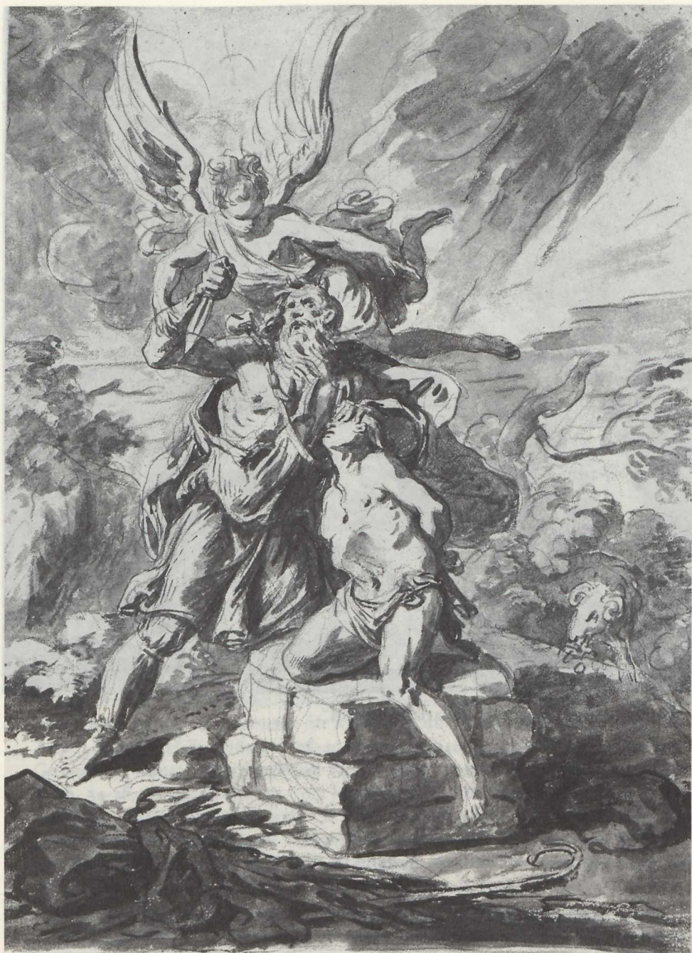
Abb. 6: Heinrich Popp, "Isaaks Opferung".