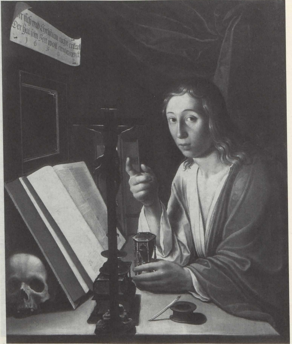
Abb. 5: Heinrich Vorbruck, "Allegorie auf ein christliches Leben".