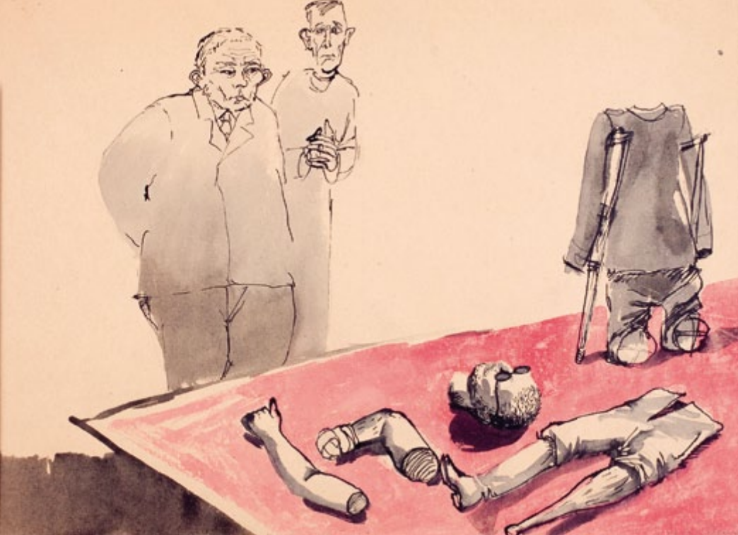
ANDRZEJ WRÓBLEWSKI „MUZEUM” 1956 [S.120] W SERCU KRAJU