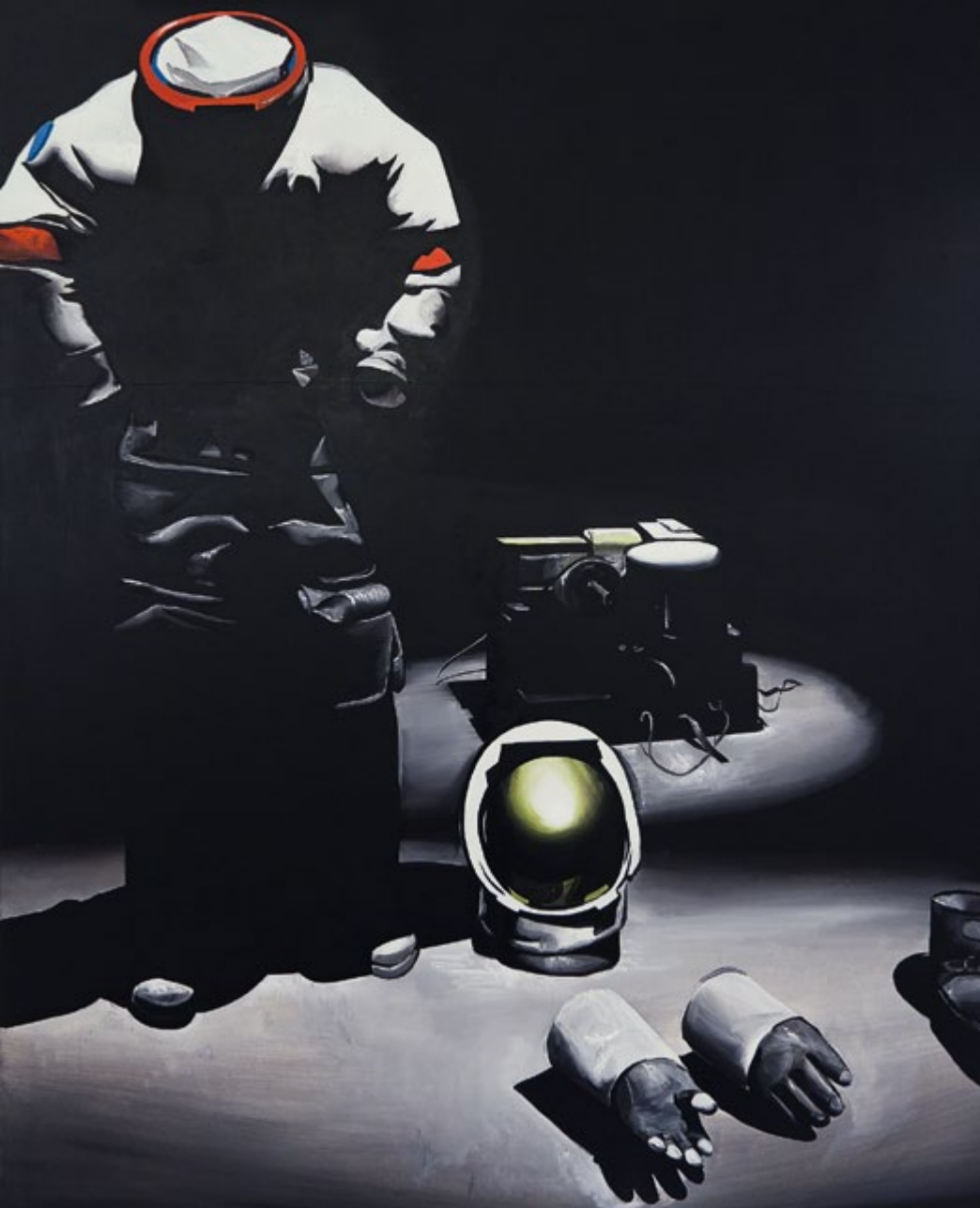
WILHELM SASNAL „BEZ TYTUŁU (ASTRONAUTA)” 2011 [s. 102] W SERCU KRAJU