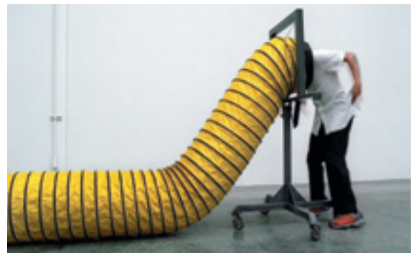
5 Mark Romanek/»Red Hot Chili Peppers«, »Can't stop«, 2003. In seinem Clip für die »Red Hot Chili Peppers« zitiert Romanek nicht nur Werke des zeitgenössischen österreichischen Konzeptkünstlers Erwin Wurm, sondern er reflektiert und denkt Wurms Kunstprinzip weiter: Da dieser seine Werke oft auch als Fotografien und Videoarbeiten ausstellt, nutzt Romanek das Medium des Clips, um die in den »One Minute Sculptures« Wurms geforderten Leistungen ins physikalisch Unmögliche zu steigern. Romanek dreht inzwischen erfolgreich Spielfilme, wie sein 2002 in die Kinos gekommenes und preisgekröntes Werk »One hour photo«.

Dass zu Berühmtheit gelangte Musikvideos irgendwann einmal selbst ein Bestandteil des kulturellen Fundus sein würden, aus dem