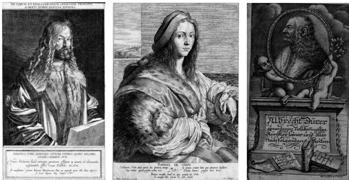
Abb. 3 (links): Lukas Kilian nach Johann Rottenhammer: Pictorum et chalcographor Germaniae Principis Alberti Dureri Genuina Effigies (Kupferstich, 340 x 205 mm), 1608.

sich wiederum an Dürers Selbstporträt auf dem Rosenkranzfest bezog (Abb. 3). 20 Gegenüber seiner Vorlage scheint Knorr die Grimmigkeit des Antlitzes Dürers eher noch verschärft zu haben, indem er das Kinn des Malers deutlich prominenter vorspringend gezeichnet hat, und damit dem gesamten Antlitz einen eher gedrungenen, harten Zug gegeben hat. Das Raffael-Porträt geht dagegen zurück auf einen Stich von Paulus Pontius (ca. 1630-1640), den dieser wiederum nach dem Selbstbildnis Raffaels in den Uffizien von 1506 fertigte. Im Gegensatz zum Original stattete Pontius Raffael in seinem Stich aber mit einem aufwändigeren, pelzbesetzten Rock aus (Abb. 3 u. 4). Außer dass er zu den beiden wohl prominentesten Porträts seiner Protagonisten griff, dürfte Knorr daher auch Wert darauf gelegt haben, dass beiden Künstlern durch ihre Kleidung ein ähnlicher, gehobener Stand zugewiesen ist. In ihrer sozialen Stellung wären sie damit als ihresgleichen beschrieben, in ihrem (physiognomischen) Charakter jedoch als oppositionelle Erscheinungen dargestellt.