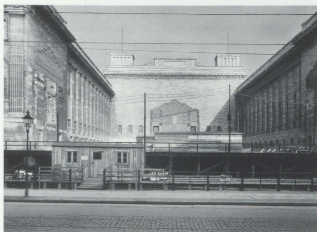
Abb. 5. Museumsneubauten, Blick vom Kupfergraben in den Ehrenhof, 1930

cher Mosaiken, endlich die von ihm erworbenen Reproduktionen der Höhlenmalereien griechischer Asketen aus dem Latmosgebirge und die während des Krieges angefertigten Kopien spätbyzantinischer Monumentalmalereien vom Balkan, die vorerst in Arbeitsräumen untergebracht waren und von denen er hoffte, sie nach Umgestaltung des Kaiser-Friedrich-Museums integriert mit den frühchristlichen und byzantinischen Altertümern ausstellen zu können. Damit nicht genug, forderte er zudem die Anschaffung von Kopien nach römischen Katakombenmalereien, Fresken aus den Athos- und Meteoraklöstern sowie von Hauptwerken der italienischen Freskokunst des Quattrocento und des Cinquecento. Vorbildlich schienen ihm in dieser Auffassung das Londoner South-Kensington-Museum 25 , die St. Petersburger Kunstakademie und das in Moskau im Entstehen begriffene Museum Alexander III. 24 zu sein. In solcher räumlichen Vereinigung von Originalen und Kopien glaubte Wulff eine sinnvolle gegenseitige Ergänzung zu erblicken, die die Grundlage für eine neu zu belebende Kooperation zwischen Museen, Universitäten und Kunstakademien darstellen könnte, zumal er sich davon u.a. eine Neubelebung der Wandmalerei und Gesundung der expressionistischen Kunstströmung versprach. 25