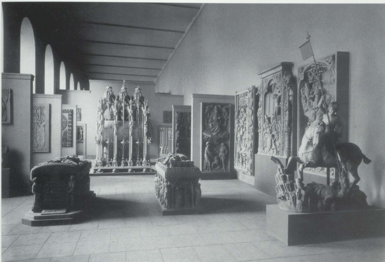
Abb. 13. Gipsgalerie des Deutschen Museums, Saal 8 (»Saal des Sebaldusgrabes«), 1930–1934

Gestalt der beiden Wissenschaftler einander begegnete, waren zwei Anschauungen vom Kunstmuseum. Während Wulff – sich selbst als systematisierenden Wissenschaftler und Lehrer verstehend – dieses als Organ auffaßte, das die kulturelle Geschichte als ein anschauliches und lückenlos darstellbares System zu gestalten hatte, als Gehäuse, in dem geschichtsreife Erkenntnisse ihre spezifische materielle Umsetzung erfahren sollten, 73 vertrat Demmler vielmehr – von Bode geprägt – jene Konzeption, die dem Kunstwerk – allein anerkannt in der Gestalt des Originals – einen höheren Wert als den eines historisch bewahrenswerten Gliedes in der Kette kultureller Menschheitsentwicklung zumaß, das nicht in seiner Bestimmung als Objekt der Wissenschaft und möglicherweise noch der Volksbildung aufzugehen hatte. Es war Demmler nicht mehr um die lückenlose Darstellung einer Menschheitsgeschichte der Kunst zu tun. Gestützt auf das Ethos der subjektiven Kennerschaft und der Sammlerästhetik galt ihm das Museum vor allem als Stätte des Genusses, die neben wissenschaftlichen und pädagogischen