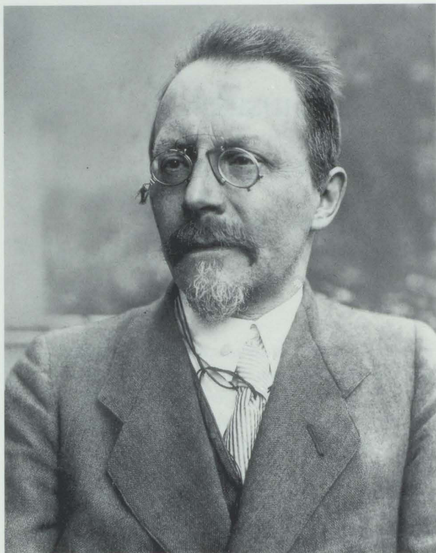
Abb. 1. Oscar Wulff, 1925