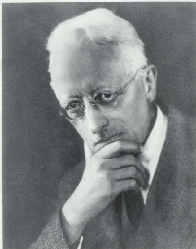
Abb. 2. Theodor Demmler, ca. 1935

Sammlung hinsichtlich der byzantinischen und altrussischen Kunst Ausdruck zu geben 4 , verband damit aber zugleich die Möglichkeit, seine grundsätzliche Kritik an verhängnisvollen Tendenzen des Berliner Museumswesens im allgemeinen als auch an den Plänen und Konzeptionen für das vor der Vollendung stehende Deutsche Museum im besonderen darzustellen. 5