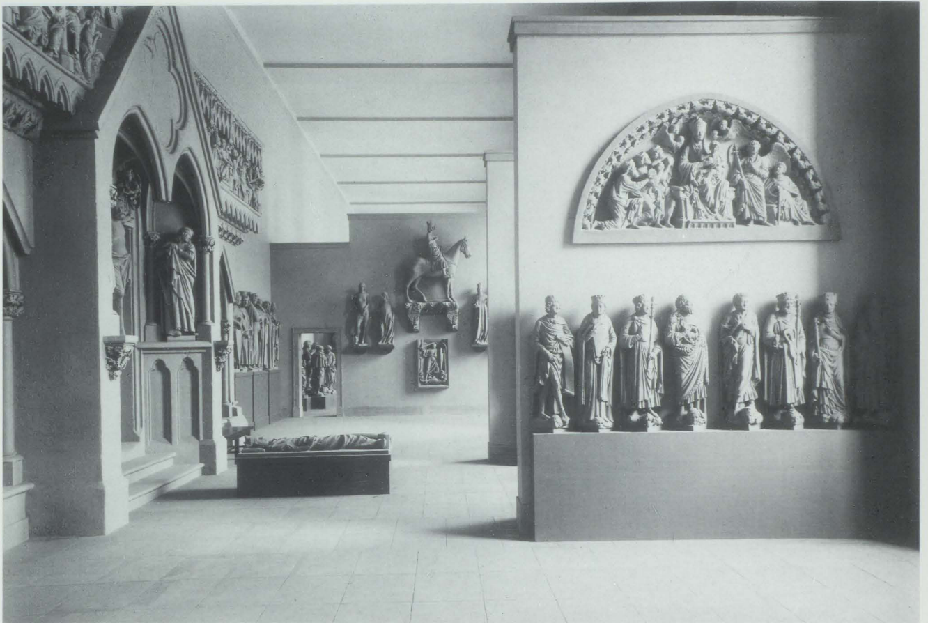
Abb. 12/12a. Gipsgalerie des Deutschen Museums, Saal 7 (»Naumburger Saal«), 1930–1934