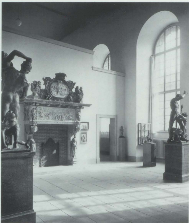
Abb. 15. Deutsches Museum, Aufstellung der Skulptur des Manierismus im Saal 6 der ehem. Gipsgalerie, 1937–1939

ste, die den Krieg überstanden haben und auf der Museumsinsel verwahrt worden sind, berühren. Gewiß nicht im Sinne von 1927, denn daß nach 65 Jahren ein ähnlich kontroverser Streit mit gleichartiger Heftigkeit ausgefochten werden könnte, sollte eher unwahr-