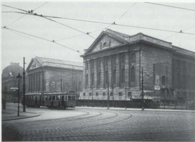
Abb. 4. Museumsneubauten, Blick von der Dorotheenstraße Ecke Kupfergraben, 1930