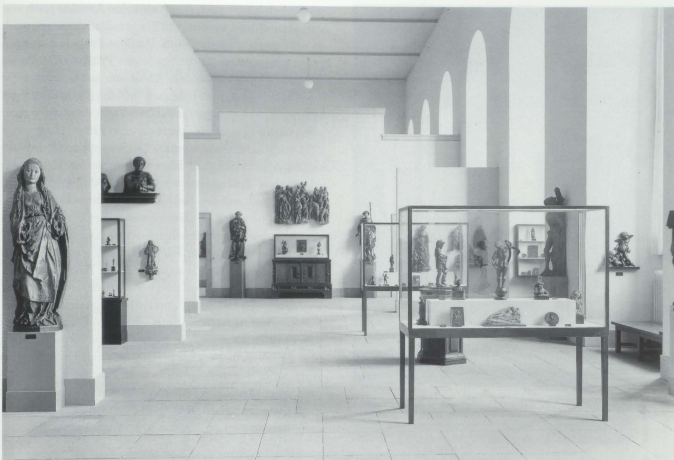
Abb. 14. Deutsches Museum, Ausstellung deutscher Renaissanceplastik im Saal 7 der ehem. Gipsгалerie, 1957–1959

sprach von billiger Volksbildung und verfehlten Museumszielen und faßte sein Unbehagen in dem Satz zusammen: »Die Monstrosität dieser Totenkammer erfüllt einen mit den unangenehmsten Gefühlen.« 84 Eine dritte am 27. November abgedruckte Stimme versuchte auszugleichen und verteidigte die Berliner Lösung als vertretbaren Kompromiß. 85