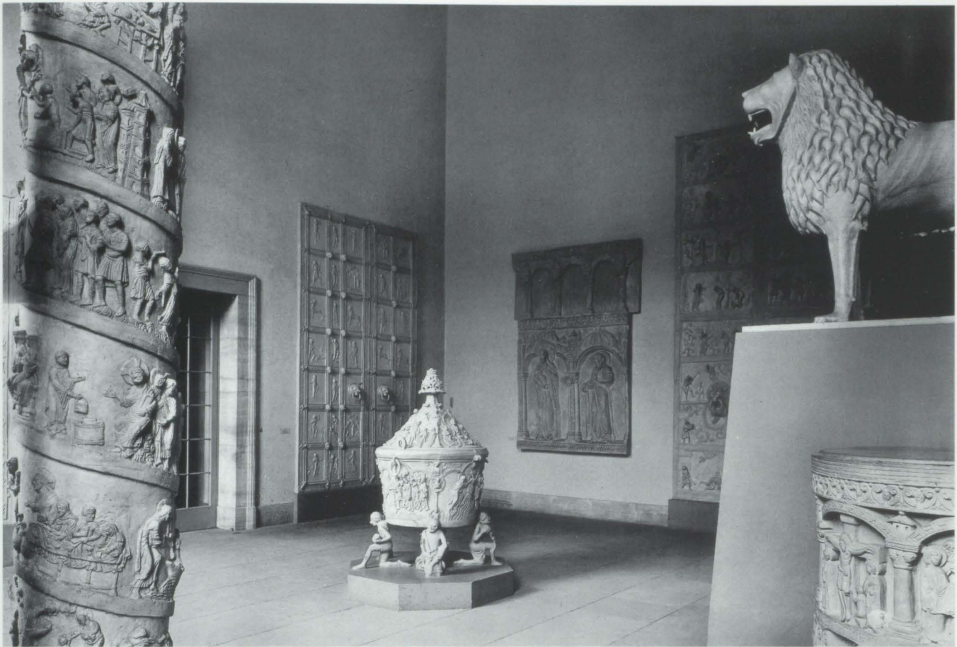
Abb. 11. Gipsгалerie des Deutschen Museums, Saal 6 (»Romanischer Saal«), 1930–1934

die als Forschungseinrichtungen des Nebeneinanders von Schau- und Lehrsammlungen bedürften, um in letzteren »den Fortschritt unserer Erkenntnis zur Anschauung« 68 zu bringen. Dem ihm entgegengehaltenen Argument, Gipse würden die Schulung des Geschmacks hintertreiben, erwiderte er hartnäckig: »Daß diese Sammlungen auch zur Einführung der weniger vorgebildeten Volkskreise notwendig sind, bevor man sie an die Originale heranzuführen kann, hat mir die langjährige Erfahrung solcher Museumsführungen bewiesen. Nur ein geschworener »Sammlerästhet« könnte behaupten, daß den »Empfänglichen« unter ihnen ein einziges Original, zum Beispiel eines der schönen Madonnenreliefs Ghibertis mehr sagt als der Abguß seiner Tür und anderer Werke. Darum halte ich die örtliche Trennung der Schau- und Lehrsammlungen für ein falsches Ziel . . .« 69