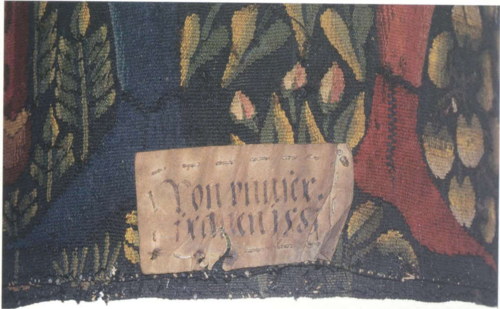
Abb. 18 Pergamentstreifen mit handschriftlichem Vermerk auf der Rückseite des Josephsteppichs, um 1580

Von den beiden Stifterwappen ist nur das obere, seitenverkehrt in die linke Randbordüre eingearbeitete der Familie Schopper zweifelsfrei zu identifizieren. Das untere, zur Hälfte beschnittene, wurde aufgrund des sichtbar gebliebenen steigenden Löwen mit dem längs gespaltenen Schild der Muffel identifiziert, dessen zweite Figur, ein Fisch, der Beschneidung zum Opfer gefallen wäre. Die Familie Schopper ist zur Entstehungszeit des Josephsteppichs mit archivalisch belegten Teppichstiftungen für die Frauenkirche greifbar 109 .