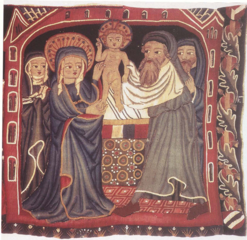
Abb. 11 Darbringung im Tempel aus einem Bildteppich mit Szenen aus dem Marienleben Nürnberg, um 1420/30 Fürstliche Kunstsammlung Oettingen-Wallerstein, Harburg

Ausarbeitung hat man sich mit zusätzlichen textilen Randeinfassungen in der Form von Besatzstreifen und Fransenborten zu denken, wie sie etwa ein Eintrag im Salbuch der Frauenkirche überliefert: »Item Mertein beheim hat geben dem gotzhaus ein gewurkts altar tuch mit peheim und schopper schillten, die sammat leisten (Besatzstreifen aus Samt, Z-S) mit gefrens (Fransenborte, Z-S) zalt die kirchen. 1465« 85 . Bei der Umsetzung des Entwurfs in die Wirkerei wurden in die im 90°-Winkel zur Bildrichtung verlaufende Leinenkette überwiegend Wolle und Leinen eingetragen. Seide und Metallfäden, wie man sie bisweilen reichlich zur Hervorhebung und Differenzierung von Motiven und Oberflächen verwendete, sind nur vereinzelt anzutreffen. Allein das gelockte Haar des Erzengels ist parallel zu den Strähnen aus brauner Wolle mit solchen aus heller Seide gehöht. Metallfäden, für die Lahn um einen Seidenfaden gesponnen wurde, finden sich an der Dalmatik des Erzengels und am Nimbus der Heilig-Geist-Taube.