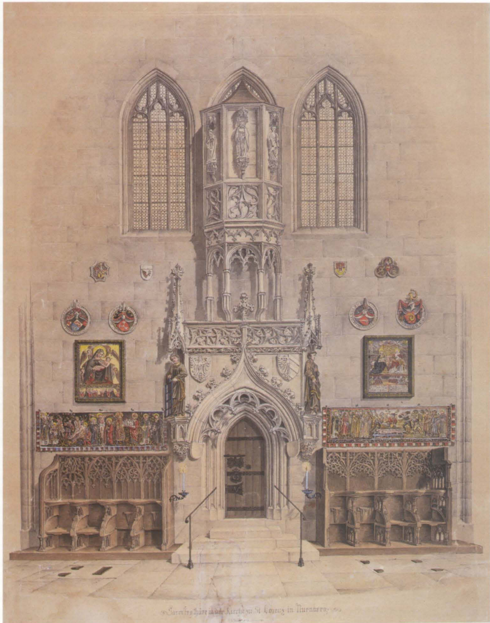
Abb. 9 Bildteppiche am Eingang zur Sakristei der Nürnberger St. Lorenzkirche Aquarellierte Federzeichnung von Georg Christoph Wilder, 1836 Germanisches Nationalmuseum, Nürnberg, Graphische Sammlung, SP 6424