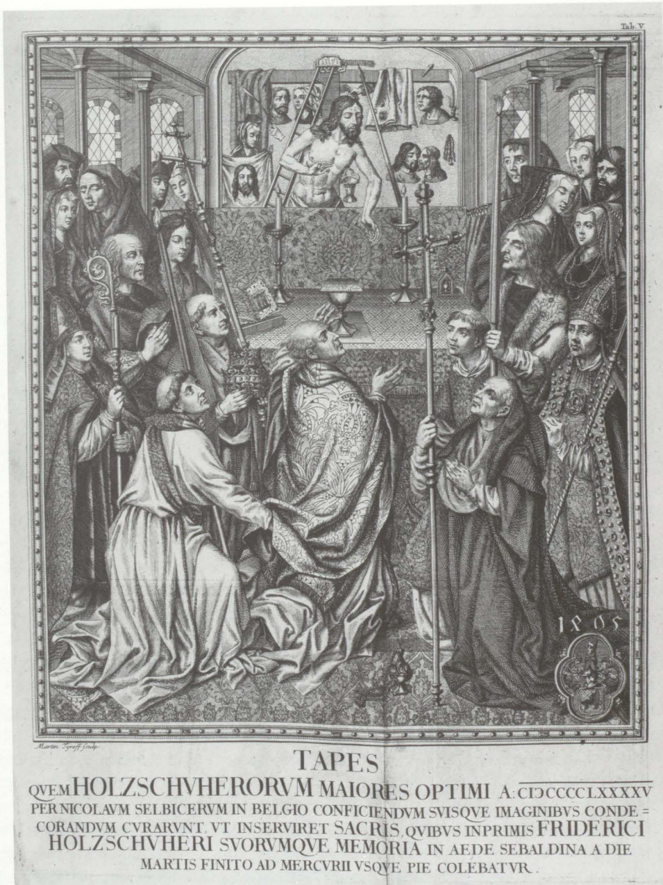
Abb. 8 Grabteppich der Familie Holzschuher von 1495 Kupferstich von Martin Tyroff aus: Johann Christoph Gatterer: Historia geneologica dominorum Holzschuherorum, Nürnberg 1755