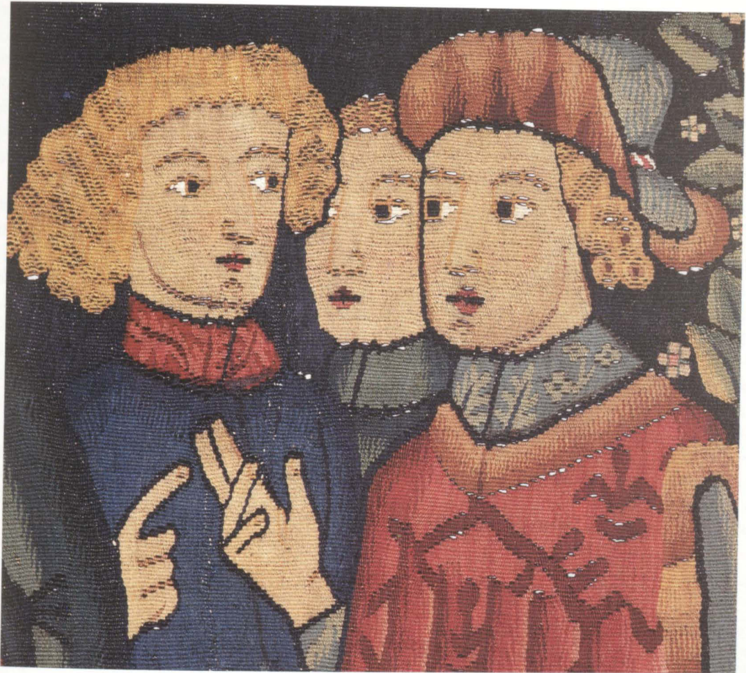
Abb. 17 Bildteppich mit Szenen der Josephsgeschichte: Modellierung von Haaren und Händen durch Kettspalteffekte

durch Ausblicke und Tiefenräume eben jene niederländischen, durch die Malerei vermittelten Einflüsse erkennen lassen, schließen die eng gefügten Gruppen nahezu gleichgroßer Personen den Bildraum fast hermetisch ab 102 . Zugleich bewirkt die nahsichtige Präsenz der handelnden Figuren eine eindringliche Verdichtung des Geschehens. Stilistisch steht der Josephsteppich den älterer Nürnberger Tradition verpflichteten Arbeiten der sogenannten »Maler des Übergangs« im Umkreis des Meisters des Wolfgangsaltars nahe 103 . Als verbindende Elemente zeigen sich die geringe Raumtiefe, relativ starre, durch wiederkehrende Gesten bewegte Figuren, die Ausbildung der Hände sowie Kostümformen.