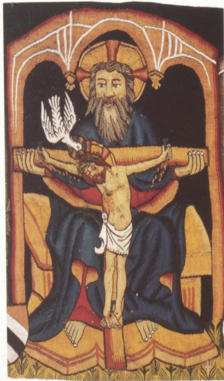
Abb. 12 Gnadenstuhl (Rückseite, Detail von Abb. 2)

Der Effekt des ursprünglich wohl vergoldeten Silbers ist jedoch nirgends mehr vorhanden, nachdem das Metall abgerieben und dunkel oxydiert ist. Auch die ehemalige Farbigkeit ist durch Lichtwirkung reduziert, wovon vor allem Rottöne betroffen sind. Eine Aufnahme der Teppichrückseite während der Restaurierung 1985/87 zeigt deutlich kräftigere Farbwerte als die Vorderseite (Abb. 2) 86 . Besonders auffällig sind die Verluste bei dem ehemals roten Gewand unter dem Mantel Gottvaters, den Lippen, den Blutstropfen der Wunden Christi sowie bei den roten Wappenschilden, die sämtlich nur noch einen schwachen Beigeton aufweisen (Abb. 12).