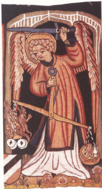
Abb. 10 Erzengel Michael als Seelenwäger (Detail von Abb. 1)