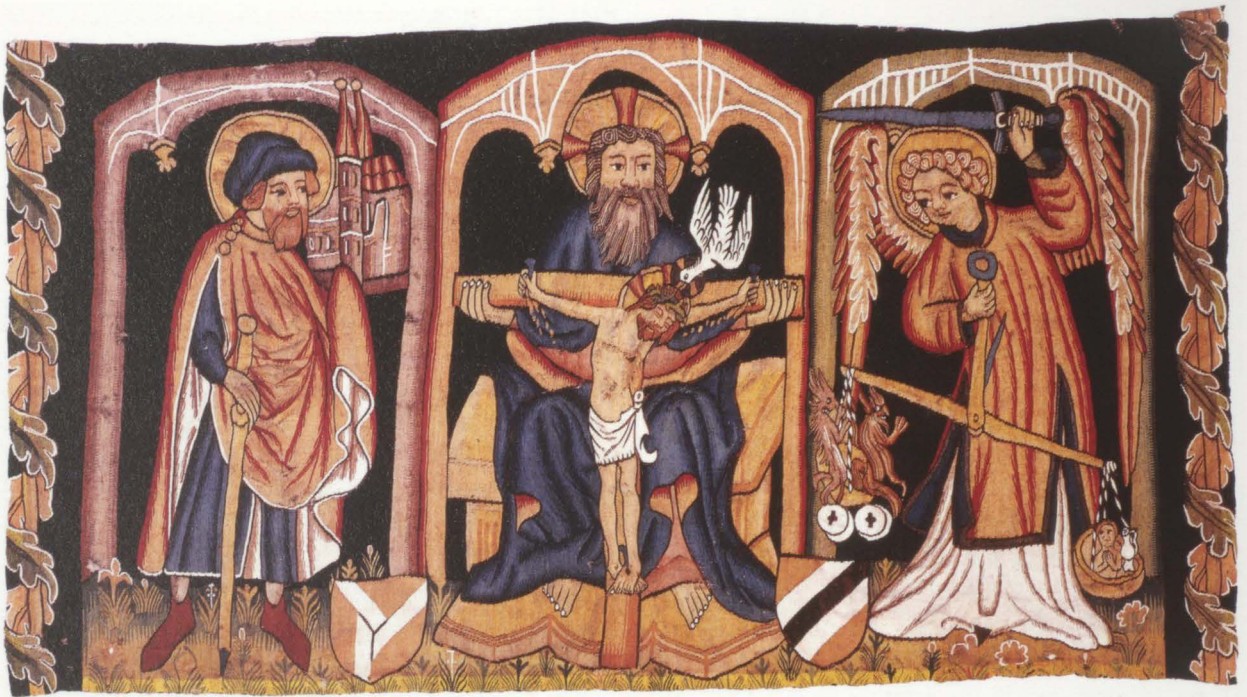
Abb. 1 und 2 (Rückseite) Bildteppich mit Gnadenstuhl, hl. Sebald und Erzengel Michael Nürnberg, um 1410/20 Wirkerei, Leinen, Wolle, Seide, Metallfäden, Höhe 75 cm, Breite 135 cm Germanisches Nationalmuseum, Nürnberg, Inv.Nr. Gew 5048 Erworben durch die Ernst von Siemens Kunststiftung, als Dauerleihgabe im Germanischen Nationalmuseum