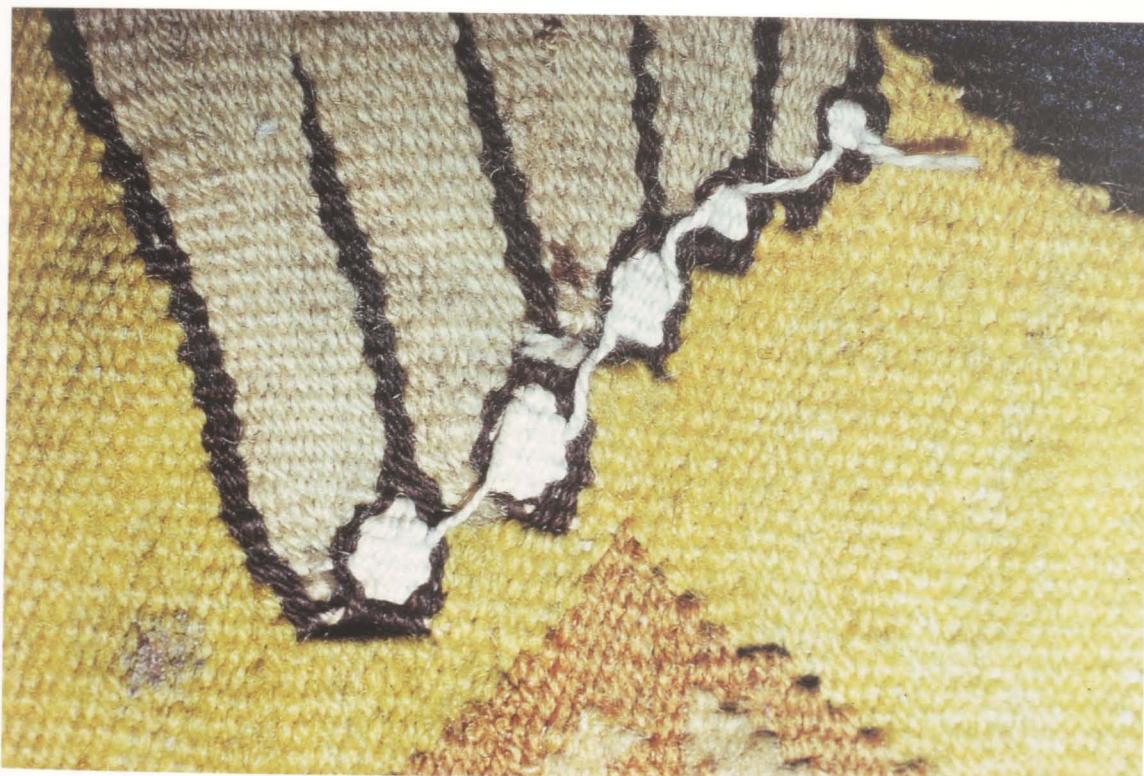
Abb. 13 Fuß Gottvaters mit rückseitigen Fadensprüngen (Detail von Abb. 2)

linken Hand, und das Stifterwappen der Zenner – das Deichslersche zeigt keine Rechts-Links-Ausrichtung – ist seitenverkehrt wiedergegeben. Der grundsätzlich auch von anderen Reproduktionstechniken her vertraute Vorgang einer unfreiwillig gespiegelten Wiedergabe ist in der Wirkerei kein Einzelfall, doch ist es bemerkenswert, diesen »Fehler« bei einem so zentralen, in seiner Ikonographie festgelegten Glaubensbild wie dem gekreuzigten Christus anzutreffen.