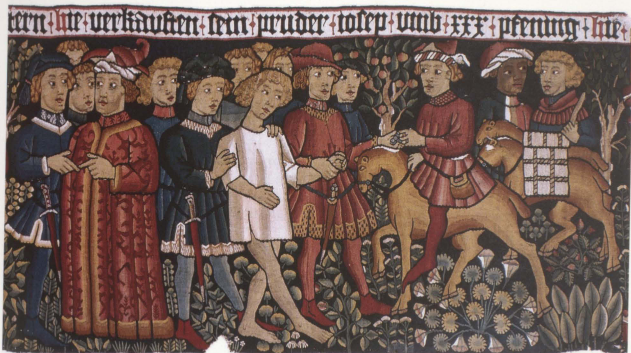
Abb. 3 und 4 (Rückseite)

Joseph wird von seinen Brüdern verkauft, aus dem Bildteppich mit Szenen der Josephsgeschichte Nürnberg, um 1460, Wirkerei, Leinen, Wolle, Metallfäden, Höhe 75,5 cm, Breite 561 cm Germanisches Nationalmuseum, Nürnberg, Inv.Nr. Gew 5049 Erworben mit Unterstützung der Kulturstiftung der Länder, des Bundesministeriums des Innern und der Bayerischen Landesstiftung