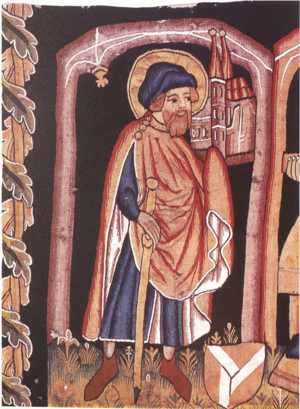
Abb. 14 St. Sebald mit Kirchenmodell (Detail von Abb. 1)