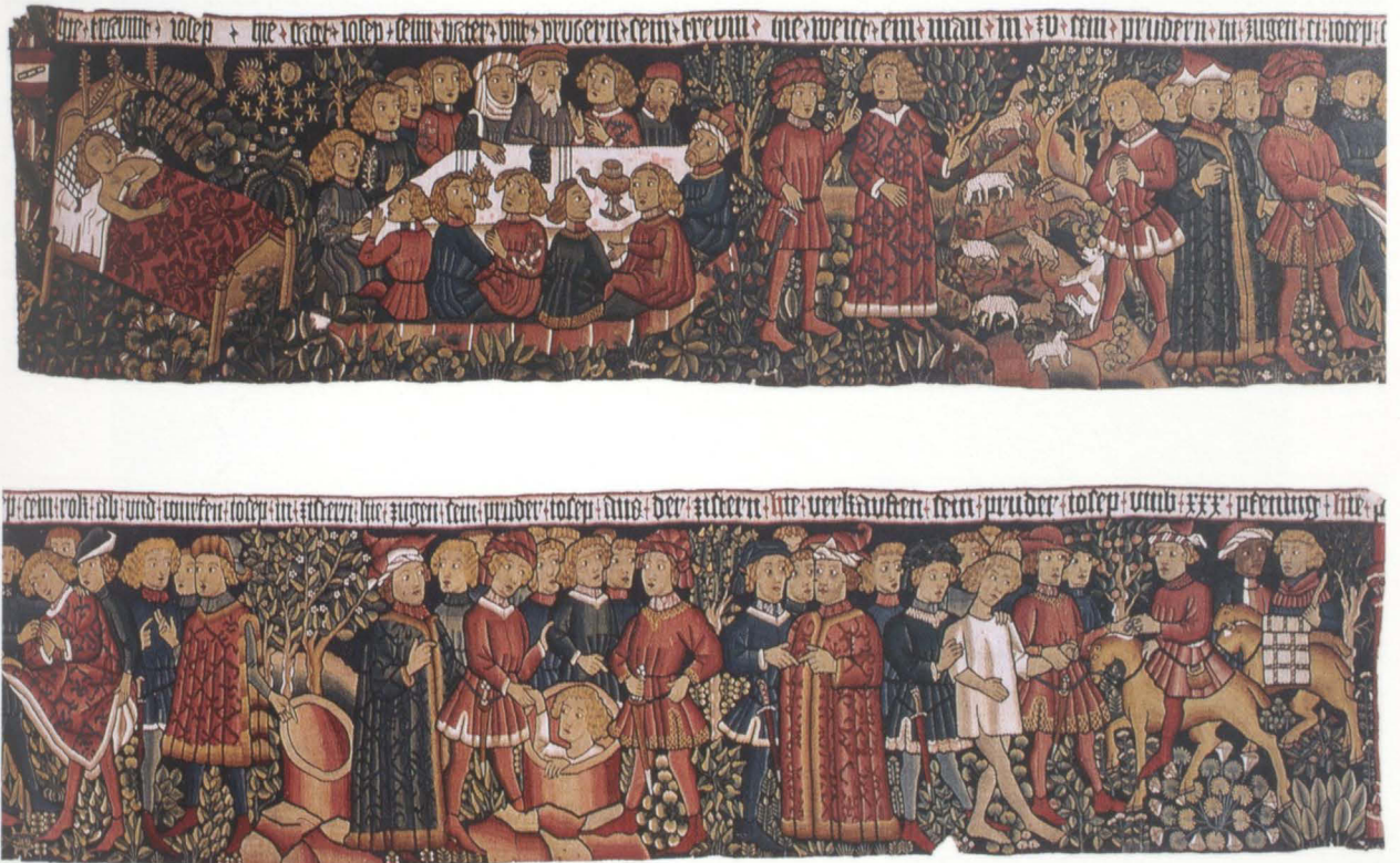
Abb. 16 Bildteppich mit Szenen der Josephsgeschichte Nürnberg, um 1460, Höhe 75,5 cm, Breite 561 cm Germanisches Nationalmuseum, Nürnberg, Inv.Nr. Gew 5049 Erworben mit Unterstützung der Kulturstiftung der Länder, des Bundesministeriums des Innern und der Bayerischen Landesstiftung

Der Behang zeigt sechs Episoden der im Alten Testament berichteten Geschichte des Joseph von Ägypten (1. Mose 37) (Abb. 16) 99 . Den Anfang markiert eine im heutigen Zustand schräg nach unten beschnittene Blattstabbordüre mit den Stifterwappen der Familien Schopper und Muffel (?). Am oberen Rand ist in gotischer Minuskelschrift eine einzeilige Schriftleiste angefügt, die den Inhalt jedes Bildes überschriftartig zusammenfasst: Die erste Szene (»hie traumt josep«) zeigt den nackten Joseph schlafend in einem Baldachinbett, dessen Ausstattung mit blau kariertem Kopfkissen, weißem Laken und roter Bettdecke mit Granatapfelmuster lokaler Tradition entspricht 100 . Oberhalb des Bettes sind seine Träume angedeutet, die die nachfolgenden Ereignisse auslösten: Im ersten Traum verbeugen sich die