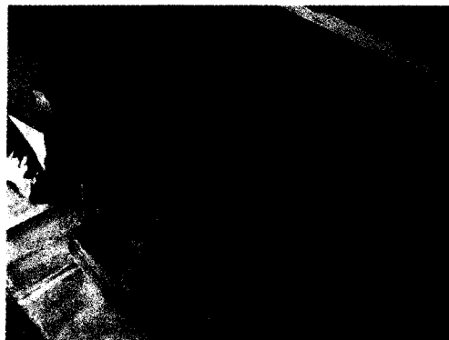
Abb. 1: Archivmaterial