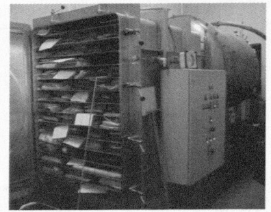
Abb. 2: Vakuumkammer mit Kondensator: geöffnete Vakuumkammer mit Trocknungsgut

Für die Vor- und Nachbereitung von Restaurierungsarbeiten stehen in unserem Hause sowohl alle technischen Möglichkeiten als auch die notwendi-