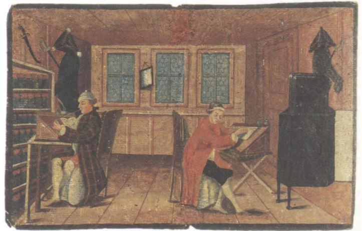
Abb. 4 Studenten im Schlafrock bei der Arbeit, Stammbuchblatt, Erlangen 1763