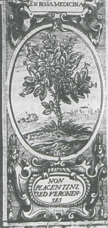
4. Panegyryk Skorulskich, fragment ryt. Tomasz Makowski, 1604. Neg. MNW. / The Skorulski Family Panegyric, a fragm., engr. Tomasz Makowski, 1604. Neg. The National Museum in Warsaw.

tantus fastigia rerum, sterior locat: stemmate mundas una tenere decet. regare leonem gravitatis inest, lausit abumiam ferper honore eadi fulminis instar solis ad usq. rotam. mem tu quos, Princeps mente valente geris, osters tua postulat altes, e venenanda iuket. res Uimana reppetit, fata serena capit. virtus culmen honorum neou perenni solo tu plus virtute mereris nais reddere regna tibi Clauserat Augustus Iani conpagibus arctis Lumina, post pacem Martis silentis datam. Vni me Phabi sacris feruoribus ardor, Ut pungam genti nuntia lata mori Zur Raduilen qui sublimantur honores, Augusti nobis gaudia morre ferant. Aurea pax veniet (cortinas ovacula dicat) Quanto MATER PATRIE mentia prima tenet. Non opus est calidam de templo spargere hoste. Non opus est lacrimis sollicitare patum. Zur prius ad bellum nocte sedicq. patebant, lam poterunt placida suna quiete frui. Graduuus postis tabefeci belliger armis, In falces ibunt areca scuta leuis. Vineta adamantatis discordia serua eademis, Capere perpetuo clausa putrefcet iners, Simplicitum superis Augusta et gradus salta Consilio Augusto DVX RADIVILVS obit Ergo decet tanto donari et fiedera pacis, Pacis et Augustus conciliator erat. Nicolaus Skorulski SEALIS INSECRANTO. VS LATRI OSAMPATE T