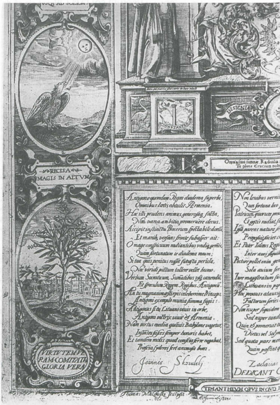
3. Panegyryk Skorulskich, fragment, ryt. Tomasz Makowski, 1604. / The Skorulski Family Panegyric, a fragm., engr. Tomasz Makowski, 1604.