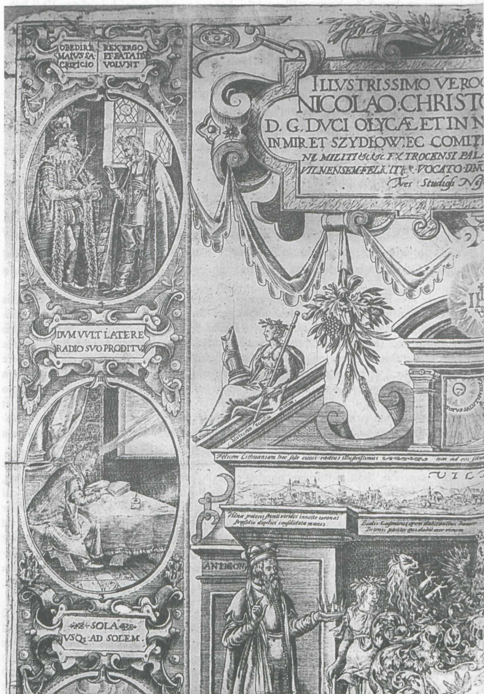
2. Panegiryk Skorulskich, fragment, ryt. Tomasz Makowski, 1604. / The Skorulski Family Panegyric, fragm. engr. Tomasz Makowski, 1604.