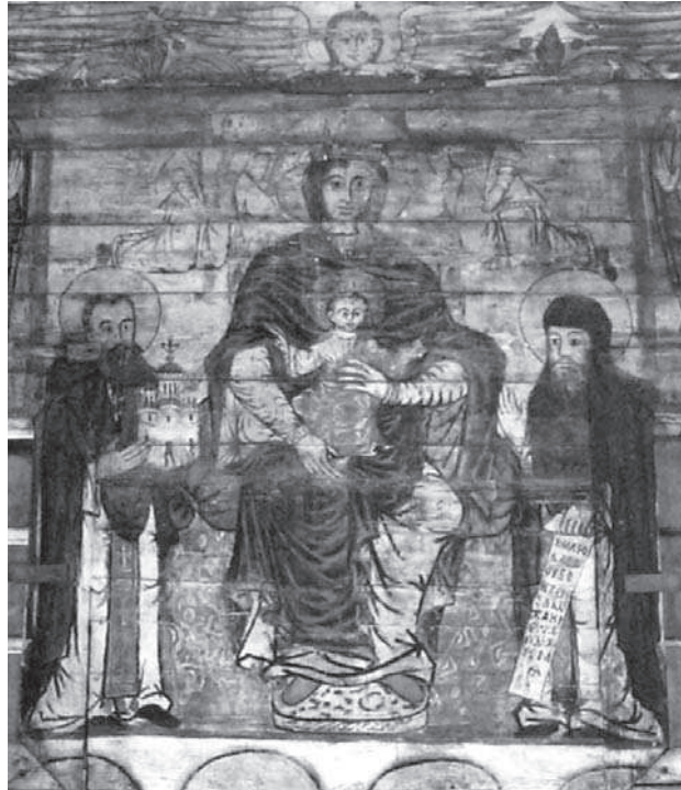
Іл. 1. Потелич, церква Святого Духа.

Богородиця з Дитям на престолі, обабіч св. Антоній і св. Феодосій