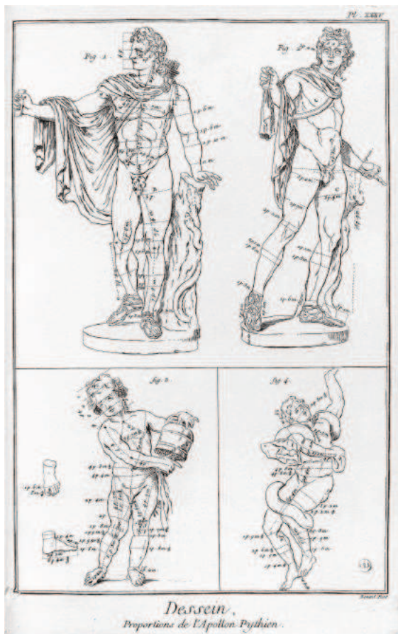
2. Apollo Belwederski. Denis Diderot, Jean Le Rond D'Alembert, Encyclopedie, ou Dictionnaire raisonne des sciences, des arts et des metiers, Paris 1751–1772, plansza 35