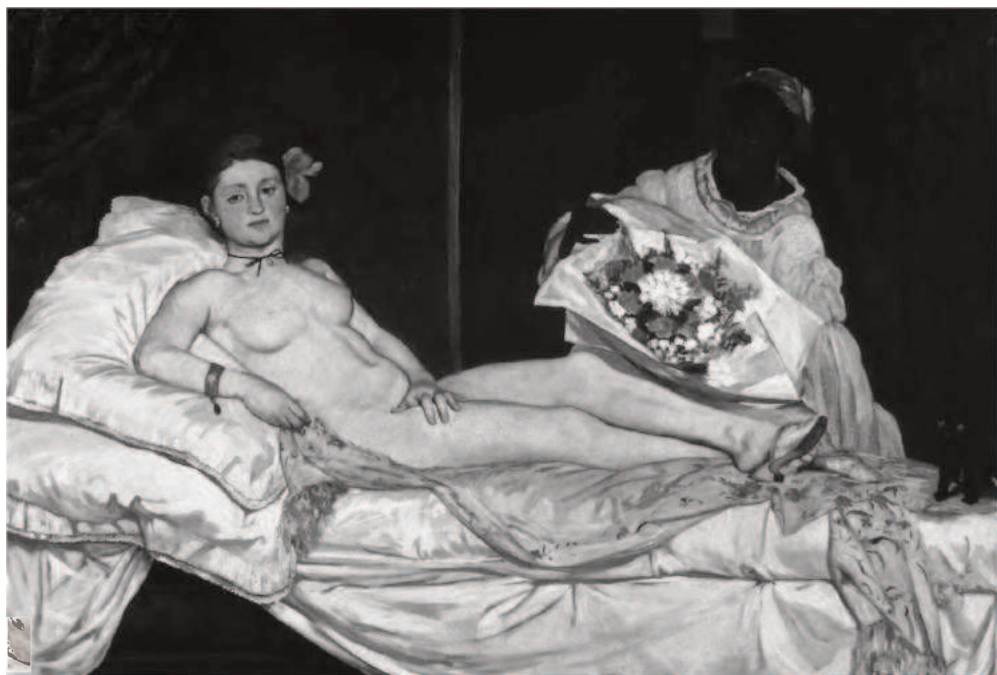
9. Edouard Manet, Olimpia , 1863, Musée d'Orsay, Paryż