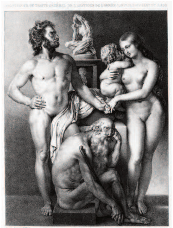
6. Jean–Marc Bourguery, Nicolas–Henri Jacob, Traite complet de l’anatomie de l’homme , Paris 1832–1854, frontispis, repr. Jacek Marczuk