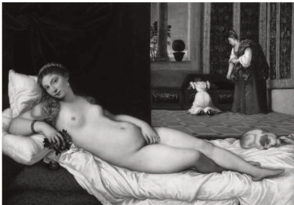
8. Tycjan, Wenus z Urbino , 1538, Galeria degli Uffizzi, Florencja.