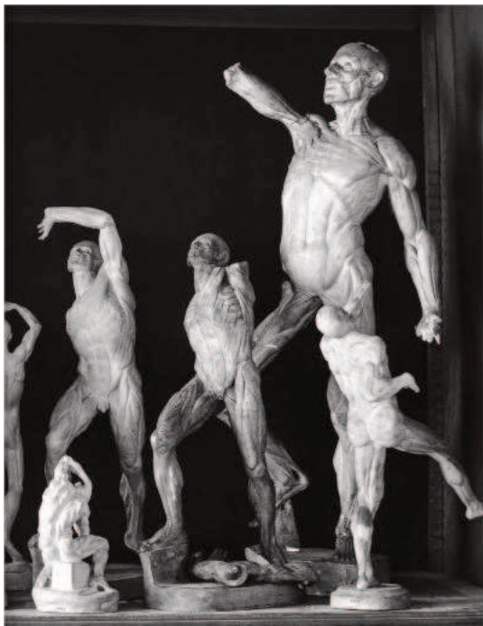
7. Zbiory anatomiczne Ecole des Beaux-Arts w Paryżu, galeria Huguier, fragm. fotografii Phillippe Colmar, repr. Jacek Marczuk wg kat. wyst. Une leçon d'anatomie. Figures du corps à l'Ecole des Beaux-Arts , Paryż 2009, s. 130