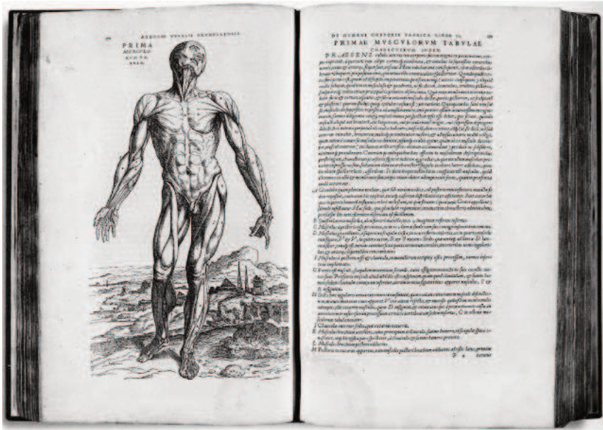
5. Prima musculorum tabula , ilustracja dzieła Andrea Vesaliusa De Humani corporis fabrica , Bazylea 1543, s. 170–171