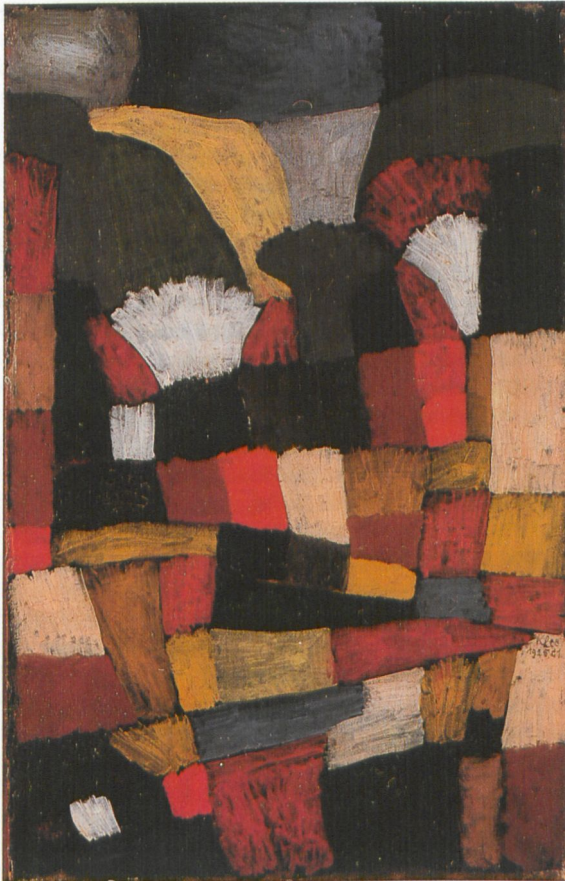
PAUL KLEE, Garten in PH , 1925, Staatsgalerie moderner Kunst, München