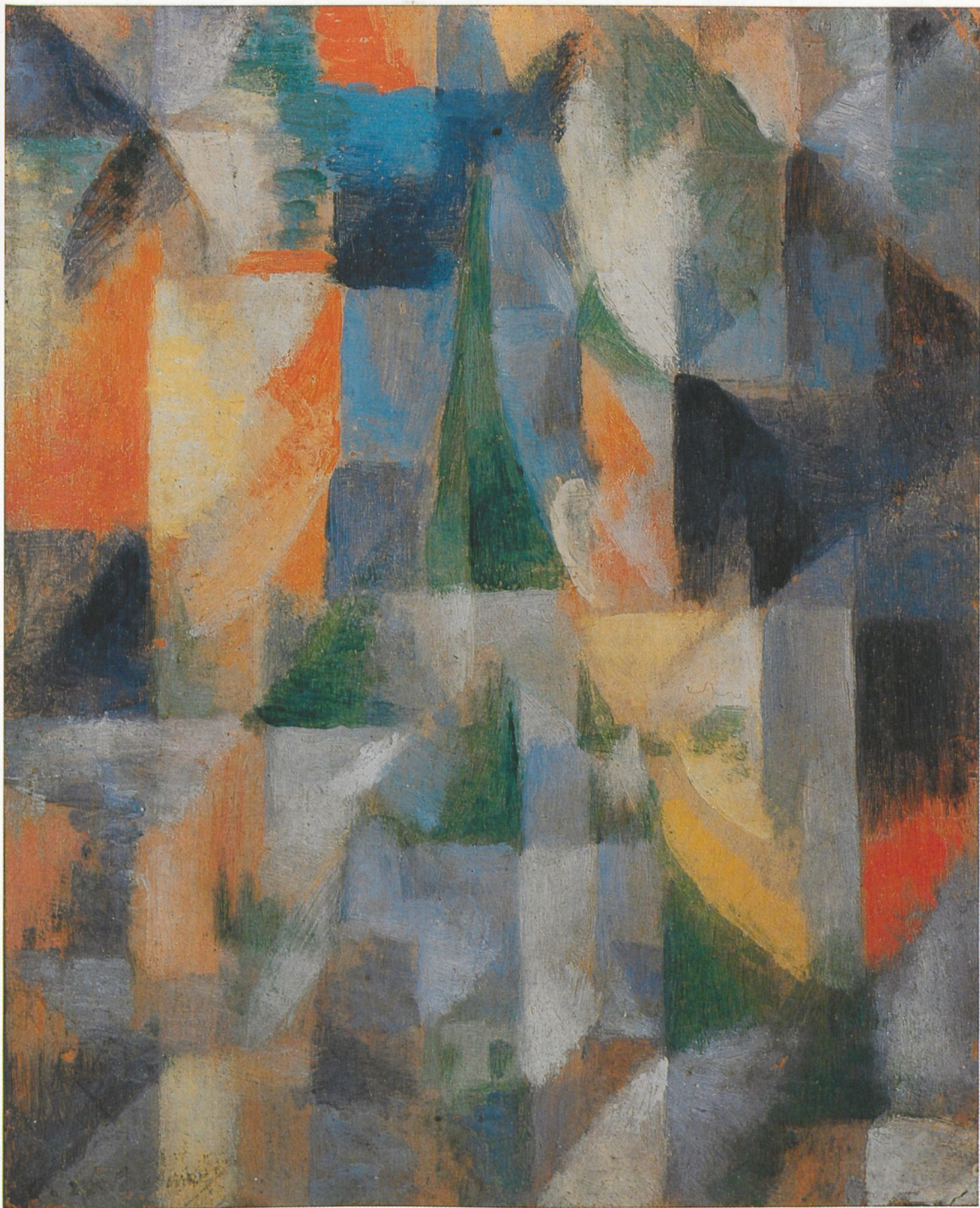
ROBERT DELAUNAY, Fenêtre sur la ville , 1914, Wachskreide auf Papier, Städtische Galerie im Lenbachhaus, München

Werk.« Der Künstler »tut an der ihm zugewiesenen Stelle beim Stamme . . . gar nichts anderes, als aus der Tiefe Kommendes zu sammeln und weiterzuleiten. Weder dienen, noch herrschen, nur vermitteln . . .« »Beim Kunstwerk, das der Krone verglichen wurde, handelt es sich um die deformatrische Notwendigkeit durch den Eintritt in die spezifischen Dimensionen des Bild-