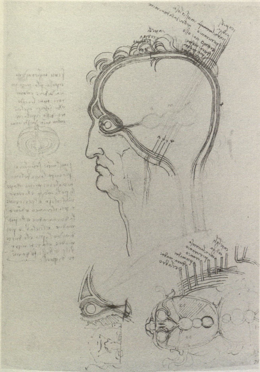
1. Leonardo, Taglio longitudinale e trasversale attraverso il cranio umano. Windsor Castle, Royal Library (RL 12603).