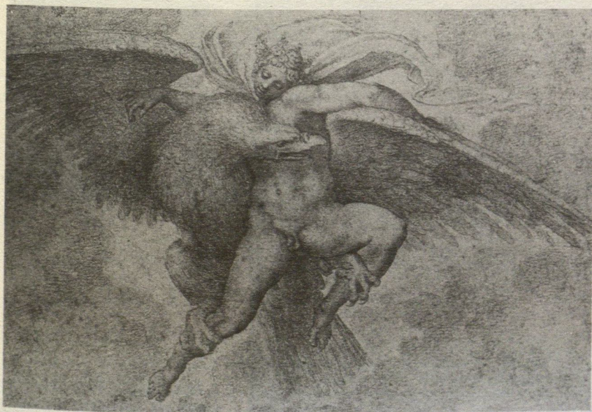
4. Michelangelo, Ratto di Ganimede . Cambridge, Mass., Fogg Art Museum, Harvard University.