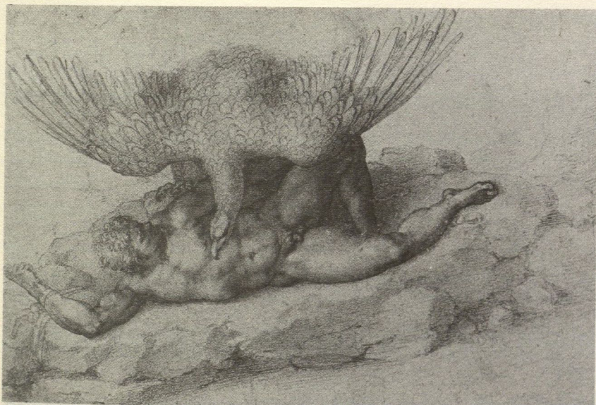
3. Michelangelo, Punizione di Tityos . Windsor Castle, Royal Library.