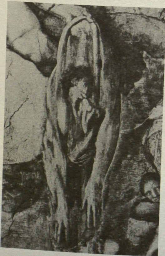
6. Michelangelo, Pelle di Bartolomeo con l'auto-ritratto , Giudizio Universale . Roma, Città del Vaticano, Cappella Sistina.