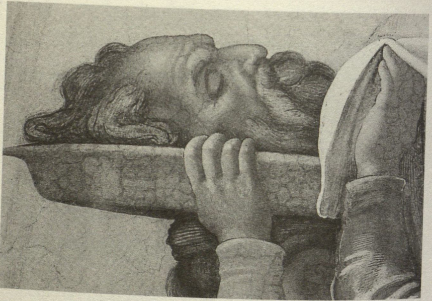
5. Michelangelo, Giuditta e Oloferne , dettaglio della testa di Oloferne decapitato con l'auto-ritratto. Roma, Città del Vaticano, Cappella Sistina.