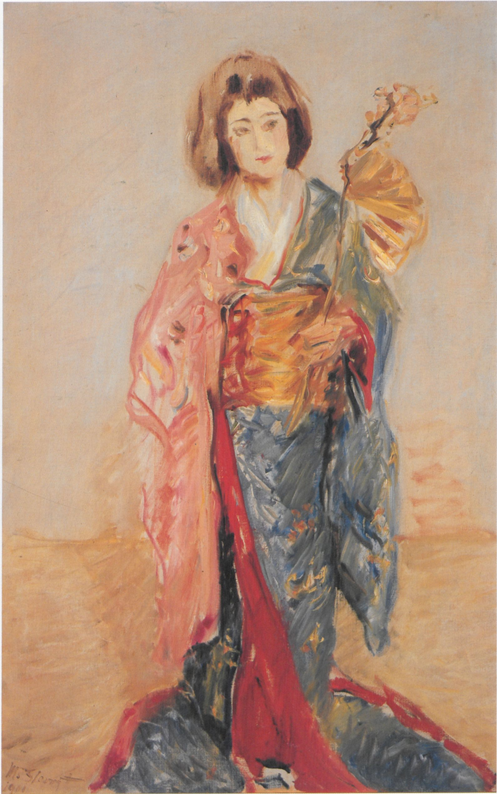
48 Sado Yakko, 1901