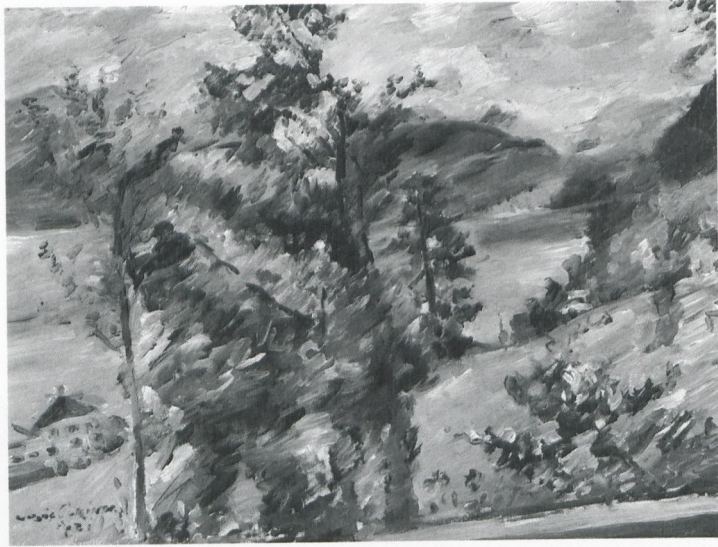
1 Lovis Corinth, Walchensee , 1921