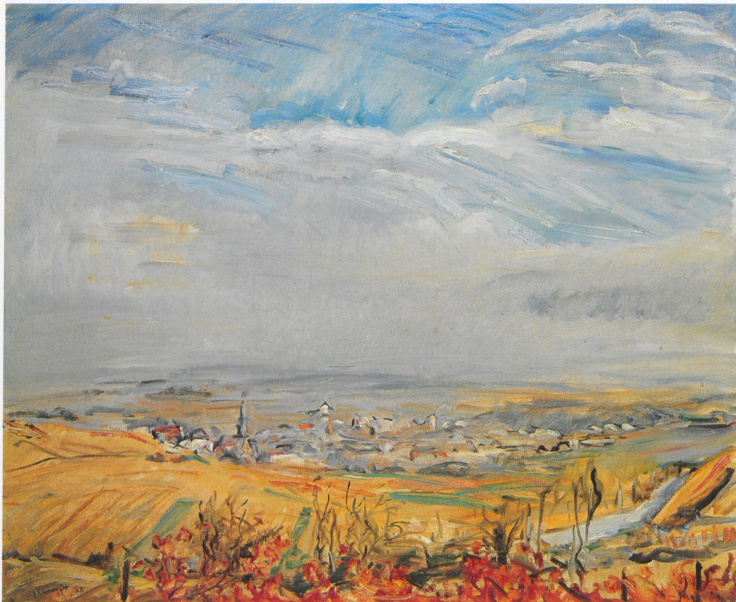
200 Blick auf Kallstadt im Herbst, 1928