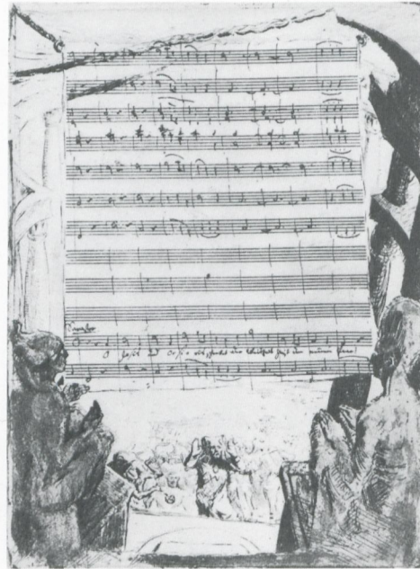
10 Max Slevogt, Es lebe Sarastro , aus Die Zauberflöte , 1918