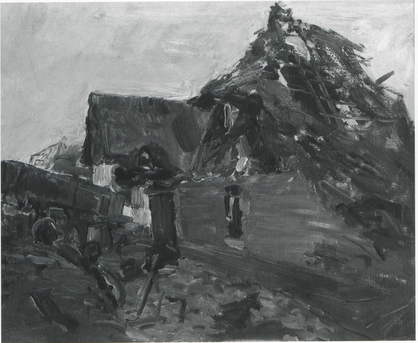
127 Zerstörtes Haus in Ennetières, 1914