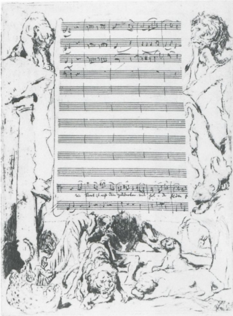
7 Max Slevogt, Wie stark ist nicht dein Zauberton , aus Die Zauberflöte , 1918