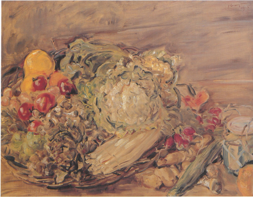
186 Gemüsstilleben , 1925