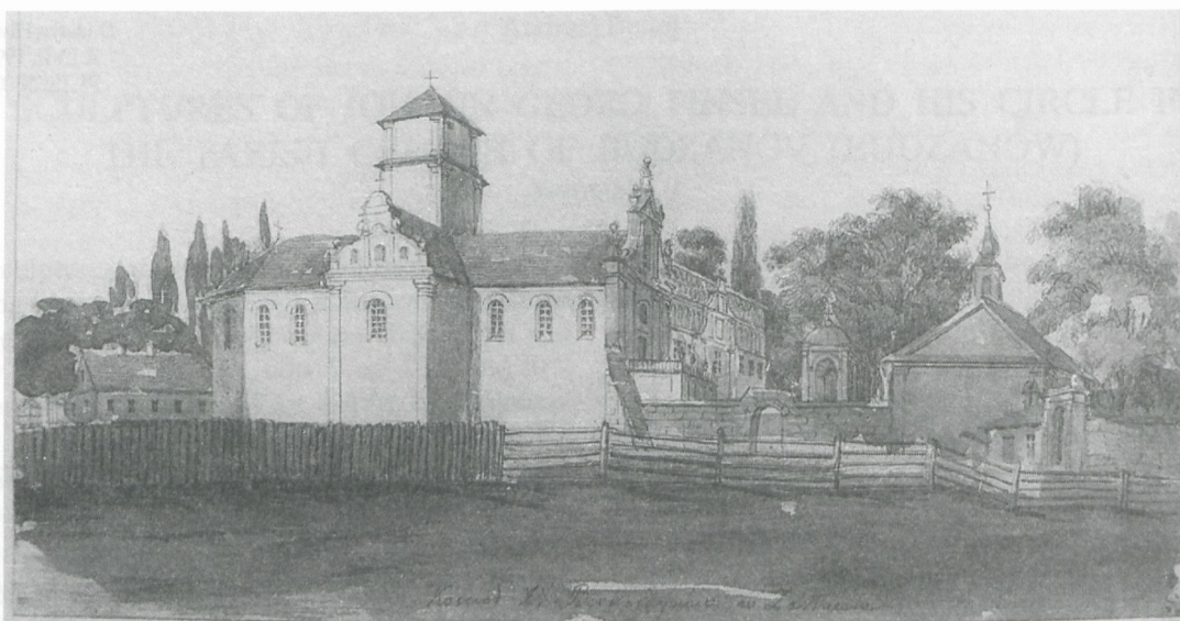
Il. 1. Zaslav, kościół bernardynów pw. św. Michała i klasztor, rys. N. Orda, 1872 r.