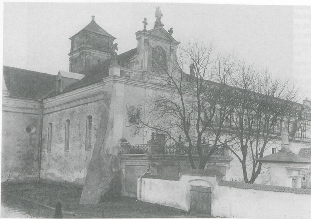
Il. 2. Zasław, fasada kościoła bernardynów. Ill. 2. Izaslav (Zasław), facade of the Bernadine Church.