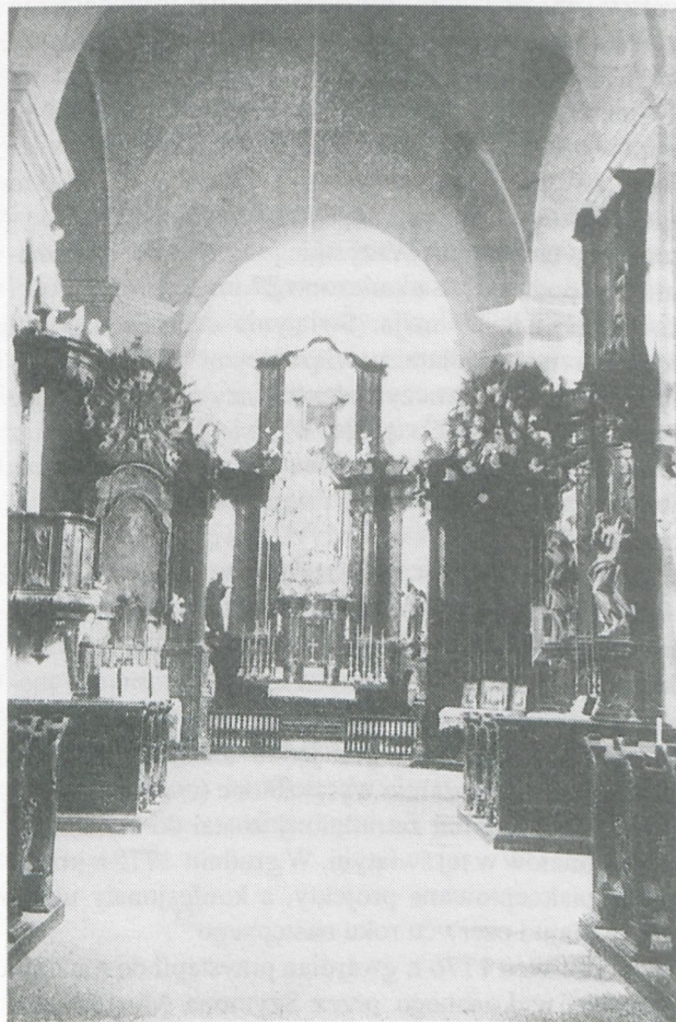
Il. 5. Zaslav, kościół bernardynów, wnętrze.