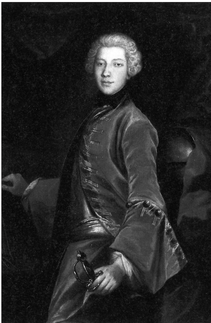
7. Pietro Longhi (?), portret Józefa Sapięhy