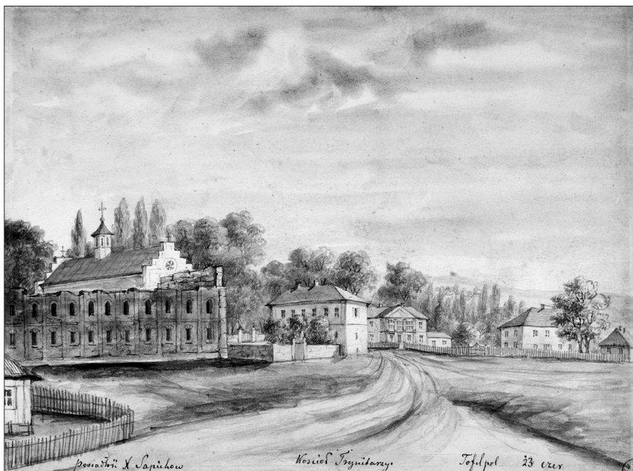
4. Napoleon Orda, pałac w Teofilpolu