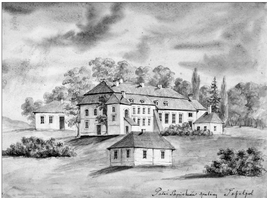
3. Napoleon Orda, kościół i pałac w Teofilpolu