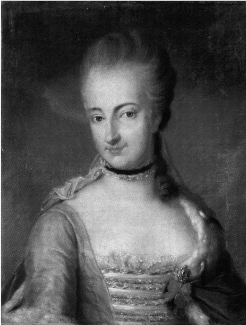
6. Portret Teofili Strzeżysławy z Jabłonowskich Sapieżyny