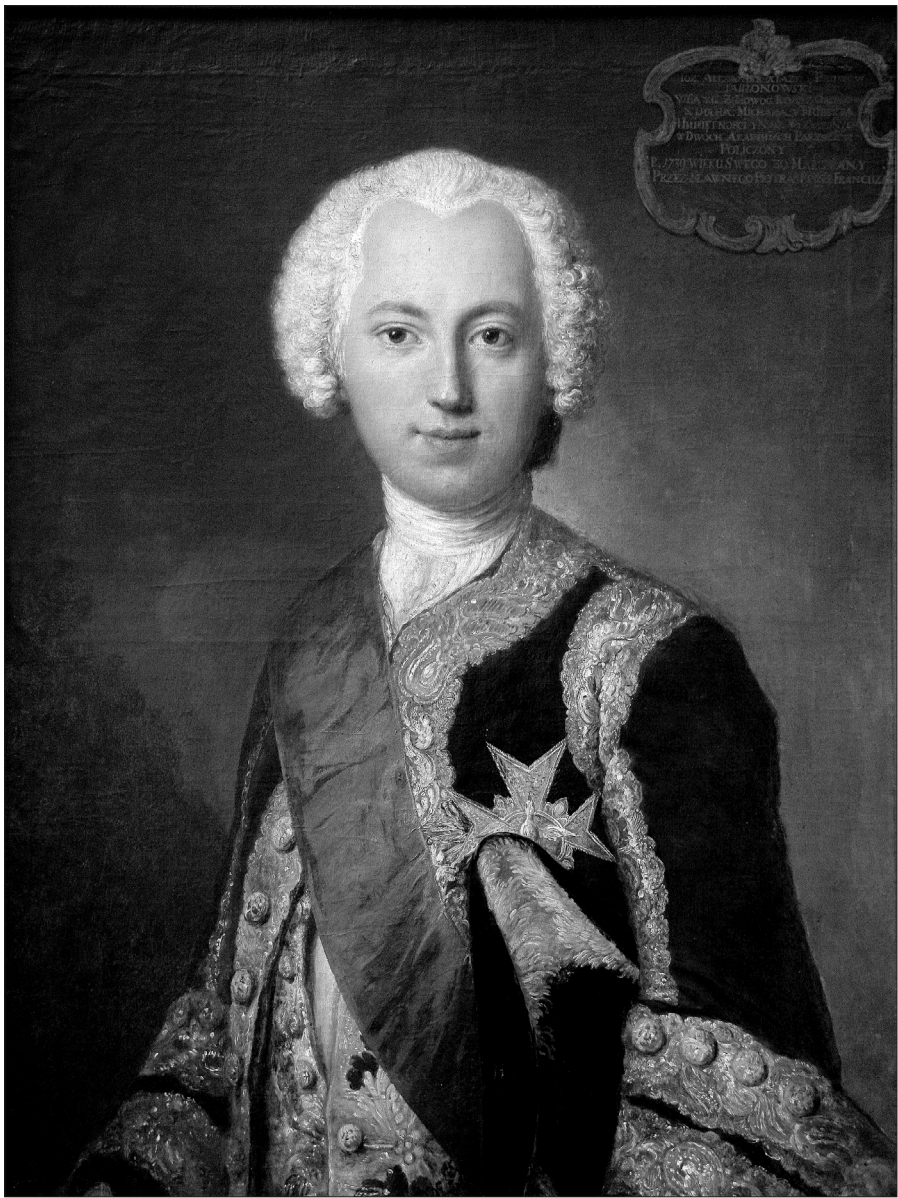
5. Portret Józefa Aleksandra Jabłonowskiego