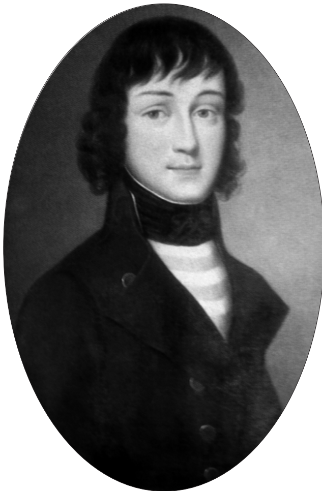
8. Portret Aleksandra Antoniego Sapięhy