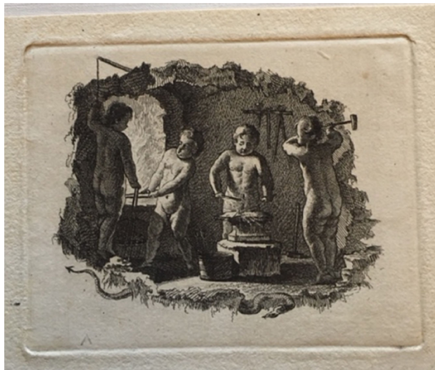
Abb. 9: G. F. Schmidt, Vier Genien in einer Schmiede, 1750 Höhe 88 mm, Breite 118 mm, Privatbesitz.