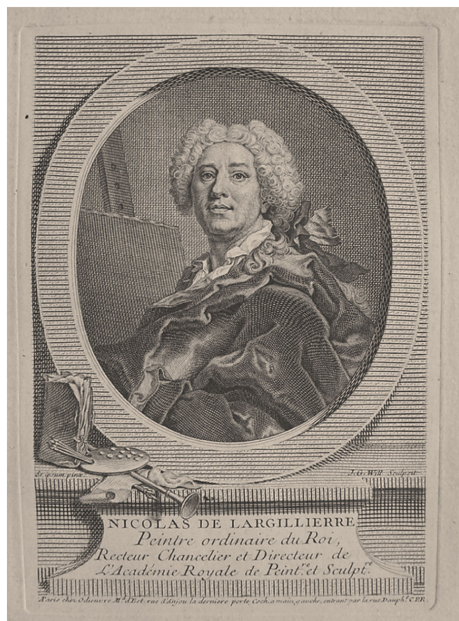
Abb. 6: J. G. Wille, Nicolas de Largillierre, 1737, Höhe 148 mm, Breite 110 mm, Privatbesitz.