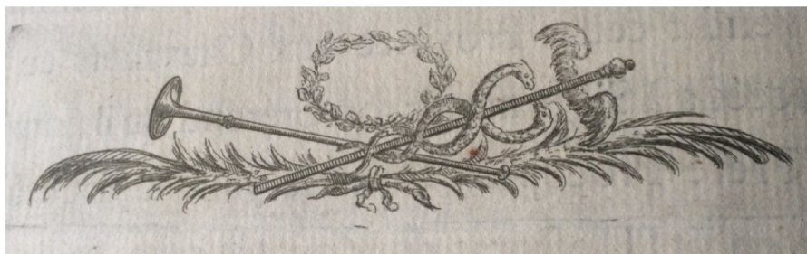
Abb. 8: G. F. Schmidt, Zwei Palmzweige, eine Trompete und der Mercurstab, 1750 Höhe 37 mm, Breite 104 mm, Privatbesitz.