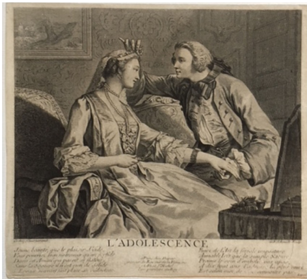
Abb.3: G.F. Schmidt nach Cochin d. J., L'Adolescence (Das Jugendalter), ca. 1737. Höhe 220 mm, Breite 315 mm, Privatbesitz.

signieren durfte. Dann wurde sein Name getilgt und die Stiche mit den Signaturen von Busch bzw. de Larmessin versehen, die diese Blätter sozusagen als Verleger veröffentlichten 3 . Die Abbildung 3 zeigt als Beispiel den Kupferstich » L'Adolescence » nach einer Zeichnung von Cochin d. J.. Das Blatt gehört zu den frühen Drucken, die mit » G.F. Schmidt Sculp. « signiert sind (Blatt nach Wessely 3 Nr. 183 I, nach Crayen 1 und Jacobi 2 Nr. 104 I). Spätere Drucke tragen den Namen von de Larmessin als Stecher. Dieses Blatt scheint sehr selten zu sein, denn es fehlt in den online zugänglichen großen Sammlungen.