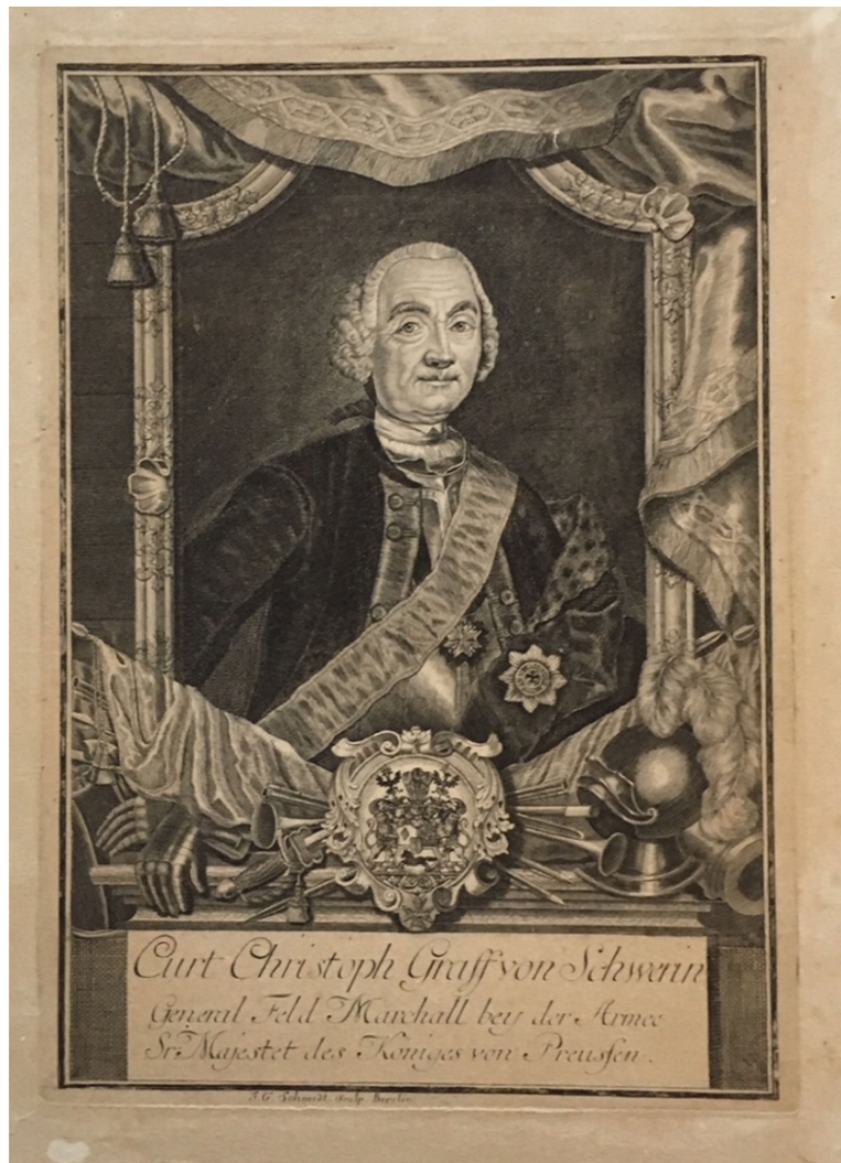
Abb. 5: J.G. Schmidt, Curt Christoph Graf von Schwerin (1740 – 1757).Privatbesitz