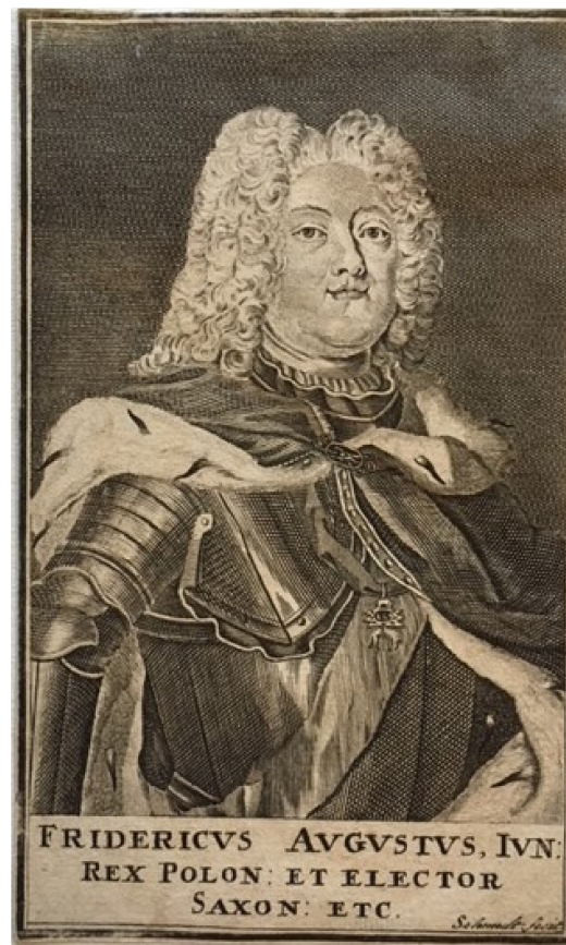
Abb. 2: Schmidt, Friedrich August III Junior Höhe 142 mm, Breite 85 mm, Privatbesitz