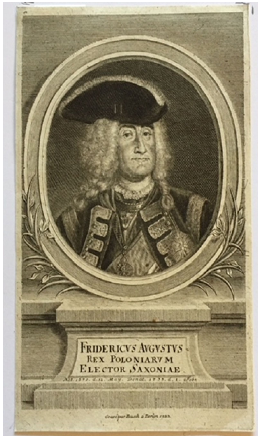
Abb. 1: G. P. Busch, Friedrich August II (1733) Höhe 155 mm, Breite 90 mm, Privatbesitz

Illustrationen zu den Buchveröffentlichungen des Königs, die zu den herausragenden Beispielen des friderizianischen Rokokos zu zählen sind. 1757 folgte er dem Ruf des Zaren und ging nach St. Petersburg, wo er russische Künstler ausbilden sollte. 1762 kehrte er nach Berlin zurück. Er starb mit 63 Jahren am 25. Januar 1775. Sein Lebensweg ist von Crayen 1 , Jacoby 2 , Wessely 3 und in Naglers Künstlerlexikon 4 ausführlich beschrieben.