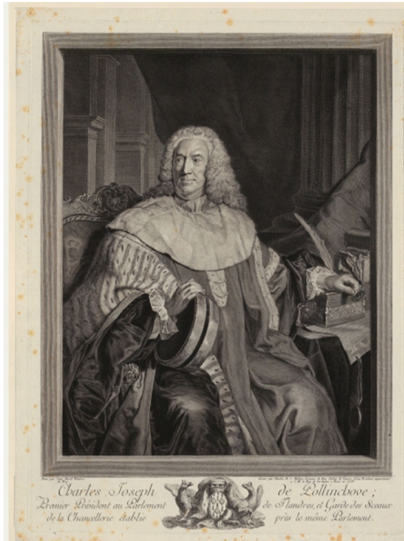
Abb. 4: C. D. J. Mellini: Charles Jos. van Pollinchove (1675 – 1756) Höhe 481 mm, Breite 357 mm, Bildnachweis: ETH-Bibliothek Zürich, Graphische Sammlung / D 9562 / Public Domain Mark 1.0.