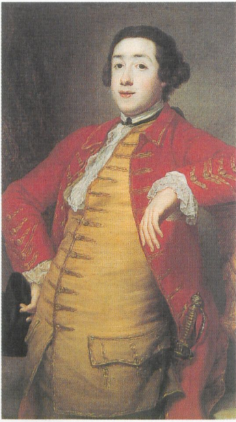
Abb. 1 Fürst Leopold III. Friedrich Franz von Anhalt-Dessau, Porträt von A. von Maron.

nachgeholfen. Gute Wege, Dämme, mit Obstbäumen besetzt, Gebäude welche in schönen Formen aufgeführt sind, fröhliche Landsleute – das alles trägt dazu bei, einen guten Begriff von der Regierung des Landes zu erwecken«.