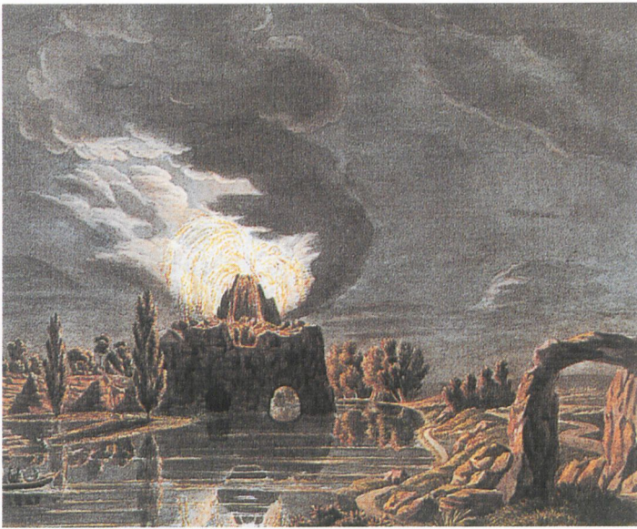
Abb. 10 Karl Kuntz: Der Stein , 1800, 51 x 67 cm, Aquatinta koloriert.

Auswahlbibliographie August von Rode , Beschreibung des Fürstlichen Anhalt-Dessauischen Landhauses und Englischen Gartens zu Wörlitz, neu hrsg. und bearbeitet von Ludwig Grote. Dessau 1928.