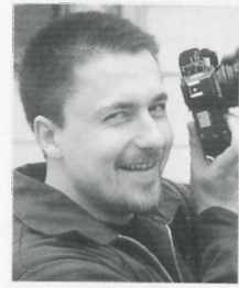
Zum Autor Kilian Heck

Unter der Regierung des Fürsten Leopold III. Friedrich Franz von Anhalt-Dessau entstand ab 1758 das »Dessau-Wörlitzer Gartenreich«. In dem kleinen Staat wurde die aus England übernommene Idee des Landschaftsgartens mit einem ambitionierten Reformprogramm verbunden, das u. a. die Wirtschafts-, Bildungs- und Sozialpolitik umfasste. Der Wörlitzer Park besteht aus zahlreichen kleinen Einzelbauten, Monumenten und Brücken im Verbund mit einer landschaftlichen Gestaltung, die durch Bäume und andere Pflanzungen, Seeflächen und eine komplexe Wegeführung gebildet ist.