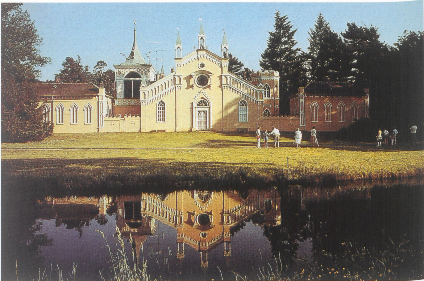
Abb. 6 Wörlitz, Gotisches Haus, Westfassade im venezianischen Stil, 1773–1774.

berry Hill von Horace Walpole gelten. Die dem Wolfskanal zugeneigte Seite des Gotischen Hauses zeigt hingegen eine ganz andere Stilart: Hier hat sich Erdmannsdorff für eine Nachbildung der venezianischen Kirche Madonna dell'Orto entschieden (Abb. 6). Diese Duplizität der Fassaden spiegelt sich auch in der Bepflanzung der Umgebung wider: Für den gotischen Gartenflügel wurden hochstämmige Nadelgehölze gewählt, die die Umgebung vor dem Hause abdunkeln und dadurch den Charakter des mittelalterlich-mystizistischen Ortes bestärken sollten. Die Westseite mit der venezianischen Fassade öffnet sich hingegen zu einer weiträumigen und als hell empfundenen Parklandschaft.