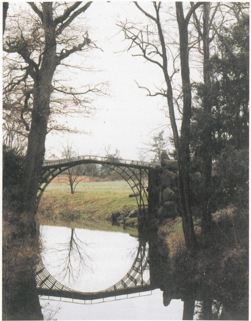
Abb. 9 Wörlitz, Neue Anlagen, Eiserne Brücke, 1791.

Eine solche Vedute aus dem Gartenreich zeigt den »Stein«, einen künstlichen Vulkan in den Neuen Anlagen im Ostteil des Parkes (Abb. 10). Es