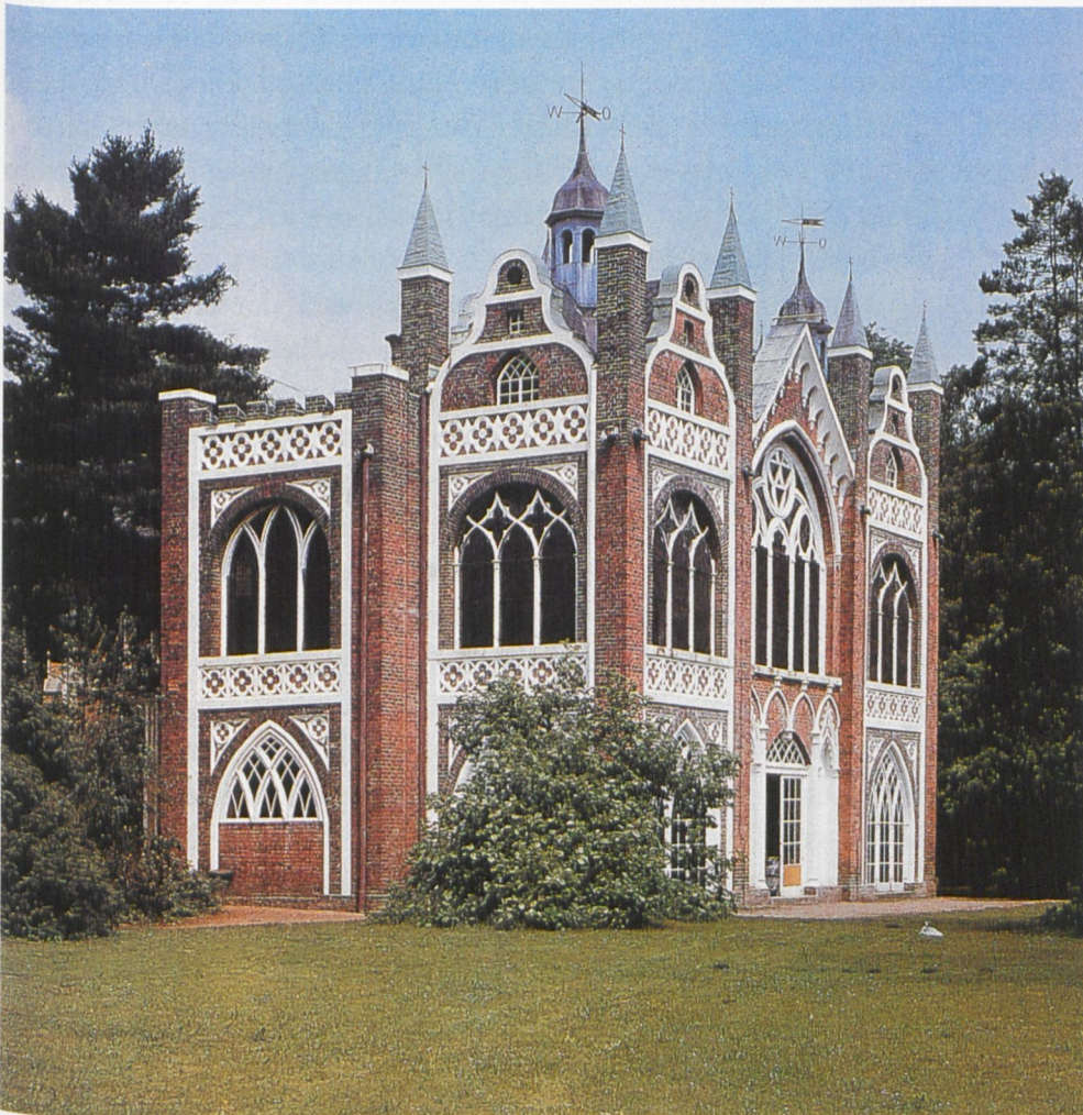
Abb. 5 Wörlitz, Gotisches Haus, neugotischer Gartenflügel, 1785–1790.

Das Gotische Haus wurde 1773–74 (Westseite) sowie 1785–90 (neugotischer Gartenflügel) gebaut. Es gilt mit seinem nach Osten ausgerichteten Gartenflügel neben dem Nauener Tor in Potsdam als das älteste neugotische Gebäude auf dem europäischen Kontinent (Abb. 5). Es wurde damit zu einem Ausgangspunkt für die weitere Verbreitung dieses Architekturstils in Deutschland. Als unmittelbares Vorbild kann der Landsitz Straw-