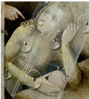
Abb. 6. Detail Mitteltafel, Frau in der Höhle mit Doppelstreifen über die Stirn

Im vorliegenden Falle gibt der Schlaf den Rahmen vor. Im späteren Mittelalter war auch in weit verbreiteten Schulenzyklopädien wie der Margarita philosophica des Gregor Reisch durchgesetzt, dass die Traumbilder durch physiologische Vorgänge im Körper entstehen. Der je verschieden (Geschlecht, Temperament, Alter, Tageseinflüsse, Verdauung) zusammengesetzte spiritus steigt im Rücken hoch. Er nimmt aus der weiter hinten im Kopf befindlichen Gedächtniskammer die gespeicherten Bilder mit und verarbeitet sie mit der Kraft der Imagination und weiterer (beurteilender) Kräfte im sensus communis . Es gibt andere Modelle, die den sensus communis zu diesem Zeitpunkt als nicht mehr beteiligt ansehen – generell gilt eine große Varianz und, dass beim Seelengeschehen gewissermaßen feinstoffliche Substanzen sich durchmischen. Feinste Regungen – zum Beispiel durch das Gebet, durch visuelle Ablenkung – können dazu führen, dass sich ‚ein Gedanke‘ verwandelt. Auch theologische Seelentraktate, beispielsweise das Trilogium animae des Kartäusers Ludovicus Prutenus, enthalten physiologische Beschreibungen und lokalisieren die Vorgänge differenziert im Gehirn.