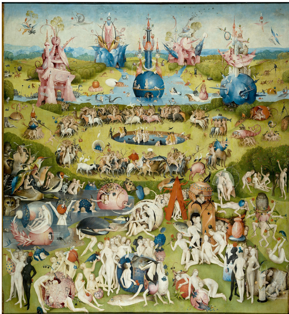
Abb. 4: Garten der Lüste, Mitteltafel. In der linken Hälfte das ‚Rad‘ der Fünf Sinne um den Muschelträger als Nabe. Die äußeren fünf Sinne somit als Szenen an den Fruchtschalen, von unten im Uhrzeigersinn: Geschmack, Tastsinn, Sehsinn, Geruchssinn, Gehörsinn. Rechts davon die 3er Gruppe Baum-Zelt/Portal-Anbau/Säulen- oder Baumstumpf für die inneren Sinne/Seelenkräfte

erörtert werden, zunächst sei der Gegensatz links und rechts des Portals betont: Das Baum-Zelt auf der linken Seite des Portals ist, wie andernorts diskutiert, recht genau doppelt so hoch als breit. 13 Es ist demzufolge pure Rationalität und es steht auf sicherer Basis. Auf der anderen Seite des Portals ängstigt eine auch symbolisch fragwürdige Stapelei sogleich einzustürzen.