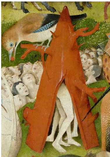
Abb. 7: Detail Korallen?-Baum-Zelt: (abstraktes) Dreieck und (konkrete) Naturform

werde jeweils nicht von einem äußeren Sinn geleistet, wird Thomas von Aquin in seinem Kommentar bekräftigen, sondern von einem übergreifend beurteilenden inneren Sinn. Der könne die wahrzunehmenden Dinge mit bereits vorhandenen Repräsentationen beurteilen . Thomas von Aquin schließt an Aristoteles' Beispiel an: Man könne eine Dreiecksform in der Natur schnell mit dem im Geist vorhandenen abstrakten Dreieck einschätzen. 46 Eine nicht mehr zerlegbare Form, ein eschaton , ein Letztes, was das Dreieck in diesem Sinne ist, dient dazu, das letzte Konkrete der Naturform zu erkennen. 47 Die repräsentierte abstrahierte Form dient zur schnellen Beurteilung der Naturform, dies geschieht durch eine beurteilende innere Kraft. Mit den Worten von David Summers „just as in doing mathematics we must imagine some particular triangle corresponding to a single triangle in nature“. 48