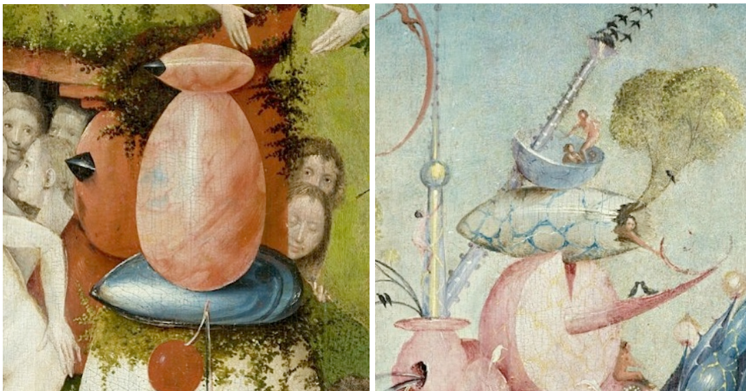
Abb. 1: Garten der Lüste, Madrid, Prado, Mitteltafel, Detail Vordergrund: labiles phantasma – Abb. 2: Mitteltafel, Detail Hintergrund: labiles phantasma

Da zum Gedächtnis, egal, wie die Seelenkräfte konzipiert sind, die Imagination notwendig dazugehört (teilweise übergeordnet), muss die genannte Anomalie rechts im Anbau des Portals und im weißlich-hellen Baum- oder Säulenstumpf davor zwangsläufig auffallen. Sie ist gewiss kein sinnfreies Capriccio: Nur an dieser einen Stelle im Vordergrund taucht bereits der bauliche Wildwuchs der verwandelten Paradiestore des Hintergrundes auf. Das ‚Echo‘ oder der ‚Vorschein‘ der Tore setzt sich wie folgt zusammen: Schon der weißliche, ins bläuliche wechselnde Säulenstumpf ist zweifelhaft, denn im unteren Bereich hat er eine Oberfläche wie gebrochene Eierschalen – er ist unten brüchig und animalisch.