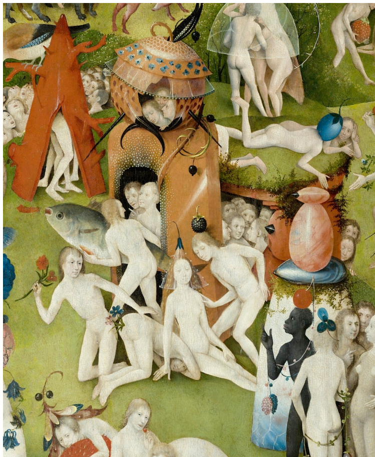
Abb. 3: Garten der Lüste, Mitteltafel. Baum-Zelt, Portal/Anbau, Säulen-Stumpf als Architektur der inneren Sinne/Seelenkräfte

Schon wie die größere Eiform im Vordergrund auf der mit Reflexlicht als gerundet charakterisierten Muschelschale aufsitzt, ist zweifelhaft; oben wird der labile Vorgang rund auf spitz variiert. Die obere Form hat links einen Diamantschnitt-Dorn, wie einen Schnabel. Dieser Dorn findet sich gleich dahinter noch einmal, nun an der bauchigen Form direkt am Ausgang im Anbau des Portals. Ähnlich bekrönen Dornen die Pfeiler des linken Tores im Hintergrund. Die skizzierten ‚baulichen Kuriosa‘, noch einmal festgehalten, gibt es nur rechts des Portals, was den Vordergrund angeht, und im Hintergrund.