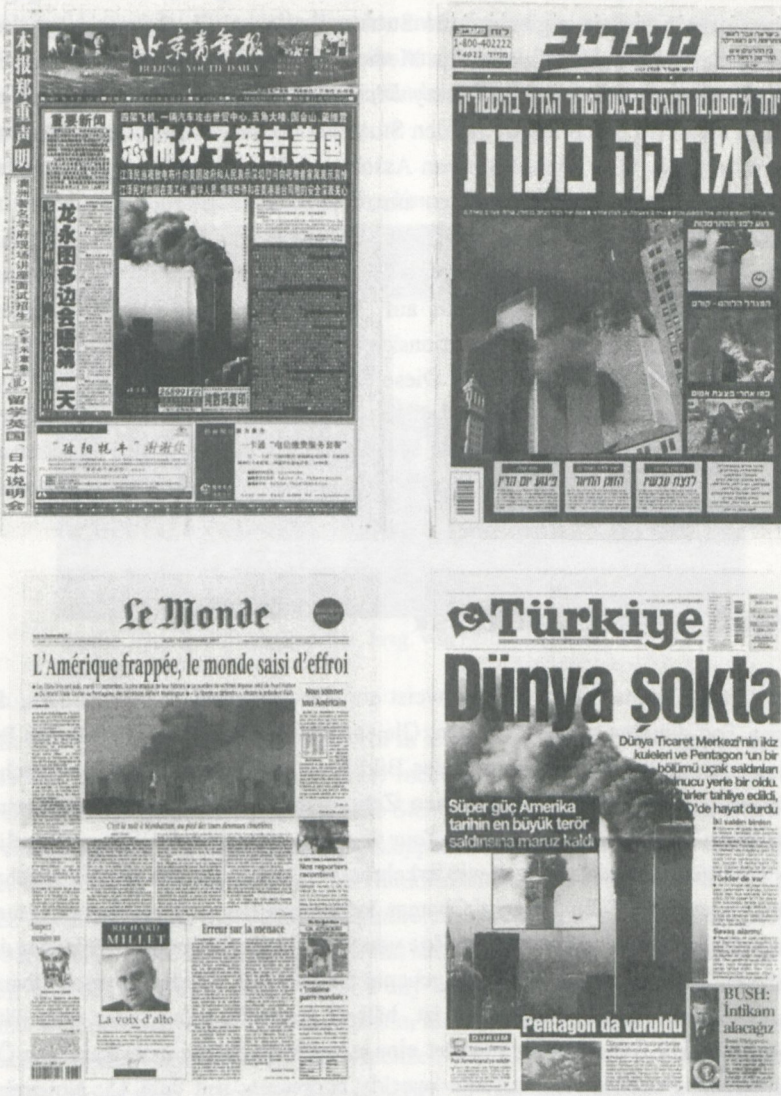
Abbildung 3: Hans-Peter Feldmann: 9/12 Front Page, 2002 [12.09.2001 Titelseite], 151