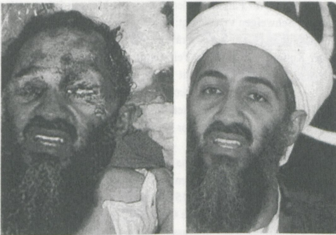
Abbildung 2: Unbekannt: Gefälschtes Leichenbild Osama bin Ladens, 2. Mai 2011

So löste etwa die Präsentation des Leichnams Che Guevaras, den die bolivianische Armee mithilfe des amerikanischen Nachrichtendienstes CIA 1967 hingehichtet hatte, nicht Bewunderung für die Souveränitätsgeste der Akteure aus, sondern evozierte Mitleid für den erschlagenen Revolutionär. Auch die propagandistisch eingesetzten Fotografien der getöteten Söhne Saddam Husseins, Uday und Qusai, die im Leichenschauhaus des US-Militärs am Flughafen von Bagdad am 25. Juli 2003 aufgenommen wurden sowie die Bilder der öffentlichen Hinrichtung Saddam Husseins schürten, neben der abschreckenden Wirkung, Sympathiebekundungen ihrer Anhänger. Um im Falle Bin Ladens Märtyrerverehrung zu verhindern, entscheidet sich die amerikanische Regierung dazu, überhaupt keine Bilder der Leiche zu veröffentlichen. In diese Leerstelle setzt sich sein intaktes Porträt und der Medienmechanismus der Zeitungen kommt in Gang: Er produziert eine endlose Zahl immer gleicher Bilder, welche von Obamas Pressestelle in den medialen Kreislauf eingespeist werden. Das Porträt wiederum wird Teil des Begehrens nach Beweisbildern für seinen Tod.