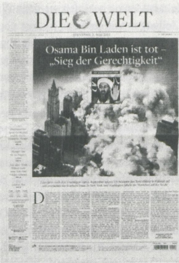
Abbildung 1: Willem Popelier, Osama Papers, Titelseiten 3. Mai 2011