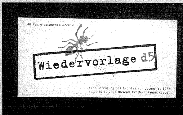
Abb. 3 Publikationen zur Ausstellung

Der im Cantz-Verlag erschienene Katalog vermittelt die Ausstellung und die gewonnenen Arbeitsergebnisse im Detail 3 .