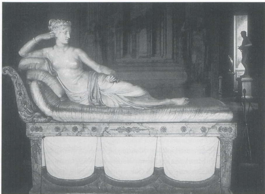
2 Antonio Canova, Paolina Borghese als Venus Victrix, Marmor und Holz, 1804–08, Galleria Borghese, Rom