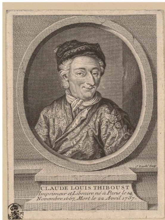
Abbildung 5: C. L. Thiboust, Kupferstich mit Signatur J. Daullé Sculp.

Im Oeuvrekatalog von E. Dilignières 24 ist dieser Stich unter Nr. 83 aufgeführt. Dieser bemerkt dazu, dass Daullé zweifellos daran gearbeitet und den letzten Schliff gegeben habe, wie bei vielen anderen Stichen auch. J. G. Wille schreibt in seinen Memoiren (s. Le Blanc 14 ), das er ebenfalls für Daullé Stiche angefertigt habe, die dieser unter seinem eigenen Namen herausgegeben habe. Kupferstich, 1737, Höhe 149 mm, Breite 108 mm.