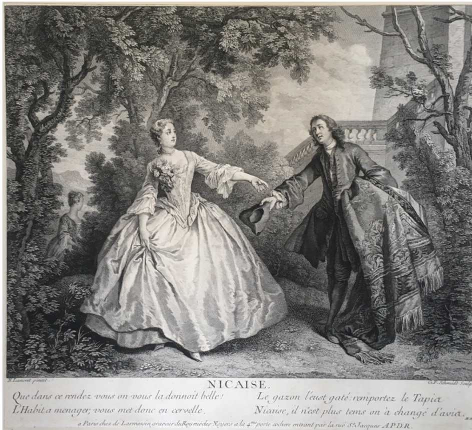
Nicaise, Lancret pinx. - G. F. Schmidt Sculp. (W 99 I)

avare galant escroc" vor der Schrift vorhanden, welches am Unterrand von alter Hand mit "Lancret pinx. - G. F. Schmidt Sculp." beschriftet ist. Kupferstiche, o. Jahr (1737), Höhe 330 mm, Breite 375 mm.