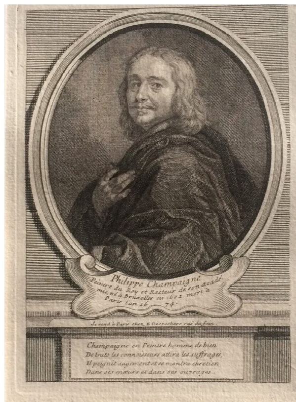
Abbildung 2: Porträt des Malers Philippe de Champaigne, Kupferstich von E. J. Desrochers

Wessely 7 beschreibt das von Etienne Jehandier Desrochers (1668 – 1741) gestochene Porträt von Philippe de Champaigne (siehe die Abbildung), und nicht den Stich von Schmidt.