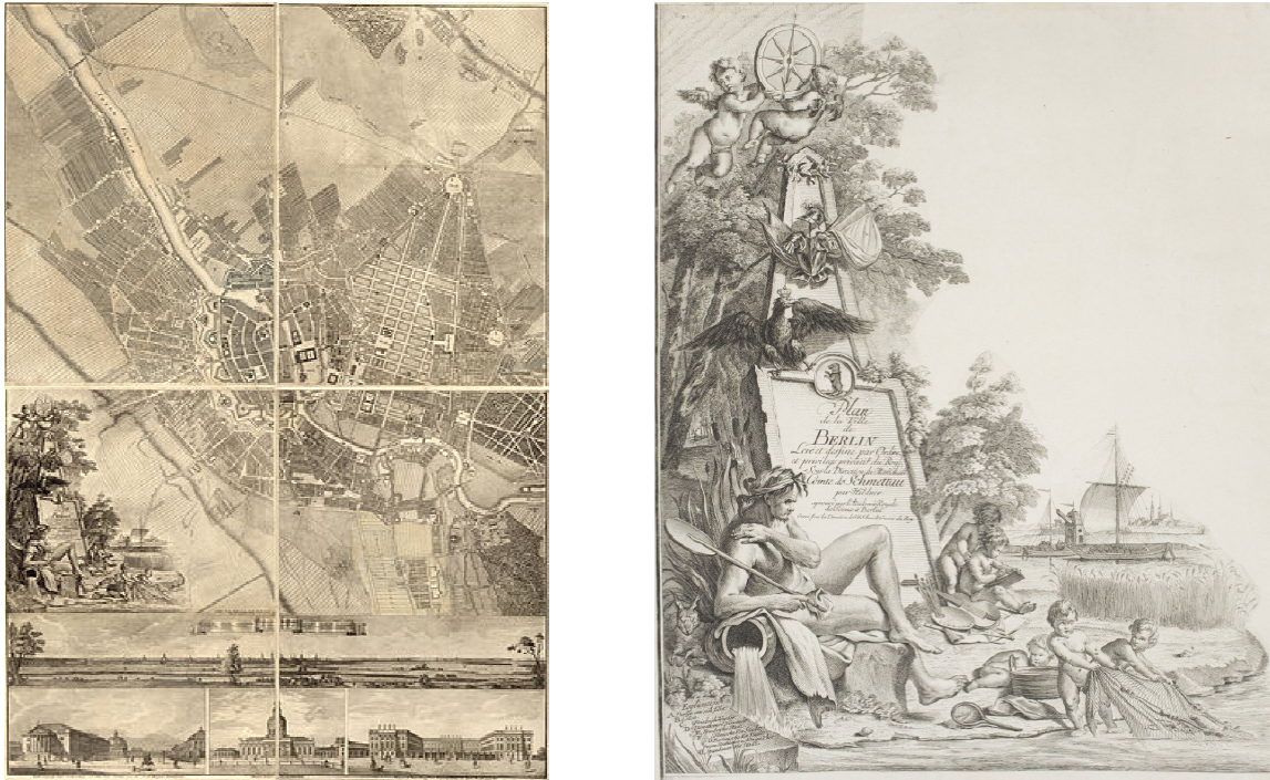
Abbildung 4: Plan de la Ville de Berlin. (Quelle: Wikimedia Commons).

Radierung, o. Jahr (1748), Höhe 486 mm, Breite 445 mm.