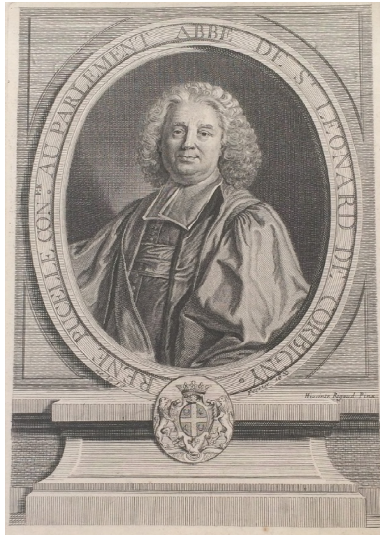
Abbildung 13: Rene Pucelle, Kupferstich nach einem Gemälde von Hyacinthe Rigaud

Kupferstich, I vor, II mit der Inschrift " G. F. Schmidt sc.- Hiacinte Rigaud Pinx ", o. Jahr, Höhe 232 mm, Breite 157 mm.