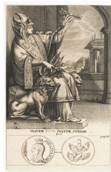
Abbildung 10: Titelblatt des Buches