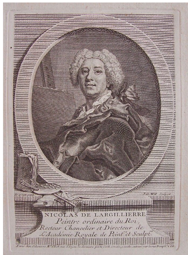
Abbildung 3: Porträt des Malers Nicolas de Largillierre, gestochen von Johann Georg Will(e)