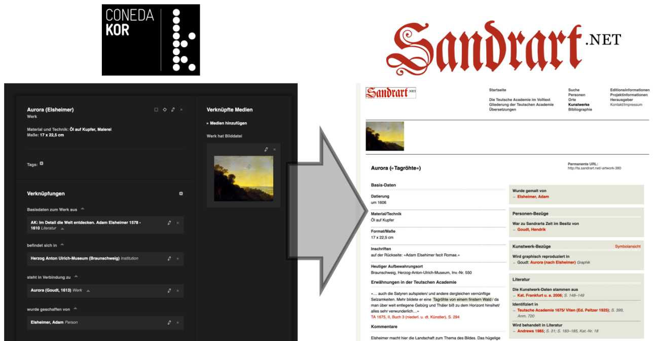
Abb. 2: ConedaKOR als Service für Basismetadaten in sandrart.net

Dass ein Datenbanksystem in der Kunstgeschichte nicht nur Bilddateien digitaler Reproduktionen, sondern vor allem Kontextinformationen ausliefern kann, war eine der grundlegenden Ideen für ConedaKOR. Zunächst war dies als lokaler Datendienst vorgesehen, der für digitale Forschungsprojekte die Basisdaten bereitstellen konnte, so etwa für die Edition Sandrart.net 16 . Hier fungierte ConedaKOR als Datengeber und stellte der Edition die Informationen über eine Schnittstelle bereit, die in der institutseigenen Bildstelle in gewohnten und eingespielten Arbeitsprozessen erstellt wurden. Die Bereitstellung und die Begrenzung als lokaler Service waren jeweils wichtig, um Kontrolle und Autorität zu gewährleisten.