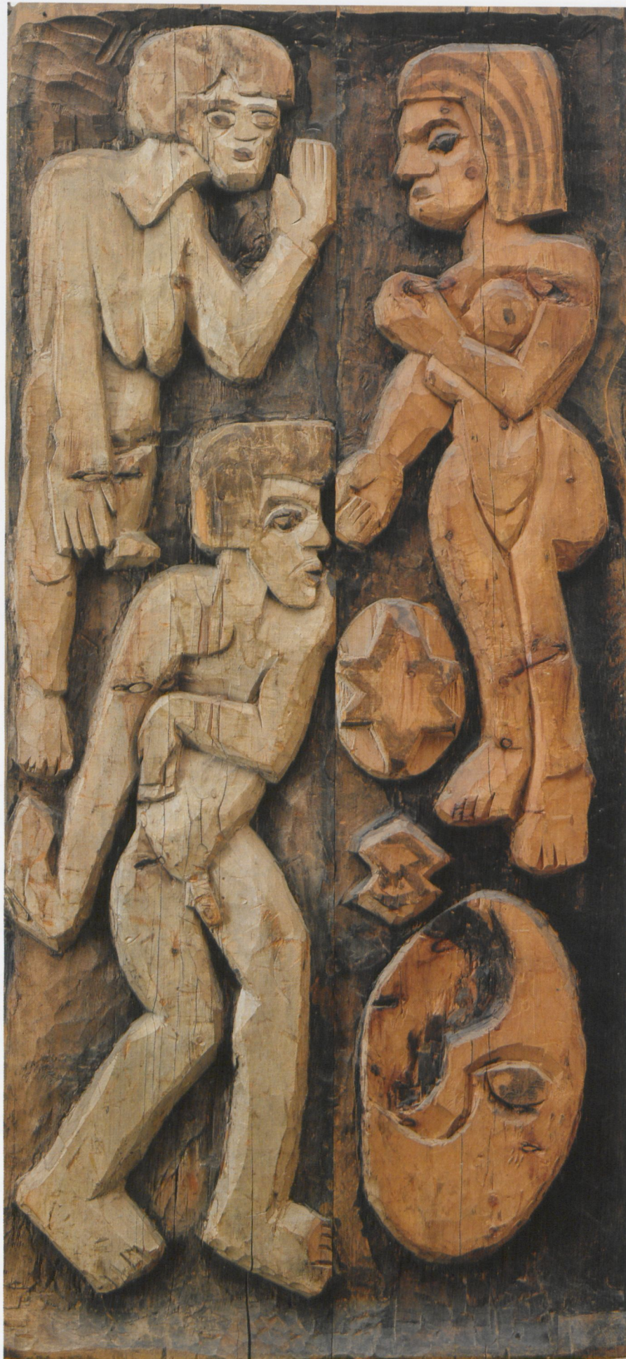
10 Ernst Ludwig Kirchner, Der Tanz zwischen den Frauen, 1919, Holzrelief