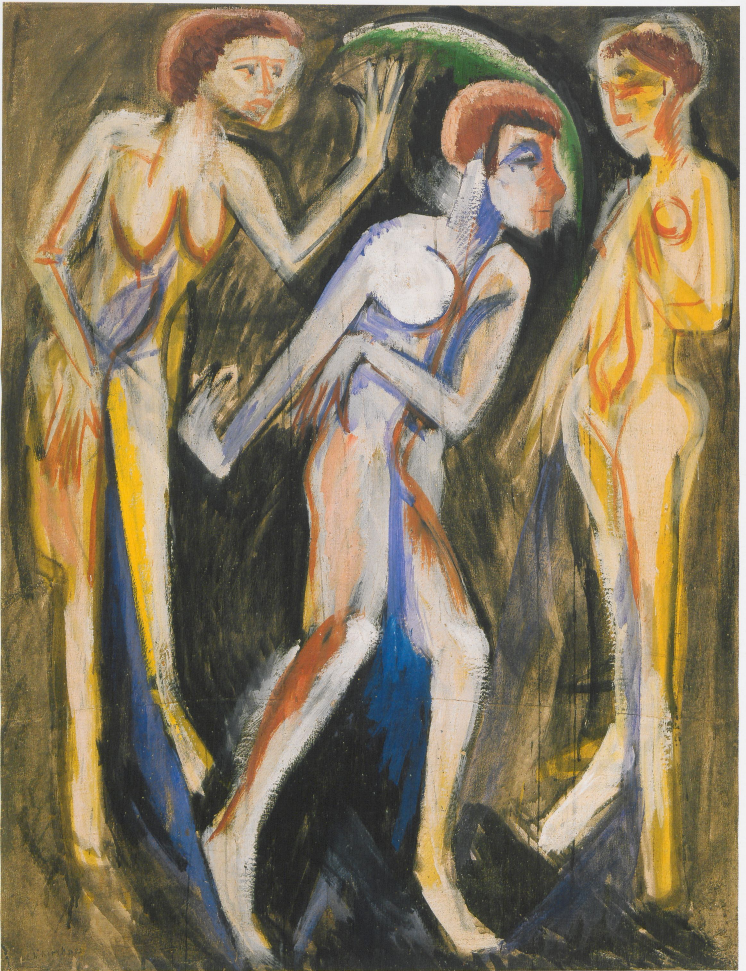
6 Ernst Ludwig Kirchner, Der Tanz zwischen den Frauen, 1915, Öl auf Leinwand