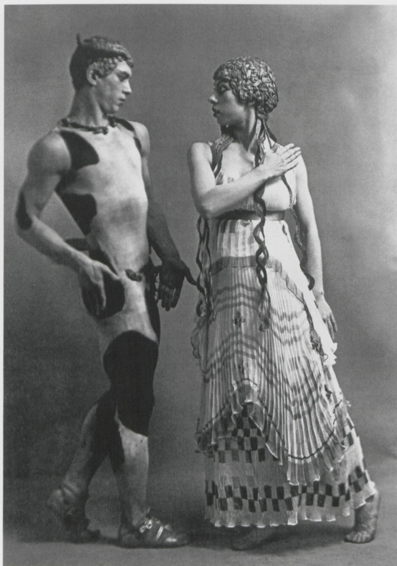
2 Studio Waléry, Vaslav Nijinsky und Bronislawa Nijinskaja, 1912.

Es ist möglich, dass hier auf ein Ballett angespielt wurde, dass vor dem Weltkrieg Furore in ganz Europa gemacht hatte, L'après midi d'un faune von den Ballets Russes auf eine Musik von Claude Debussy. 2 Im Dezember 1912 war es in Berlin zu sehen gewesen, im Januar 1913 in Dresden. 3 Das Besondere daran war die unverhohlenen sexuelle Thematik und die Art der tänzerischen Bewegungen. Der in einem hautengen Trikot auftretende Vaslav Nijinsky und seine in lange Gewänder gekleideten Tanzpartnerinnen ahmten die bildflächenparallelen Haltungen nach, die Figuren auf griechischen Vasenmalereien