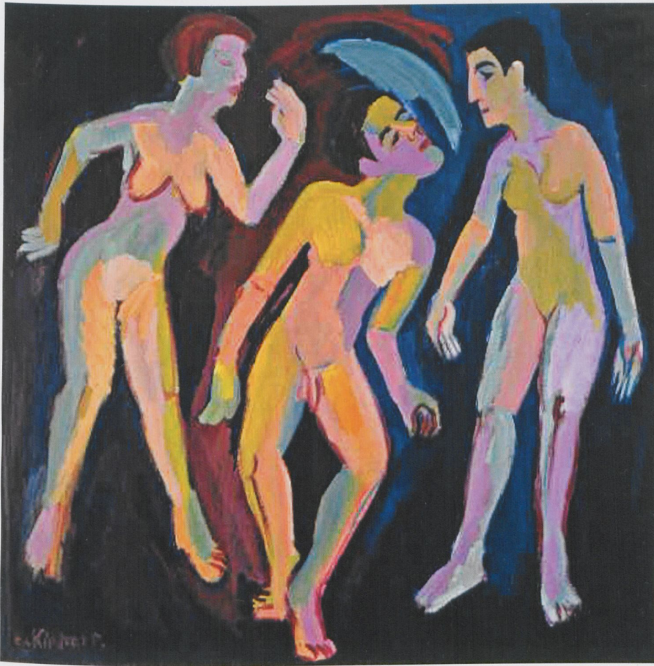
11 Ernst Ludwig Kirchner, Der Tanz zwischen den Frauen, 1919/1926, Öl auf Leinwand