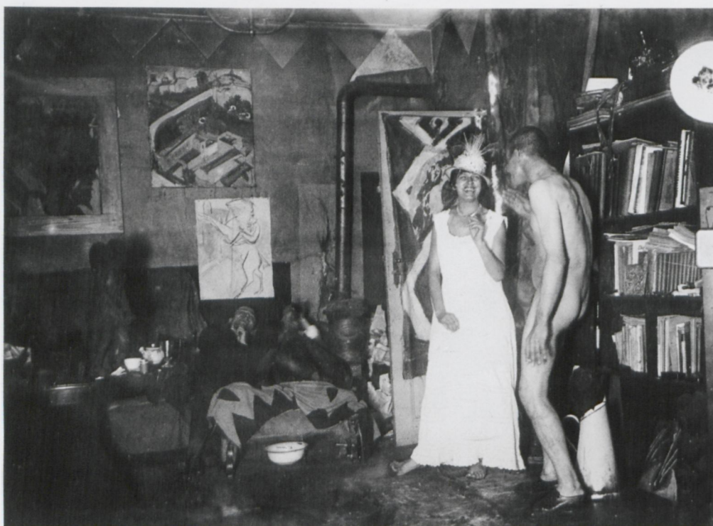
1 Ernst Ludwig Kirchner, Vier Personen in Kirchners Atelier Körnerstr. 45, Berlin-Friedenau

Die ersten Werke zum Thema entstanden 1915. Ihnen vorausgegangen war ein ausgelassener Abend mit drei Männern und zwei Frauen in Kirchners Berliner Atelierwohnung, Körnerstraße 45, auf dem zwei Fotografien entstanden sind (Abb. S. 35/36 und Abb. 1). Den Mittelpunkt beider Aufnahmen bildet der nackte