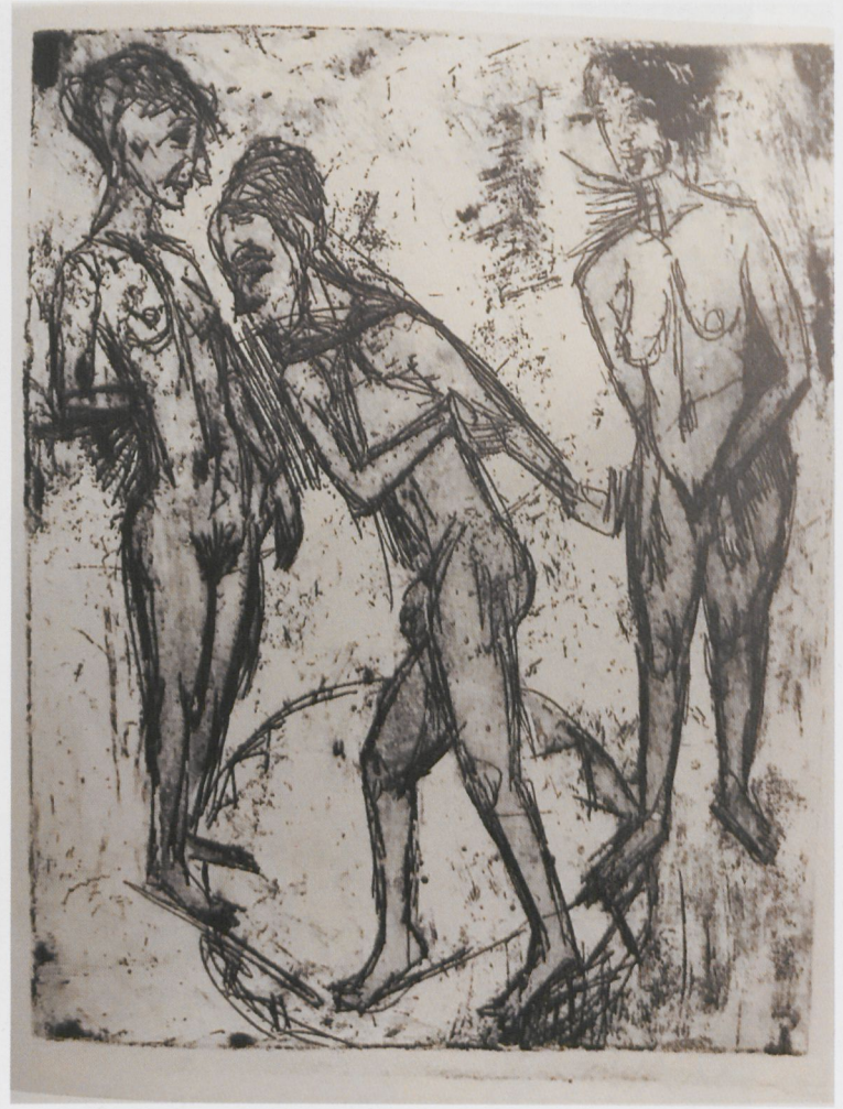
5 Ernst Ludwig Kirchner, Der Tanz zwischen den Frauen, 1915, Radierung

bei sich. Trotz der flüchtigen Gestaltung erscheint seine Gestalt plastischer als diejenigen der Frauen. Zugleich bewegt er sich in beschriebener Weise flächenbezogen, während sie sich in den Raum wenden. Die Figuren sind also unverkennbar auf unterschiedlichen Ebenen angesiedelt. Farblich fällt auf, dass sein Körper mit Orangerot und Blau modelliert ist, für die weiblichen Körper aber Orangerot und Gelb verwendet wurden. Nur zwischen den Beinen der Frauen steigt bis zur Scham ebenfalls Blau auf, als wollte der Künstler andeuten, dass sie durch die männliche Farbe erregt werden – während sie ihn mit ihren körperlichen Reizen nicht erreichen. Hintergrund und Boden sind weitgehend schwarz und damit unbestimmt. Oben erscheint ein grün-weißer Mond-Bogen, der das Profil des Tänzerkopfes einschließt. Damit wird das Geschehen auf eine kosmische Ebene verlagert, als betrachteten wir eine dem Irdischen entrückte Allegorie, ein überzeitliches Sinnbild.