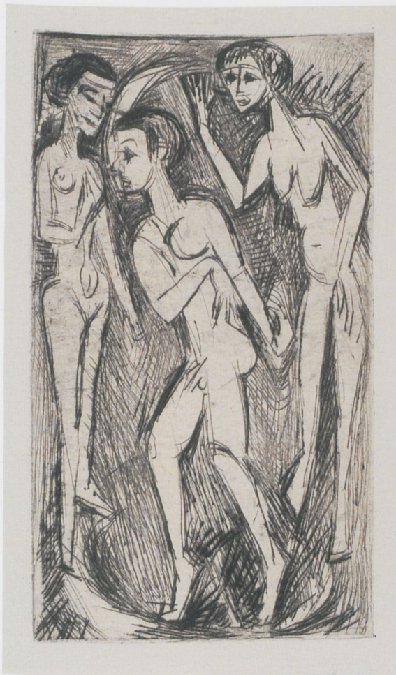
8 Ernst Ludwig Kirchner, Der Tanz zwischen den Frauen, 1919, Radierung