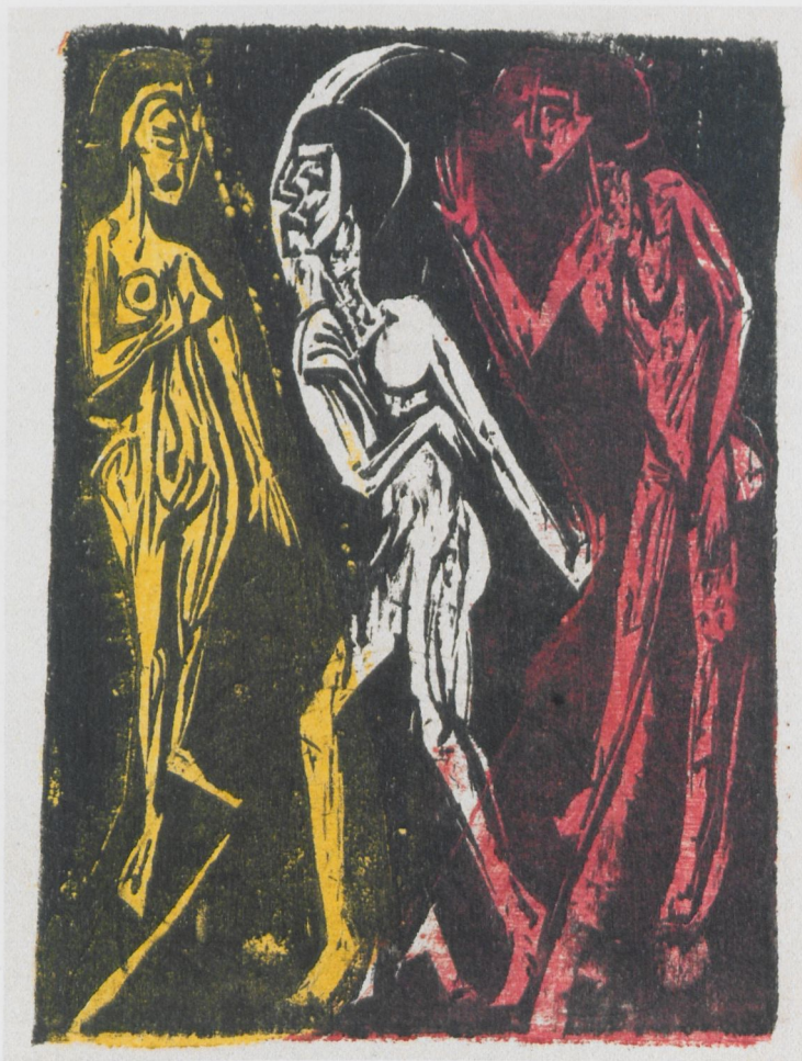
9 Ernst Ludwig Kirchner, Der Tanz zwischen den Frauen, 1919, Farbholzschnitt

fest, experimentiert aber mit einer neuen Farbgebung (Abb. 9). Die Frauen erscheinen nun differenziert in Gelb und Rot (in einer anderen Fassung Orange), während der Körper des Mannes im Weiß des Papiergrundes erscheint und damit auch farblich dem Mond zugeordnet wird. 20