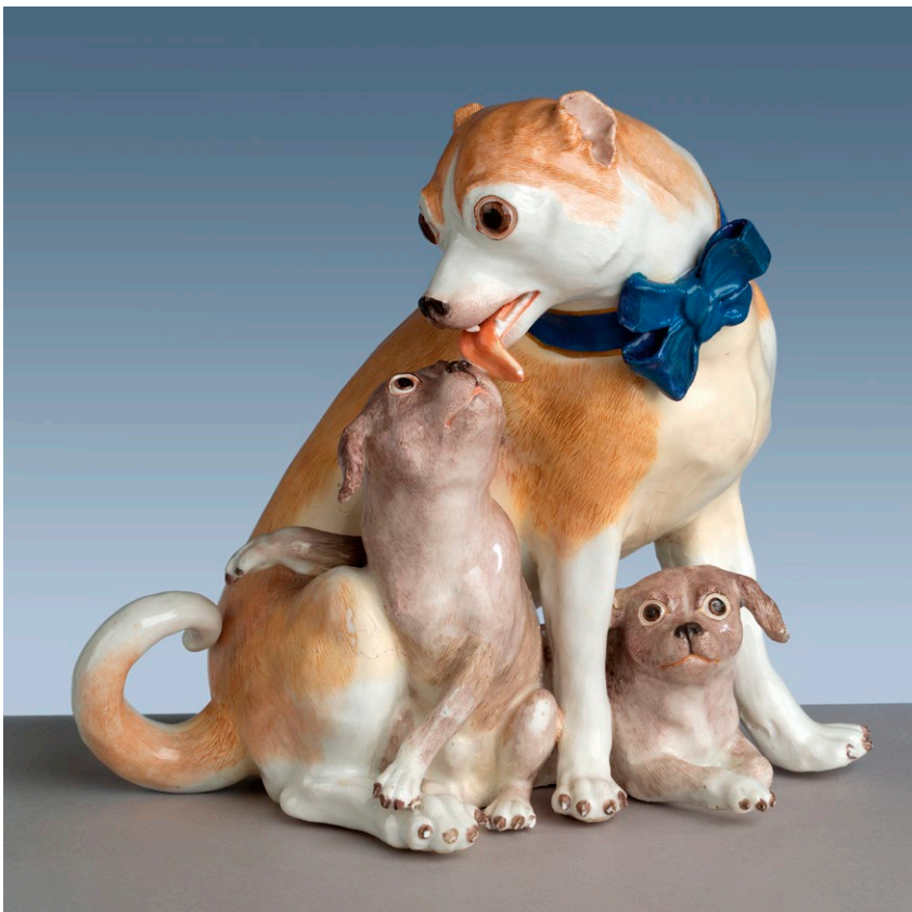
2 – Hündin mit zwei Jungen Modell: Johann Joachim Kaendler, Meissen, um 1741 H. 20,2 cm