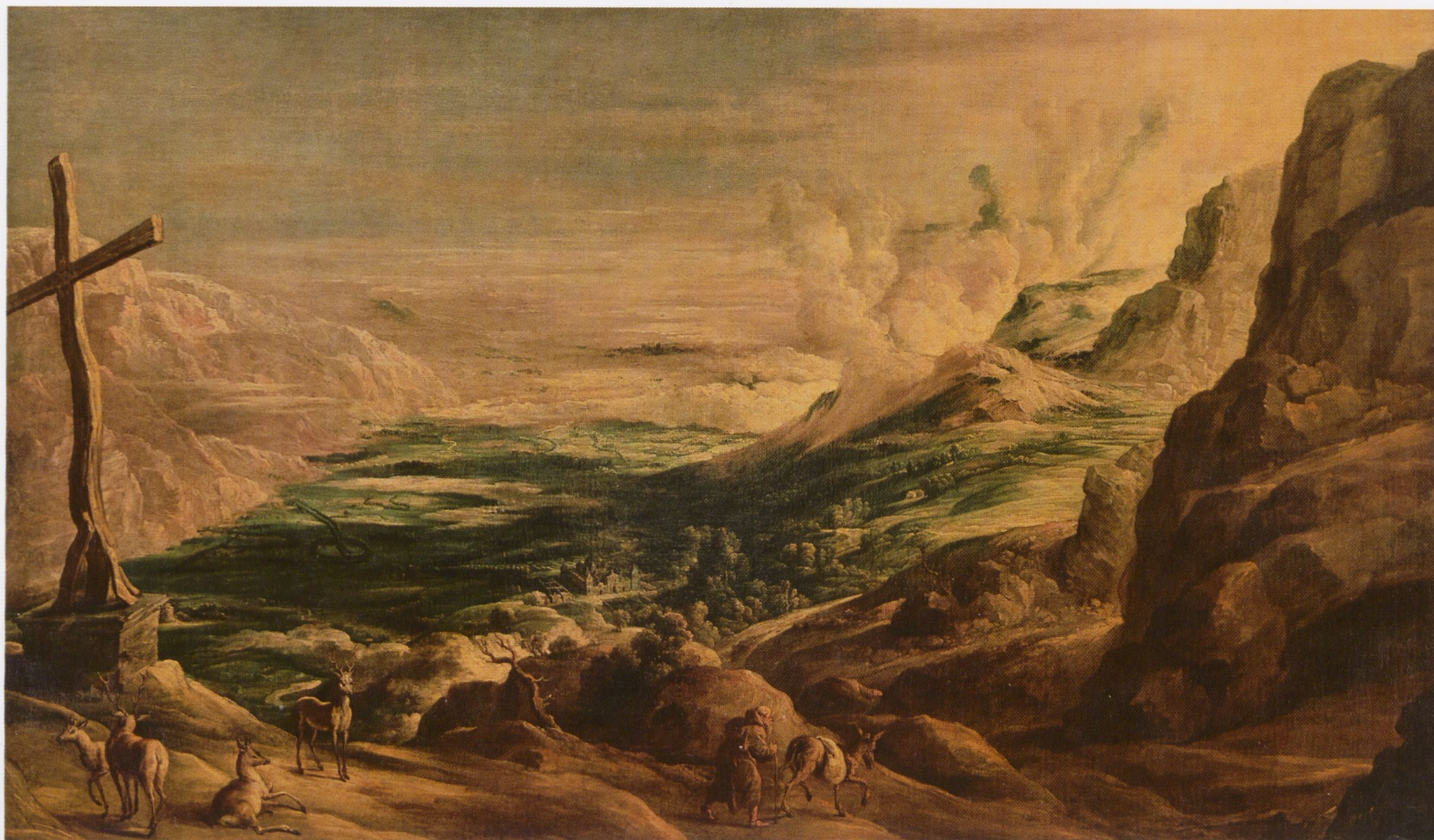
Abb. 4 Peeter Verhulst d. J. (?) nach Peter Paul Rubens Landschaft mit Ansicht des Escorial Öl auf Leinwand, 155 × 254 cm Longford Castle, the Earl of Radnor

immer wieder beschriebenen Gefahren, mit denen ihre Überquerung verbunden war, das Interesse an bildlichen Darstellungen gesteigert haben. Denn dem, der tatsächlich einmal nach Italien gereist war, konnten solche Bilder die Erinnerung lebendig halten. Und denen, die die Berge niemals mit eigenen Augen gesehen hatten, mochten sie als lebendige Anschauung dienen, da man »durch anschauen dieser Contafeytungen und lesen der hinzu gethanen verzeichnussen, eben dasselbige erfahren und erlernen kan, welches ander leut mit fernem und mühseligem reisen endlich kaum haben können erlangen.« 25 Diese Sätze schrieb der Verleger Georg Braun in der Einleitung des 1581 publizierten dritten Bandes seiner »Civitates orbis terrarum«, um die Funktion seiner Städtebilder zu illustrieren, die im modernen Verständnis alles andere als genaue Abbildungen der sichtbaren Welt sind. Es wird dem Realitätsgehalt frühneuzeitlicher Darstellungen der den Menschen umgebenden Natur nicht gerecht, sie am dokumentarischen Wert von Fotografien zu messen. Die Rekonstruktion des historischen Bezugsrahmens erweist, dass weniger die frühneuzeitlichen Bilder