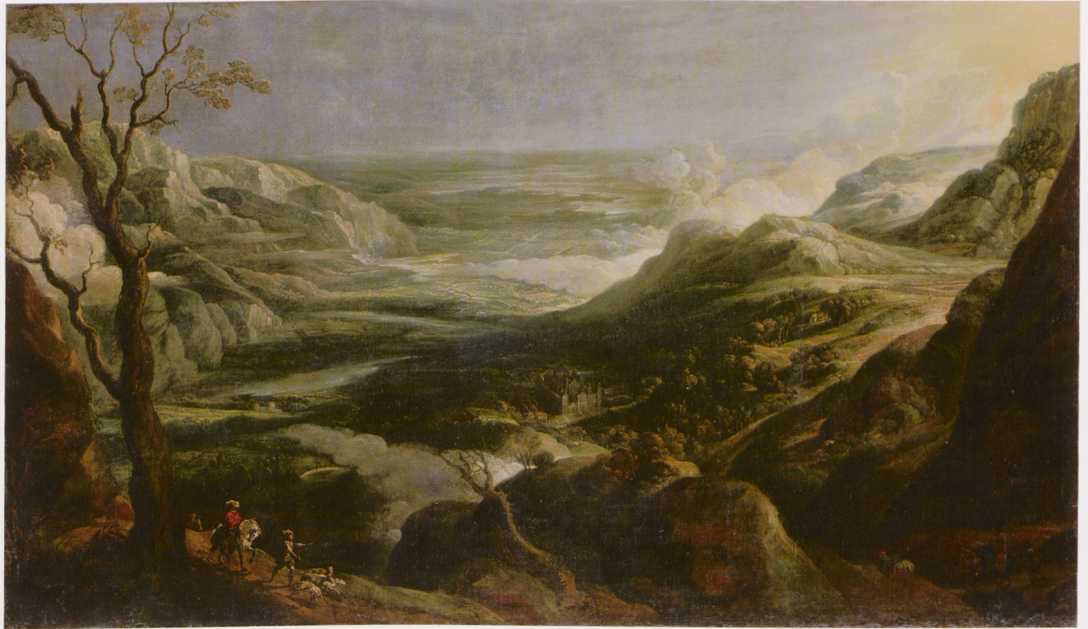
Abb. 5 Peter Paul Rubens, Nachfolger Landschaft mit Ansicht des Escorial Öl auf Leinwand, 114 × 194 cm Staatliche Kunstsammlungen Dresden, Gemäldegalerie Alte Meister, Gal.-Nr. 983

des Malers Peter Paul Rubens sprechend bezeugt wird. 28 Auf der Grundlage von dessen vor Ort entstandenen Skizzen hatte ein mediokrer Maler namens Verhulst eine gemalte Ansicht des Escorial geschaffen (Abb. 4). 29 Rubens verkaufte sie an den englischen König. Das ausführliche Begleitschreiben erläutert die Details des Bildes, das den Blick vom Pico de Abanto in San Juan de Malagón auf das im Tal gelegene Kloster San Lorenzo de El Escorial zeigt. Rubens beschreibt das monumentale Gipfelkreuz und die auf dem Berg gelegene Eremitage, die im Gemälde nicht sichtbar aber durch den im Vordergrund gezeigten Mönch gegenwärtig sei. Das Gipfelkreuz, der Mönch und das im Tal gelegene Kloster waren also tatsächlich eine Referenz auf das eigene Erleben. Sie ließen das Bild aber für jeden, der mit der Topografie oder dem persönlichen Erleben des Künstlers nicht vertraut war, zu einer Allegorie des menschlichen Lebensweges werden. Diese sinnbildliche Bedeutung war offensichtlich so beliebt, dass Rubens' Bild in zahlreichen Versionen überliefert ist, die den Reiz der topografischen Schilderung mit einer inhaltlichen Belehrung verbinden (Abb. 5). 30