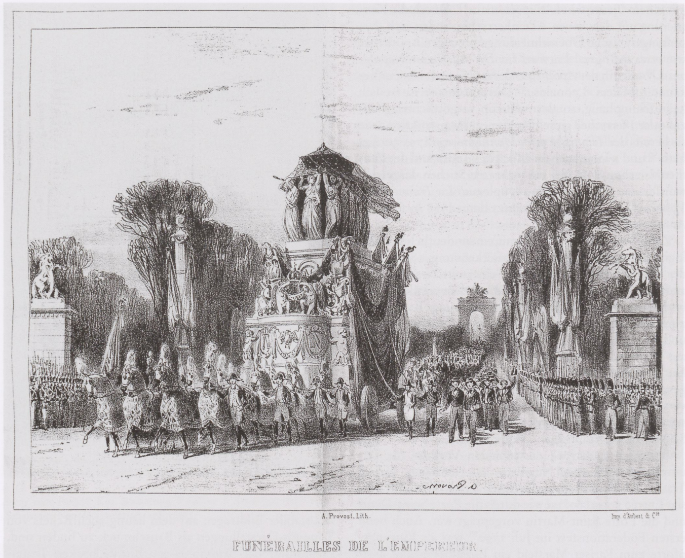
12. A. Provost: Funérailles de l'Empereur . Kreidelithographie, in: Le Charivari Nr. 364 vom 30. Dez. 1840

(1796 und 1807 in Mailand, 1797 in Faenza, 1806 in Straßburg und Berlin, wo das Brandenburger Tor zum französischen Triumphbogen umgenutzt wurde, 1807 in Venedig). Häufig durchritt der Usurpator hierbei eigens errichtete ephemere Ehrenbogen, um durch diese Anknüpfung an das römische Vorbild seine Eroberungszüge als siegreiche Bella iusta zu legitimieren. 106 Auch die Wiederbelebung eines weiteren Charakteristikums des antiken Triumphes, die Mitführung von Kriegsbeute im Zug, diente Napoleon zur Legitimation seiner Beutekunstzüge 107 in Italien. So wird der feierliche Einzug der »repatriierten« Kunstwerke in einem Stich der Tableaux historiques 108 , den Joseph Hutter für das Denkbuch der Franzoesischen Revolution kopierte (Abb. 10), als veritabler Triumphzug inszeniert. 109