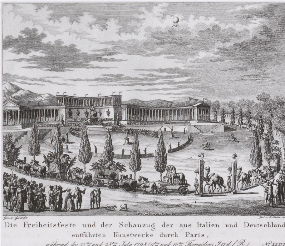
10. J. Hutter nach A. Girardet: Die Freiheitsfeste und der Schauzug der aus Italien und Deutschland entführten Kunstwerke durch Paris, während des 27 ten und 28 ten July 1798... Kupferstich u. Radierung, in: F. E. von Seida und Landensberg, Denkbuch der Franzoesischen Revolution , Bd. 2, Memmingen: C. Müller, 1819, Bl. XXXVI

Unter Napoléon Bonaparte erobert sich der triumphierende Herrscher den Platz, den bislang abstrakte Staatsallegorien eingenommen hatten, in der Druckgraphik zurück: Im Salon von 1801 hatte Pierre-Paul Prud'hon einen Triomphe de Bonaparte gezeigt 86 , und Jean-Baptiste Regnault malte im Palais du Luxembourg einen Saal