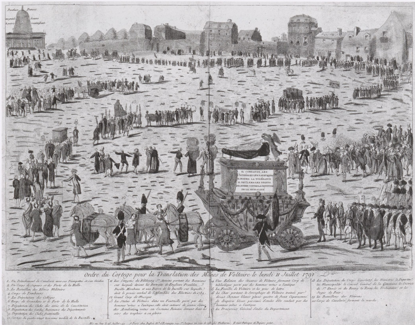
4. Anon.: Ordre du Cortège pour la Translation des Manes de Voltaire le lundi 11 Juillet 1791. Kol. Radierung, Paris: Basset, 1791 (DV 4171)

bildlicher Mittel des Triumphzugs wird mittels der invertierten Triumph-Ikonographie ein historisches Ereignis als moralisch verwerflich und damit schändlich, da sozialschädlich oder gar konterrevolutionär, dargestellt. Ziel dieser Schand-Ikonographie ist es, die im Schandzug Versammelten dem Spott genau derjenigen Öffentlichkeit preiszugeben, gegen deren gemeinwohlorientierte Interessen die Delinquenten verstoßen haben, und sie damit symbolisch wie real zu erniedrigen; hatte öffentlicher Spott in der Frühen Neuzeit doch durchaus handfeste soziale Auswirkungen wie den Ehrverlust. Es gilt hierbei zu unterscheiden zwischen der Darstellung eines real praktizierten Rechtsbrauchs, dessen Requisiten die Schandmaske und der Schandesel waren (vgl. die Verhöhnung der französischen Konsuln in Italien aus dem Jahr 1800 51 oder den Eselsritt eines ›Aristokraten‹ 1789 52 ), und der Nutzung der invertierten Triumph-Ikonographie in politisch-satirischer und karikierender Absicht.