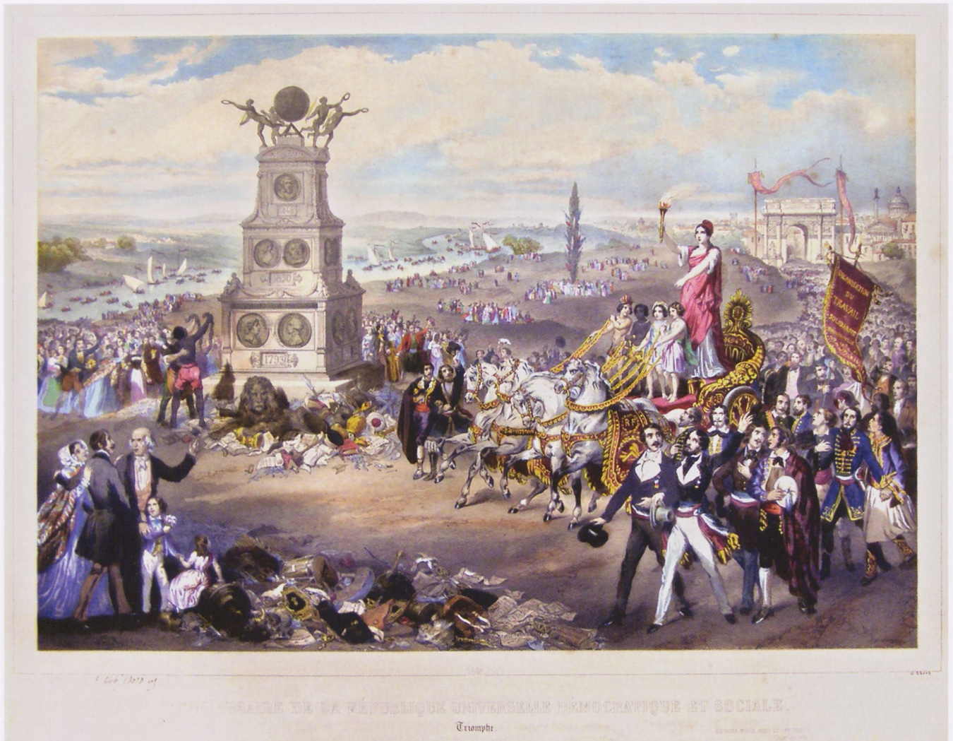
3. M.-C. Goldsmid: Anniversaire de la République universelle démocratique et sociale . Kol. Lithographie von F. Sorrieu, Druck Domnec, Paris, 20. Nov. 1849 (MC, G.33112)

tierte Triumphzug ist gleichzeitig ein Schandzug, wie sich anhand des triumphalen Einzugs des ebenfalls spontan organisierten Volkssturms durch eines der beiden Haupt-Triumphore des Ancien Régime, die Porte Saint-Denis, belegen lässt. 43