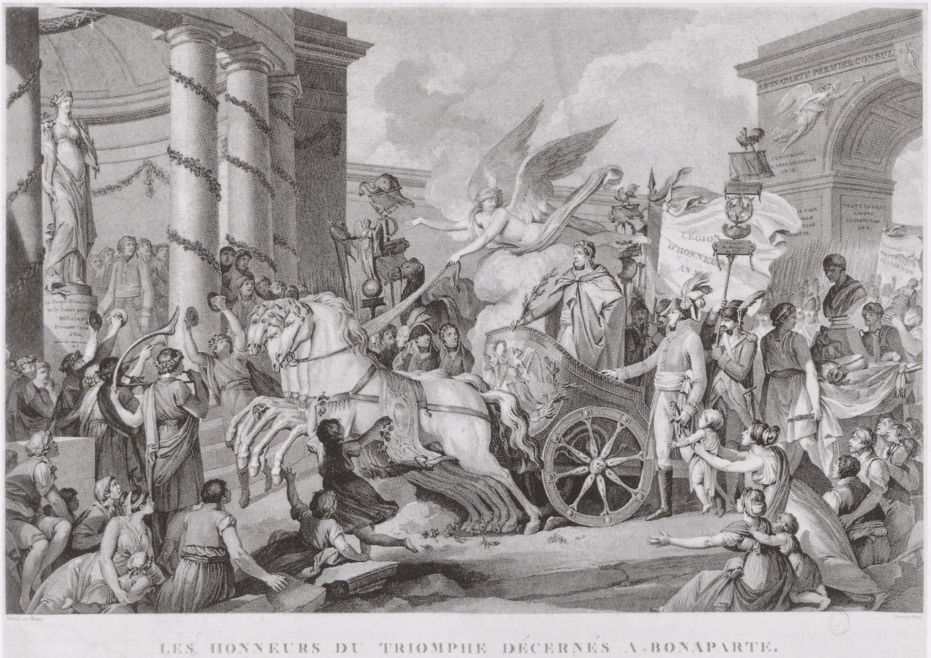
8. F.-A. David nach C. Monnet: Les Honneurs du triomphe décernés à Bonaparte. Kupferstich u. Radierung, Paris, 1802 (MC, G.30600 rés.)