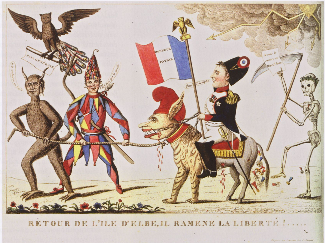
7. Anon.: Retour de l'île d'Elbe, il ramene la liberté! Kol. Radierung, Paris: Genty, März 1815 (DV 9407)