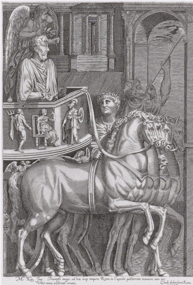
1. N. Beatrizet: M. Aur. Imp. Triumphi imago ... Kupferstich, Rom: A. Lafréry, 1583 (BM, Inv. 1856,0712.1032)

Der antik-römische Triumphzug war das Einzugsritual, mit dem ein gerechter Krieg ( bellum iustum ) beendet wurde. Er stellte eine herausragende militärische Ehrung für den siegreichen Feldherrn dar und war den höchsten Beamten, in der Kaiserzeit dem Imperator, vorbehalten. Der Triumphzug zeichnete sich durch einen feststehenden, zielgerichteten Ablauf im römischen Stadtraum aus; er passierte verschiedene Stationen, um im Großtempel des Iuppiter Optimus Maximus auf dem Capitol zu enden. Auch die Zusammensetzung des Triumphzugs aus verschiedenen geordneten Gruppen war stets identisch: Angeführt wurde er von Wagen sowie Traggestellen mit Kriegsbeute, von Gefangenen und bildlichen Darstellungen von herausragenden Kriegstaten (Triumphgemälde), dann folgten die Magistrate und der Senat, schließlich der Triumphator in jupiterähnlicher Kleidung auf dem von