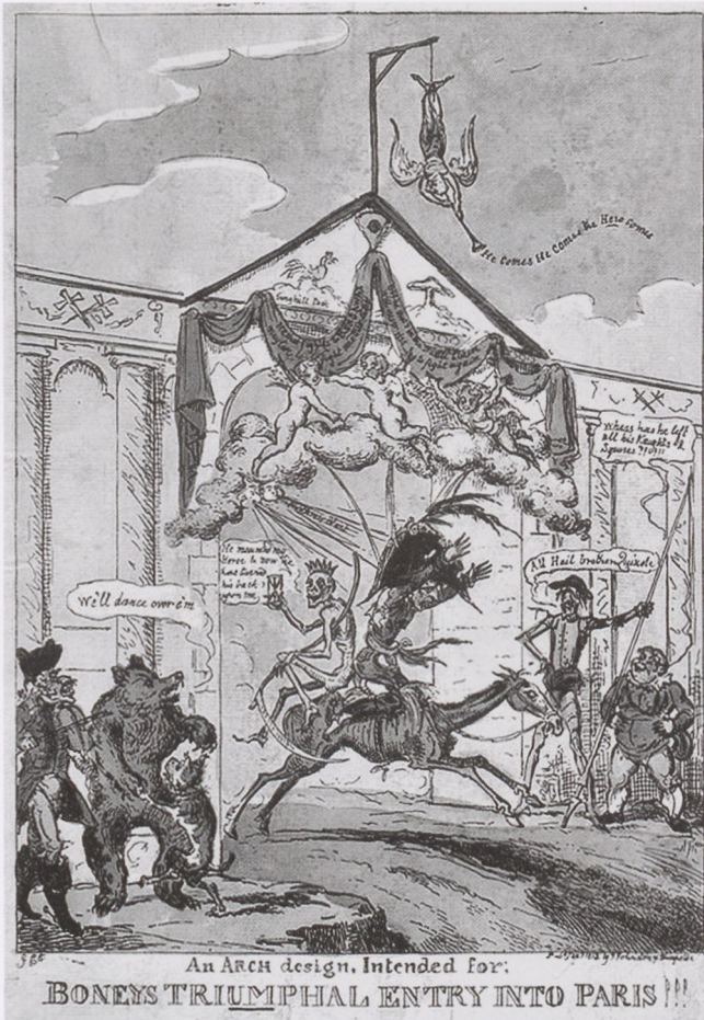
9. G. Cruikshank: An Arch design. Intended for; Boneys Triumphal Entry into Paris!!! Kol. Radierung, London: J. Johnston, Jan. 1813 (Salenstein, Napoleonmuseum, 1980.199)

blick ja tatsächlich nicht fortwirkend triumphal war. 81 Im Gegenzug wird die Arrivée du Roi à Paris le 3 Mai 1814 , die Rückkehr von Louis XVIII, als Triumphzug durch die Porte Saint-Denis gefeiert. 82 Die besonders heftig antinapoleonisch engagierten englischen Karikaturisten transformierten Napoleons Schandzug nach Elba gerne in einen Schurkenzug, so George Cruikshank in A GRAND Manœuvre! 83 oder Thomas Rowlandson in The Rogues March . 84 Auch als Höllenfahrt findet man den Abgang des Kaisers dargestellt, so in der niederländischen Radierung Den aftogt van den Menschen Beul Napoleon met zyne monsters naar het helsche ryk . 85 Einen Höhepunkt erreicht diese Verunglimpfung des Rückkehrers in der kolorierten Radierung Retour de l'île d'Elbe, il ramene la liberté! vom März 1815 (Abb. 7), in der Napoleon vom Teufel auf einem störrischen apokalyptischen Tier mit bonnet de la liberté herangeführt wird, den Ausruf »Quel Triomphe« auf den Lippen und hinter sich – in sarkastischer Abwandlung des berühmten Revolutionsdiktums Liberté ou la mort – einen Sensenmann mitführend.