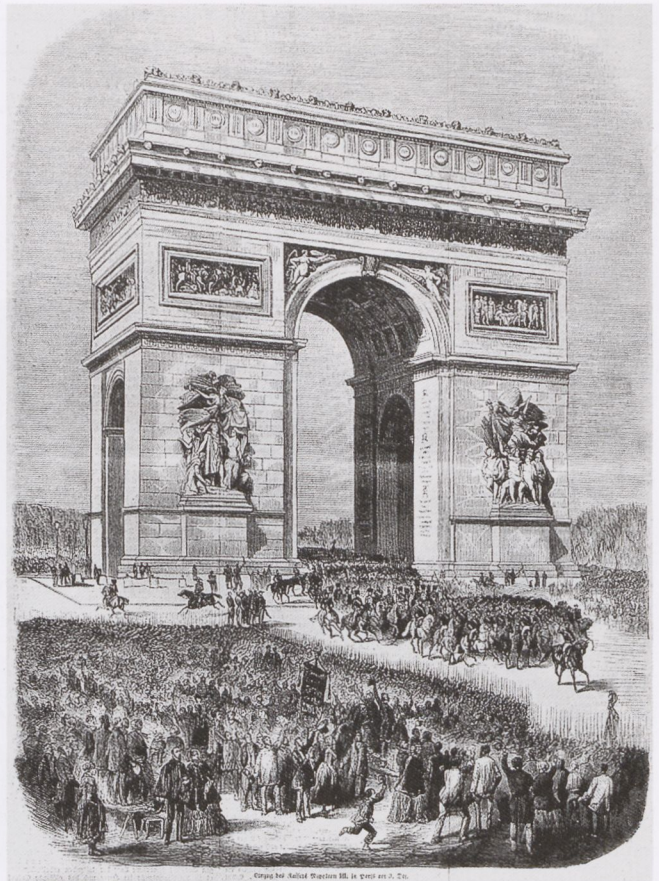
11. Anon.: Einzug des Kaisers Napoleon III. in Paris am 3. Dec. Holzstich, in: Illustrierte Zeitung (Leipzig) Bd. XIX, Nr. 495, 25. Dez. 1852, S. 408

Die von Napoleon für Paris geplanten Bogen (vor allem der Arc de Triomphe du Carrousel und der Arc de l'Étoile ) orientierten sich in ihrer Gestaltung an den drei wichtigsten römischen Vorbildern – dem Septimius Severus- und dem Konstantinsbogen für den dreibogigen Typus, dem Titusbogen für die einbogige Variante. 99