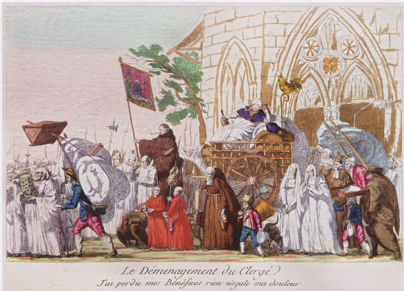
6. Anon: Le Déménagement du Clergé . Kol. Radierung, Paris, 1791 (MC, G.25385)

lären Radierung Retour de la Famille Royale à Paris 70 oder in einem Stich der Tableaux historiques 71 – im Hintergrund droht hier eines der Ledoux'schen Zollhäuser als Emblem der finanziellen Ausbeutung des Volkes durch den König. Als veritabler Schandzug und damit erneut die Ambivalenz von Triumphzug und Schandzug je nach Standort des Betrachters illustrierend, präsentiert sich das Ereignis in der kolorierten Bildsatire La famille Des Cochons ramenée Dans L'étable , in der nicht die Zugtiere, sondern die Passagiere im Schinderkarren als Schweine dargestellt sind. 72 Im römischen Satire-Journal Il Don Pirlone vom 23. März 1849 wird dieses Motiv mit einem vegetabilen Triumphbogen unter dem Titel Onori d'un gra(n)de Trionfo a Torino auf Carlo Alberto von Sizilien und seine Gattin appliziert (Abb. 5). Die triumphale Herrscher-Entrée, der vielleicht wichtigste Bestandteil der symbolischen Legitimation von Herrschaft 73 , wird hier in einer drastischen Anti-Zeremonie in ihr Gegenteil verkehrt und damit in ein Ritual der Aberkennung von illegitimer Macht transformiert. 74 In Momenten der Neuetablierung von Herrschaftslegitimation müssen altes und neues Ritual exakt reziprok angewendet werden: Erst in der performativen Verdoppelung eines Herrschaftsaktes mit genau umgekehrten