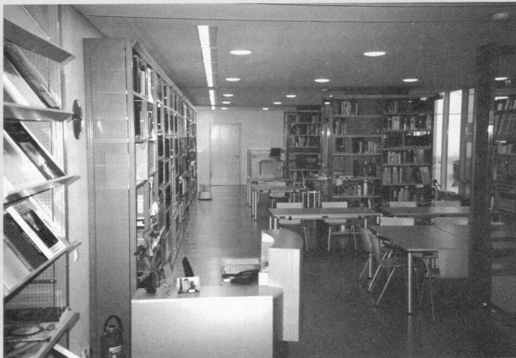
Blick vom Eingangsbereich über die gesamte Länge des Leseraumes

dass Direktor Hornbostel Anfang 2000 in einem Vortrag von der Bibliothek als „geistige[m] Forschungszentrum des Museums“ sprach.