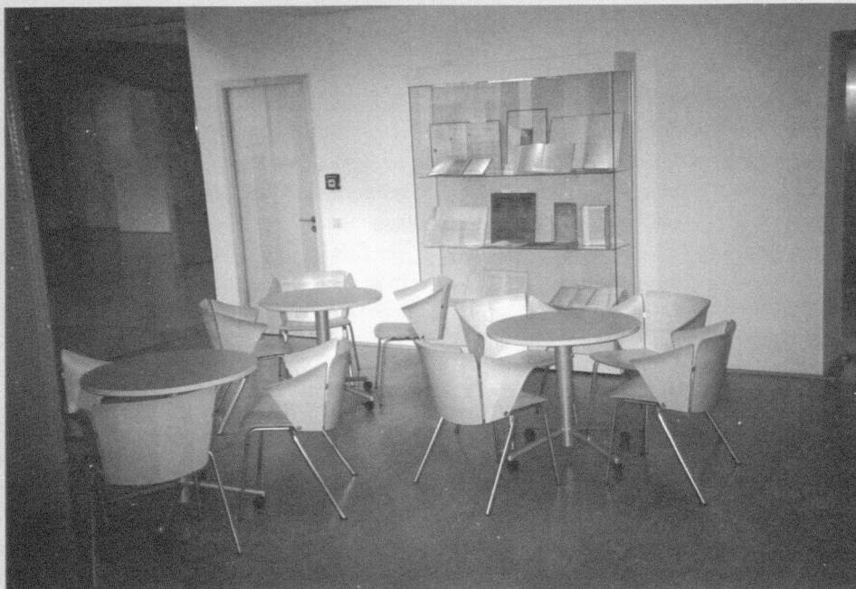
Eingangsbereich mit Ausstellungsvitrine

„Stätte wissenschaftlichen Lebens und kulturellen Austauschs“ kann die Museumsbibliothek werden, denn mit Hilfe der Ehrenamtlichen ist es mir auch möglich, regelmäßig Veranstaltungen anzubieten. Von der Direktion zunächst ein wenig skeptisch beäugt, hat sich jetzt ein monatlicher Rhythmus eingespielt: „Im Gespräch“ heißt die Reihe, die monatlich einmal am Donnerstagabend (das Museum hat bis 21.00 Uhr geöffnet) um 17.00 Uhr stattfindet. Hier werden Themen rund um das Buch dargebracht und dem Publikum zur Diskussion gestellt von Experten, Buchkünstlern und AutorInnen.