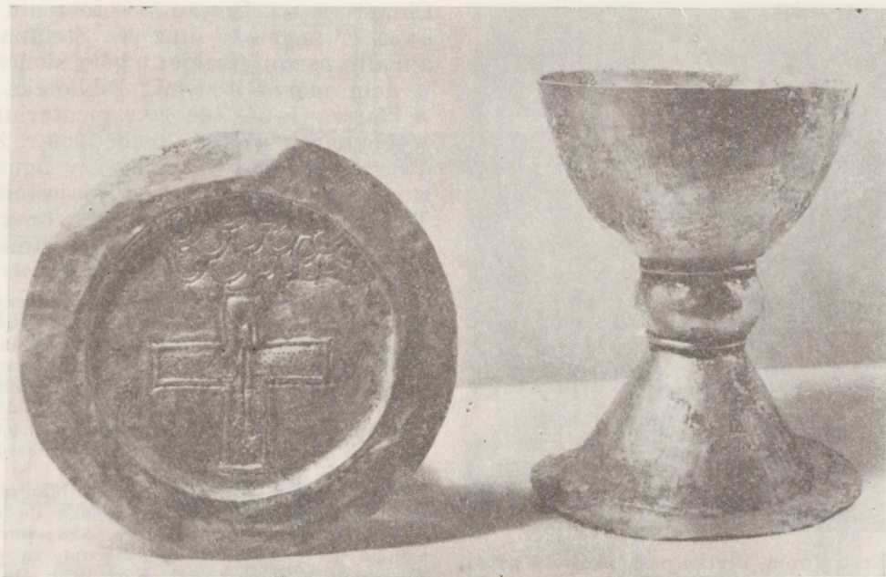
124. Tyniec. Złoty kielich i patena z grobu nr 8.

bione motywami wstęgowo-roślinnymi, plecionkowymi i w jednym wypadku postaciami antytetycznych ptaków), dziewięć baz kolumniek i kilka trzonów. Tektoniczny typ kapiteli w odmianie trapezowej oraz charakter płaskorzeźbionej dekoracji wywodzą się z tradycji biz., która do T. przyszła za pośrednictwem warsztatów północnówł. Z przebudowy po połowie XIII w. pochodzi wspornik z głową kobiecą w koronie o formie muru zębatego.