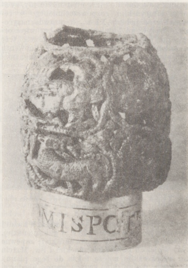
123. Tyniec. Złota obrączka i nodus od pastorału z grobu nr 8.

nego przez mnichów, lub też opata, i tradycji reprezentowanych przez architekta, przybyłego zapewne z Węgier za pośrednictwem króla Władysława św. Warsztat wykonujący kościół tyniecki był jednak miejscowy (technika murów i bazy półkolumn analogiczne jak w tzw. pierwszej katedrze krakowskiej). Kościół tyniecki otrzymał różową posadzkę gipsową, która