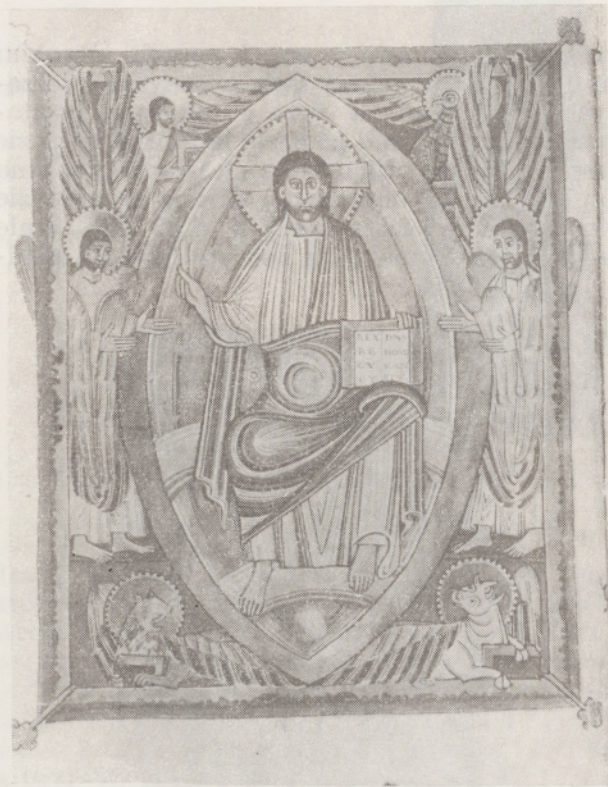
127. Sakramentarium tynieckie. Miniatura z przedstawieniem Maiestas Domini.

kiego jedwabiu z haftowanymi krzyżami wpisanymi w koło. Stuła i manipularz wykonane zostały zapewne na Sycylii około połowy XII w.; wzór postaci i napisów powstał natomiast w kręgu sztuki szkockiej lub iryjsko-northumbryjskiej. Z T. pochodziła (obecnie zaginiona) plakietka z kości słoniowej z drugiej połowy IX w. (lub początków X w.) przedstawiająca