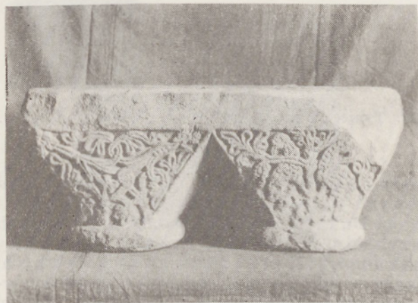
121. Tyniec. Klasztor rom. Kapitel bliźni.

2..Zabytki sztuki opactwa tynieckiego znane są w wyniku badań A. Szyszko-Bohusza z r. 1943, G. Leńczyka z l. 1949–50 i przede wszystkim L. Kalinowskiego z l. 1961–65 oraz dzięki odkryciom dokonany podczas odbudowy kl. w l. 1947–53. Rom. kościół p.w. Św. Piotra, wybudowany w ostatniej ćwierci XI w.,