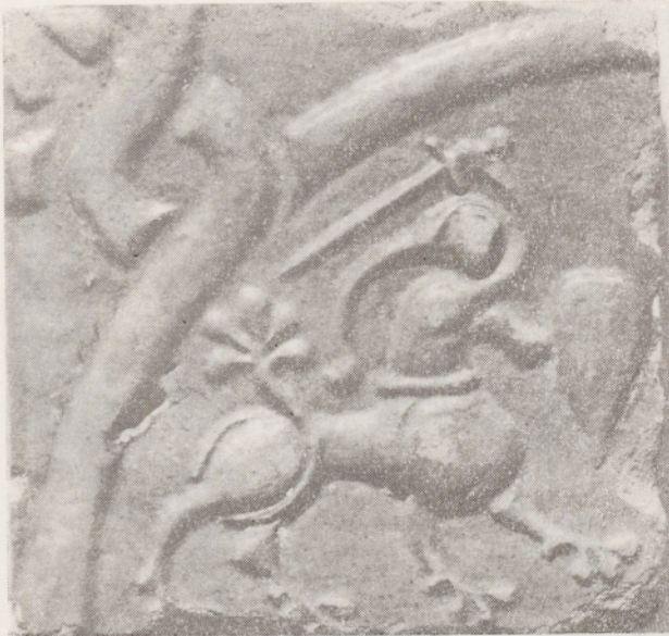
126. Tyniec. Kościół rom. Płytką posadzkowa z przedstawieniem centaura.