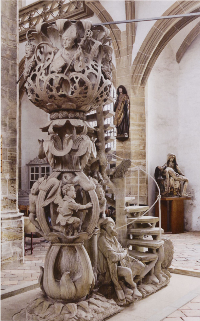
1 Sogenannte Tulpenkanzel im Freiburger Dom, Meister HW, um 1500