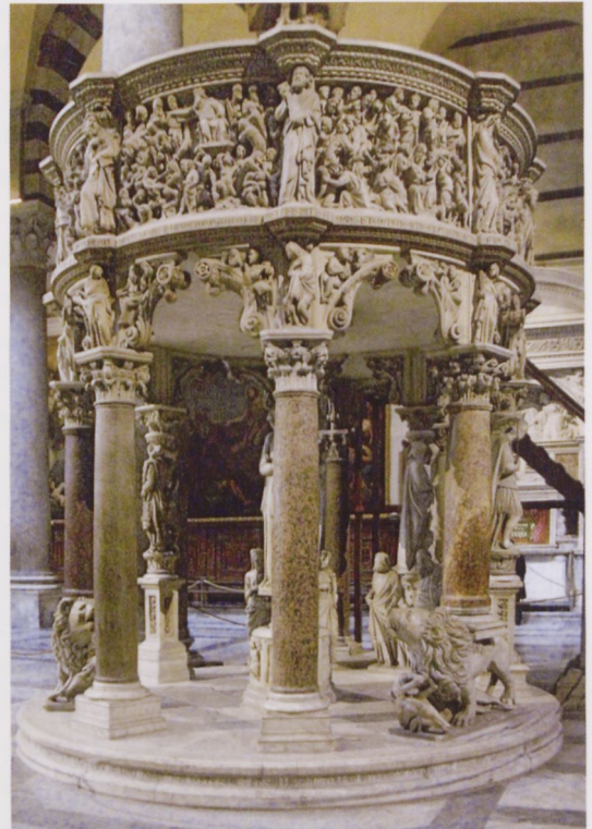
4 Pisa, Dom, Kanzel des Giovanni Pisano mit Künstlerinschriften am Sockel und unterhalb der Brüstung, 1301–1311

Und schließlich kommt hinzu, dass über den altbekannten Zusammenhang zwischen dem Rang des Werkes und dem Rang des Auftraggebers nun auch ein Zusammenhang zwischen der Bedeutung des Werkes und derjenigen des Künstlers hergestellt wurde. Nicht umsonst finden sich die elaboriertesten Künstlerinschriften an den großen Kunstwerken, seien es die Kathedralkirchen selbst oder seien es ihre wichtigsten Ausstattungstücke, wie zum Beispiel die Kanzeln von Nicola und Giovanni Pisano in den Domen von Pisa und Siena. (Abb. 4) Das