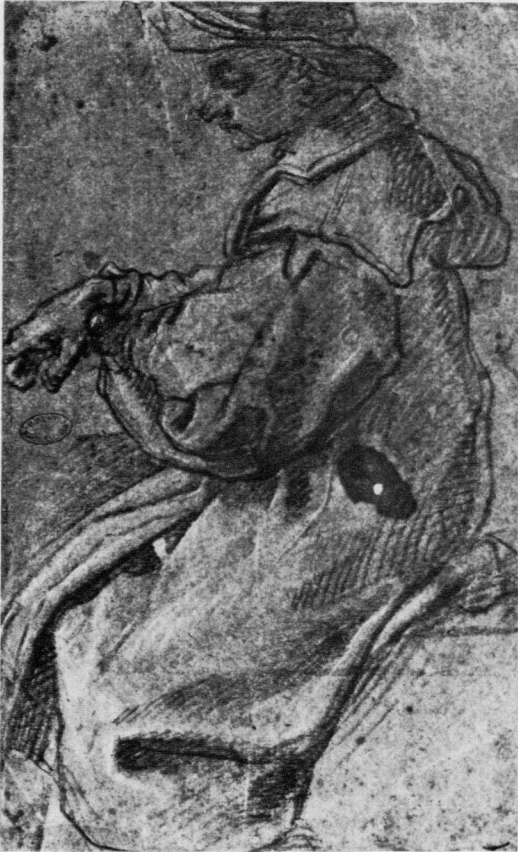
2 Francesco Vanni, Studie zum Pharisäer Simon. Florenz, Biblioteca Marucelliana, B 134 r.