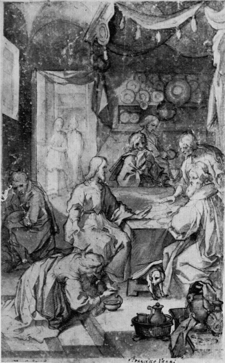
1 Francesco Vanni, Gesamtentwurf für "Das Gastmahl des Pharisäers". Rom, Gabinetto Nazionale delle Stampe, 126 112.