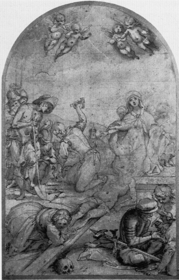
6 Nach (?) Francesco Vanni, Kompositionszeichnung zu "Die Kreuzanheftung Christi". Sammlung E. Schapiro, London/Paris.

Über das Aussehen des dritten in S. Francesco verbrannten Bildes von Vanni, un Cristo quando è posto in Croce , habe ich in anderem Kontext Überlegungen angestellt. 16 Wahrscheinlich überliefern die — kaum eigenhändige — Zeichnung S. 1.017-1.562 in der Sammlung E. Schapiro, London/Paris (Abb. 6) 17 , die ungelenke Nachzeichnung 1980 im Louvre 18 und das malerisch schwache Altarblatt in S. Croce zu Sinalunga 19 die Komposition des verlorenen Monumentalwerkes von Vanni. Die "Kreuzanheftung Christi" war vermutlich das jüngste der von Vanni für S. Francesco gelieferten Altarbilder; sie dürfte um 1600 oder noch etwas später anzusetzen sein.