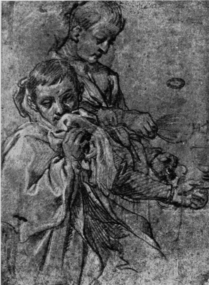
4 Francesco Vanni, Studie zu einem der Gäste und einem Diener. Florenz, Biblioteca Marucelliana, C 70.

Die drei Zeichnungen in der Biblioteca Marucelliana sind stilistisch und im Hinblick auf die Zeichentechnik eng verwandt. In allen Fällen handelt es sich um mit schwarzer und weisser Kreide auf rostrosa getöntem Papier verwirklichte Naturstudien. B 134 recto (Abb. 2) 6 ist auf Simon den Pharisäer zu beziehen, B 134 verso (Abb. 3) 7 auf den vorgebeugt stehenden Gast hinter Simon, C 70 (Abb. 4) 8 auf die Gruppe des zweiten Gastes und des weineinschenkenden Dieners. Gemeinsam ist den drei Studien ein spontaner und zugleich entschiedener Strich; die Umrisse sind ohne harte Brechungen geführt, die Schraffuren in Parallel- und Kreuzlagen wechselnder Kräftigkeit gesetzt, die Höhungen ökonomisch auf die lichtreflektierenden Grate und Punkte verteilt. Das Zusammenspiel mit dem rostrosa Tongrund 9 sorgt für eine relativ malerisch-weiche Wirkung. Die Ateliersituation ist den drei Studien sogleich anzumerken: Personen und Aufmachung lassen die physische Präsenz der (vermutlich Vannis Mitarbeiterstab entstammenden) Modelle spüren. Auf dem Gesamtentwurf wirken die Figuren, von Abweichungen der Kostümierung abgesehen, steifer und distanzierter.