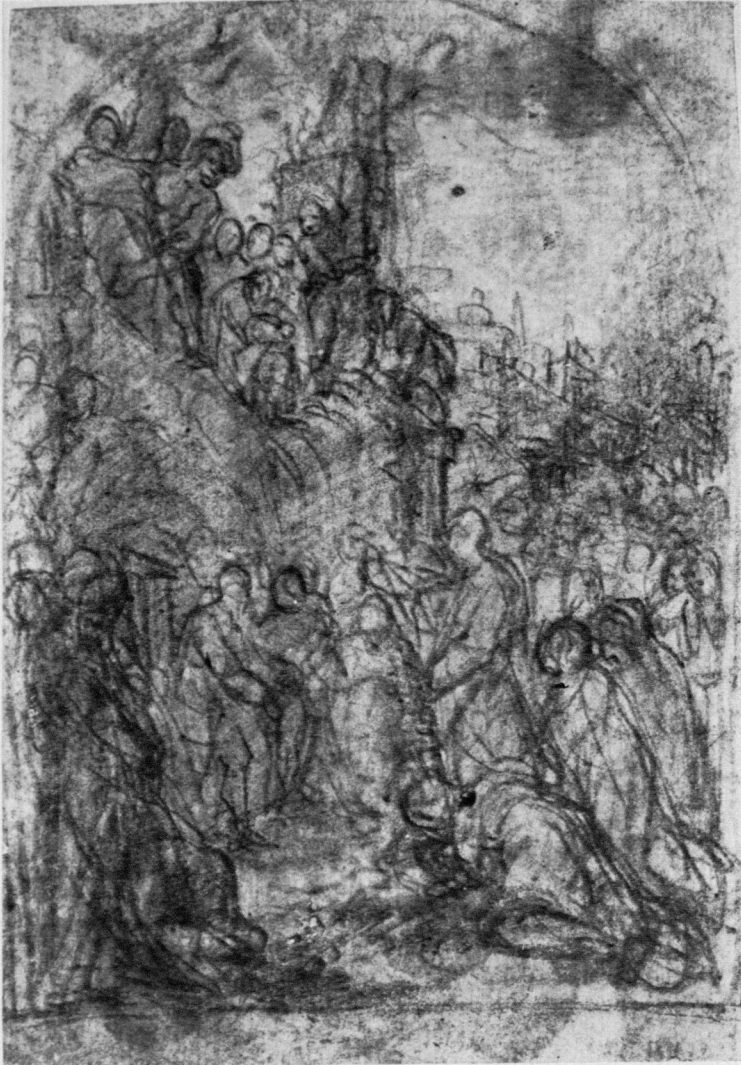
8 Alessandro Casolani, Kompositionsskizze zu "Die Erweckung des Lazarus". Siena, Biblioteca Comunale, E. I. 12/97 v.

Skizze grösser, die Protagonisten — Christus und Lazarus — sind vergleichsweise weit voneinander entfernt. Dadurch, dass die Figur Christi in betontem Achsenzusammenhang mit der Arkade im Mittelgrund steht, wirkt sie erhabener und dramaturgisch gewichtiger als auf den späteren Fassungen. Lazarus ist, soweit sich erkennen lässt, in schlaffer Haltung, also noch dem Tode nahe, gegeben. Rechts neben der Gesamtskizze findet sich in Gestalt einer Teilkomposition eine andere Interpretation des Erweckungsvorgangs: Christus und Lazarus sind zur Gruppe zusammengefasst, Lazarus kniet aufblickend und mit gefalteten Händen vor dem Wundertäter; ein Podest steigert die Theatralik der Szene. Ausser diesen beiden Darstellungen bietet das Blatt weitere Skizzen: links oben zwei Figuren, die auf zwei der erhöht postierten Zuschauer zu beziehen sein mögen, oben in der Mitte eine Par-