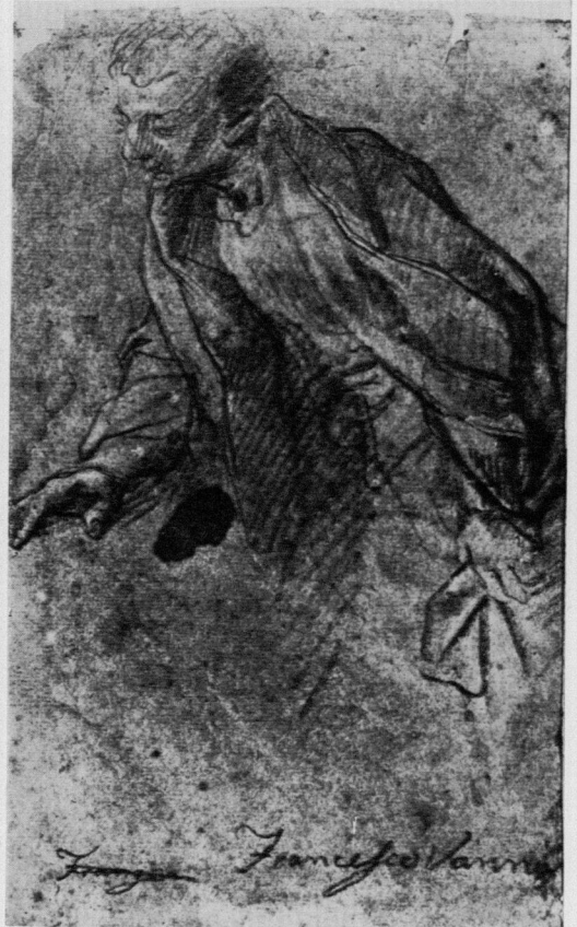
3 Francesco Vanni, Studie zu einem der Gäste. Florenz, Biblioteca Marucelliana, B 134 v.

hervorschauend die Salbungsszene beäugt, figuriert als narrative Beigabe. Der Fluchtpunkt der — sehr sorglos perspektivierten — Komposition liegt etwa auf halber Höhe des Bildfeldes, also so, dass die Platte des Tisches in Schrägdraufsicht erscheint. Denkt man sich das Ganze in das Grossformat eines Altarbildes übersetzt, ergibt sich ein nicht eben vorteilhafter Raumeffekt; die Übersichtlichkeit der Darstellung ist allerdings — und dies entspricht wohl dem Sinn der besonderen räumlichen Organisation — grösser, als das bei einem tieferliegenden Fluchtpunkt erreichbar wäre.