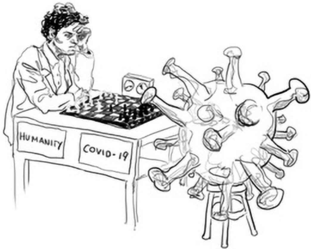
Ruscha Voormann: Corona Chess, Digital Drawing, 2020, © Ruscha Voormann.