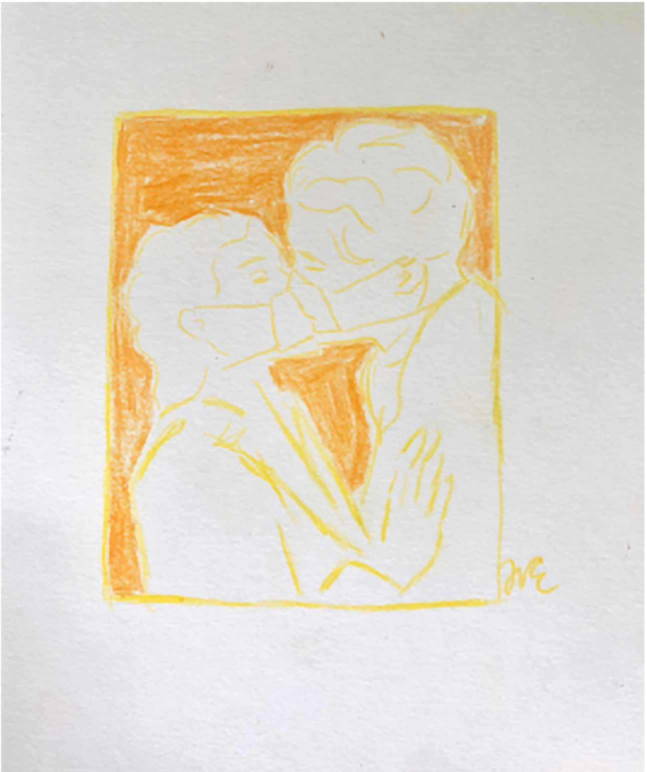
Josephina Elverfeldt: Kiss, Drawing, Unique and Original, Pastel on Paper, 22 cm x 20 cm, Canstein, 2020, © Josephina Elverfeldt.