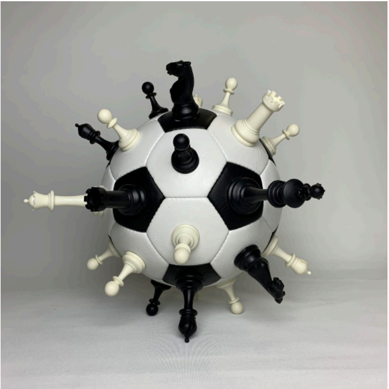
Milen Till: Fußball ist wie Schach, nur ohne Würfel, Durchmesser: ca. 38 cm, Material: Schachfiguren auf Lederball, 2020, © Milen Till.