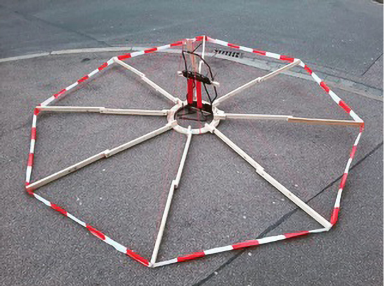
Peter Langenhahn und Esther Zahel: SD-Tutu (social distance Tutu), 3 m x ca. 80 cm, Holz, Maurerschnur, Kraxe, Kabelbinder, Schrauben, 2020, © Peter Langenhahn und Esther Zahel.