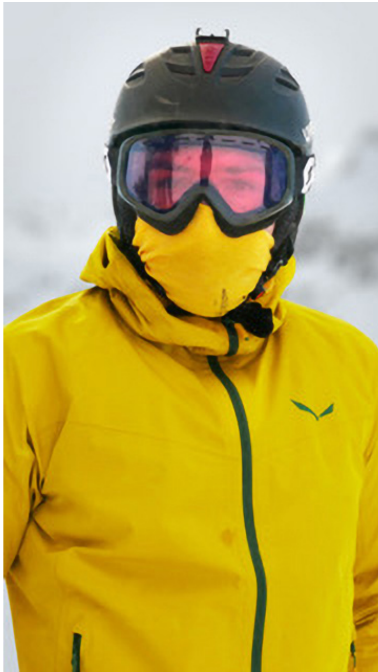
Anna Anders: Protection II, digitale Fotografie/Fotoserie, 55,0 x 32,2 cm, Fine Art Print, fotografiert 4. bis 8. März 2020 auf dem Pitztaler Gletscher in Tirol, Österreich, 2020, © Anna Anders.