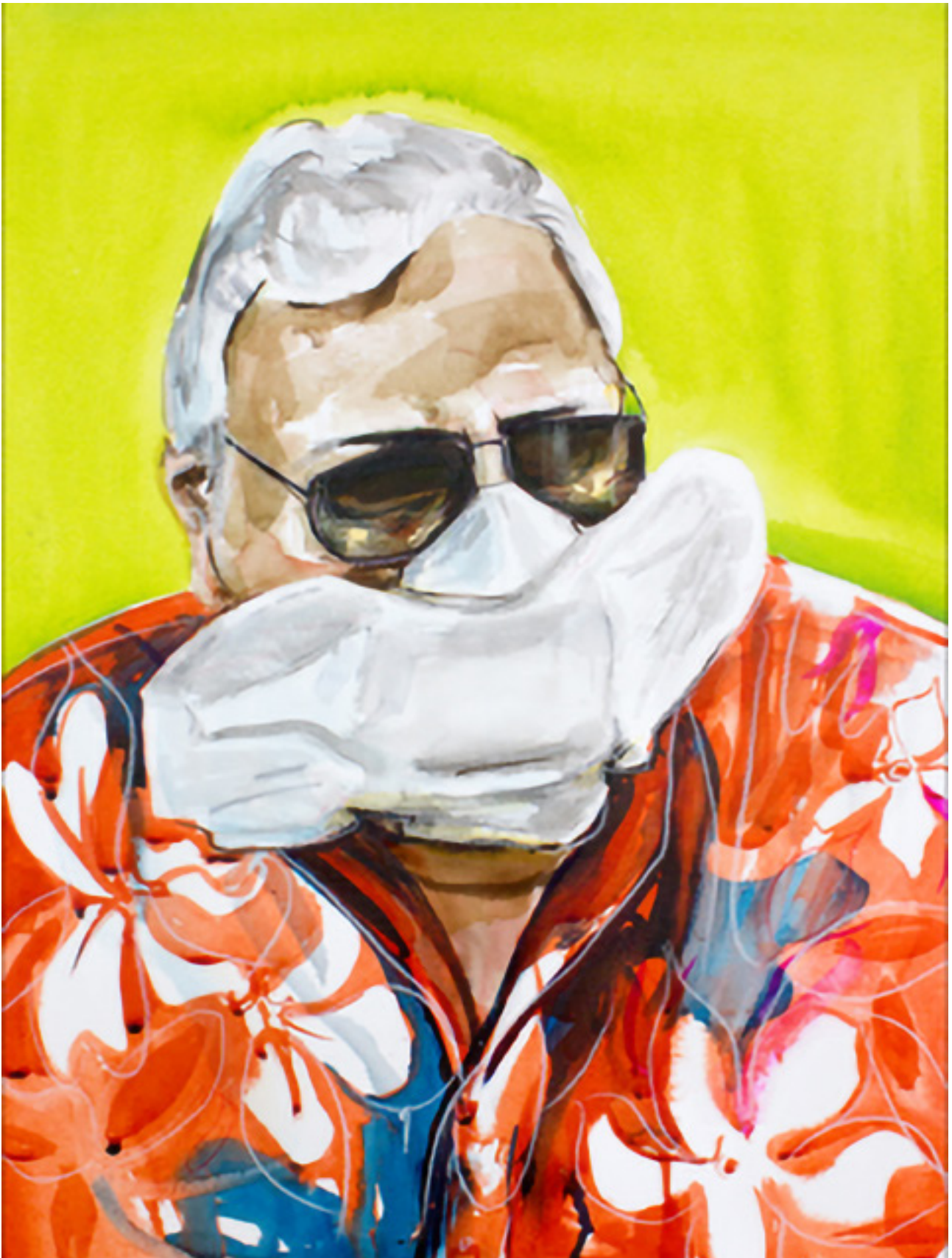
Anna Härtelt: Die Binde, Serie Situationselastisch, Aquarellfarbe und Tusche auf Papier, 56 x 42 cm, 2020, © Anna Härtelt.