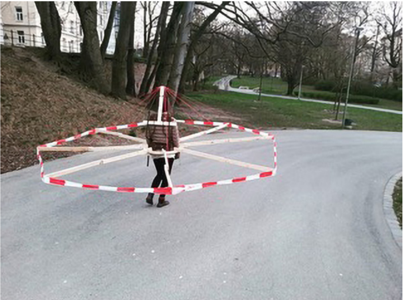
Peter Langenhahn und Esther Zahel: SD-Tutu (social distance Tutu), 3 m x ca. 80 cm, Holz, Maurerschnur, Kraxe, Kabelbinder, Schrauben, 2020, © Peter Langenhahn und Esther Zahel.