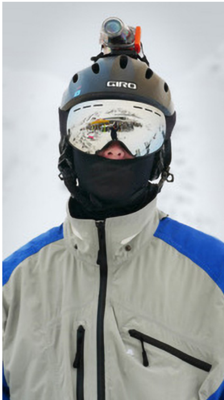
Anna Anders: Protection II, digitale Fotografie/Fotoserie, 55,0 x 32,2 cm, Fine Art Print, fotografiert 4. bis 8. März 2020 auf dem Pitztaler Gletscher in Tirol, Österreich, 2020, © Anna Anders.