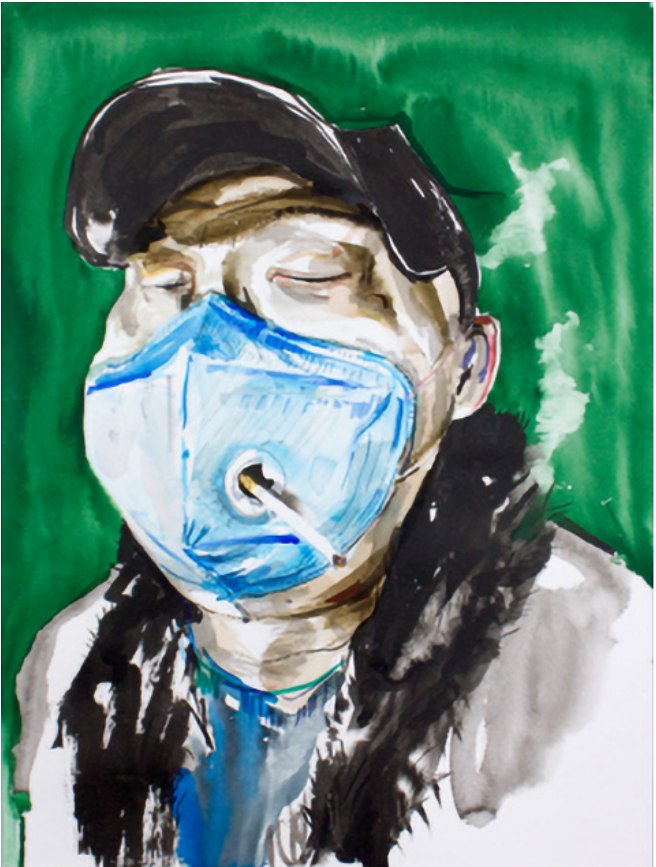
Anna Härtelt: Smart Smoker, Serie Situationselastisch, Aquarellfarbe und Tusche auf Papier, 56 x 42 cm, 2020, © Anna Härtelt.