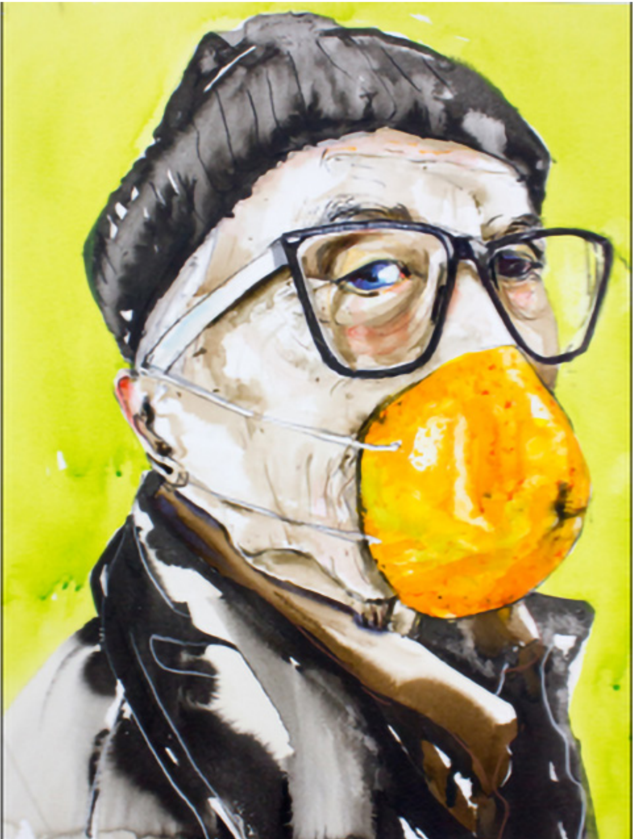
Anna Härtelt: Orangenschnute, Serie Situationselastisch, Aquarellfarbe und Tusche auf Papier, 56 x 42 cm, 2020, © Anna Härtelt.