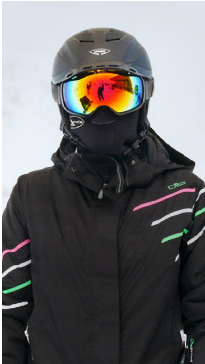
Anna Anders: Protection II, digitale Photographie/Fotoserie, 55,0 x 32,2 cm, Fine Art Print, fotografiert 4. bis 8. März 2020 auf dem Pitztaler Gletscher in Tirol, Österreich, 2020, © Anna Anders.