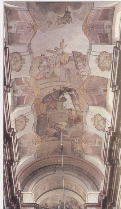
J. Piltz: polichromia w kościele Trynitarzy, 1758

pomocą malowanych pilastrów ściany dekorowano naśladowującymi reliefy, monochromatycznymi przedstawieniami o tematyce antykizującej); tego typu dekoracje zachowały się m.in. w kamienicy przy ul. Floriańskiej 9 oraz pałacach Pod Krzysztoforą i Małachowskich.