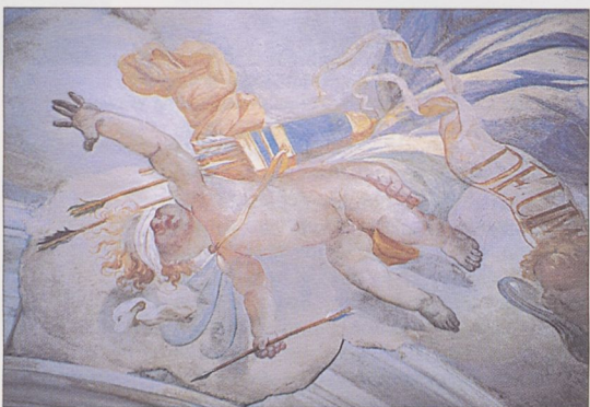
K. Dankwart: Alegoria błogosławieństw , 1696–1703, kościół Św. Anny

Stanisława (1626–29) oraz kaplicy Lubomirskich przy kościele Dominikanów; nie zachowały się natomiast dekoracje ozdabiające pomieszczenia na 1 i 2 piętrze tzw. wieży Zygmunta III Wazy na Wawelu (ok. 1602). Wspomnieć należy także o powstających od lat 30. do końca XVII w. malowidłach na sklepieniach (i częściowo ścianach) kaplic bocznych w kościele Św. Piotra i Pawła (zachowane szczątkowo) oraz współczesnej im polichromii w kaplicach kościoła Kamedułów na Bielanych. Przykład dekoracji mal. wkomponowanej w got. sklepienie krzyżowo-żebrowe stanowią malowane kartusze ze scenami alegorycznymi poświęconymi męce i śmierci Chrystusa w pd.-wsch. narożniku krużganków franciszkańskich (po poł. XVII w.). Z architekturą got. łączyła się także polichromia w prezbiterium i korpusie Katedry na Wawe-