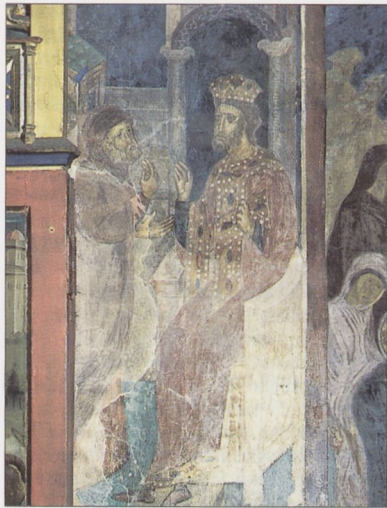
Fragment polichromii w kaplicy Świętokrzyskiej, 1470 — Katedra na Wawelu

Stanisława (1626–29) oraz kaplicy Lubomirskich przy kościele Dominikanów; nie zachowały się natomiast dekoracje ozdabiające pomieszczenia na 1 i 2 piętrze tzw. wieży Zygmunta III Wazy na Wawelu (ok. 1602). Wspomnieć należy także o powstających od lat 30. do końca XVII w. malowidłach na sklepieniach (i częściowo ścianach) kaplic bocznych w kościele Św. Piotra i Pawła (zachowane szczątkowo) oraz współczesnej im polichromii w kaplicach kościoła Kamedułów na Bielanych. Przykład dekoracji mal. wkomponowanej w got. sklepienie krzyżowo-żebrowe stanowią malowane kartusze ze scenami alegorycznymi poświęconymi męce i śmierci Chrystusa w pd.-wsch. narożniku krużganków franciszkańskich (po poł. XVII w.). Z architekturą got. łączyła się także polichromia w prezbiterium i korpusie Katedry na Wawe-