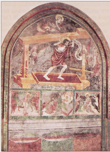
Chrystus w tloczni mistycznej , ok. 1440 — krużganki klasztoru Franciszkanów

W Kr. zachował się duży zespół zabytków m. ściennego z XV w.; w 1 poł. stulecia powstały m.in. polichromie figuralne w kaplicy Ligęzów w kościele Dominikanów, malowidła w krużgankach klasztoru Augustianów (wykonane w kilku etapach, przez kilka warsztatów działających na pocz. XV w.), Ukrzyżowanie na fasadzie kościoła Św. Krzyża (ok. 1420, Wawrzyniec Czech?), Zwiastowanie w krużgankach klasztoru Franciszkanów (ok. 1436) oraz malowidła w tzw. zielonej komnacie w kamienicy przy ul. Mikołajskiej 2 (ok. 1430, z przedstawieniem Matki Boskiej z Dzieciątkiem między 2 świętymi oraz ze sceną Ukrzyżowania). Wszystkie dzieła (mimo różnic warsztatowych) łączy przynależność do kolejnych faz tzw. stylu międzynarodowego ok. 1400 (typ postaci, miękki sposób kształtowania i układania draperii), a także wyraźne wpływy artyst. środowiska czeskiego. Początki lokalnego krak. wyrazu formalnego można zauważyć w malowidłach franciszkańskich z ok. 1440: Chrystus w tloczni mistycznej (o treściach eucharystycznych i antyhuscych), Stygmatyzacja św. Franciszka , a zwł.