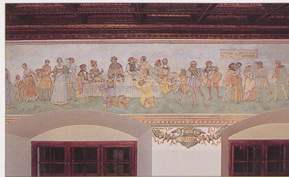
Fragment fryzu podstropowego Historia życia ludzkiego w Sali Pod Głowami, 1532 — Zamek Królewski na Wawelu

i etyczno-moralny, a wraz z polichromią portali i elementów archit. (malowane na czerwono kolumny dziedzińca) stały się wielokrotnie naśladowanym wzorem dla dekoracji mal. w budowlach świeckich. Do kanonu wystroju krak. kamienic mieszcz. weszły i przetrwały (przy zmianach stylistycznych) do schyłku XVII w. fryzy złożone z motywów arabskich, groteskowych i heraldycznych oraz medalionów i elementów architektury, ujęte roślinnymi girlandami, optycznie podtrzymujące ciężkie, belkowane lub kasetonowe, polichromowane stropy (liczne przykłady w domach przy ulicach Kanoniczej, Grodzkiej, Floriańskiej i wokół Rynku Gł.); barwnie tynkowane elewacje zdobione dekoracjami figuralno-heraldycznymi, sentencjami o charakterze moralizującym, polit. lub satyr., a od poł. XVI w. także sgraffitem, m.in. na domu Hipolitów (znane z fotografii archiwalnych), na elewacjach wewn. kamienic przy ul. Kanoniczej 18 oraz 23, a także Floriańskiej 49 i Św. Krzyża 13. Nie jest znany wystrój malarzki krak. renes. kaplic grobowych, zachowała się natomiast dekoracja kościoła i części klasztoru Cystersów w Mogile (wykonana 1537–38 pod kierunkiem S. Samostrzelnika), która stanowi interesujący przykład udanej próby wprowadzenia nowej estetyki (renes. ornamenty o filigranowym kształcie i miękkim modelunku) do