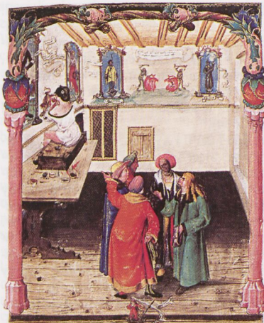
Kodeks Baltazara Behema: Malarze , ok. 1502 — Biblioteka Jagiellońska

W świetle zachowanych dzieł przełomu XV i XVI w. nie stanowił wyraźnej cesury w rozwoju krakowskiego m. ściennego; nadal obowiązywał dotychczasowy sposób wi-