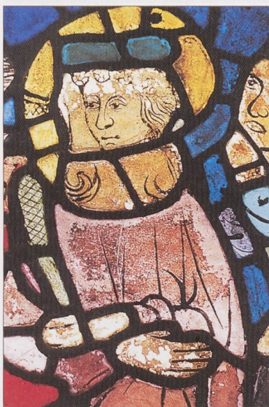
Witraż w kościele Mariackim, fragment, XIV w.

zeum Nar. w Kr.). Zachowała się duża liczba dzieł z 2 poł. XIV w.; w tym czasie przeszklono m.in. 11 trójdzielnych okien prezbiterium kościoła Mariackiego (zachowane 115 z ponad 600 kwatery w 3 oknach zamknięcia prezbiterium oraz kilka pól i fragmentów w zbiorach muzealnych); wśród zachowanych dzieł znajdują się prace różnych warsztatów czynnych kolejno przy szkleniu prezbiterium, m.in. kwatery pochodzące z cyklu Biblii pauperum (pierwotnie w oknach wsch. i pd-wsch.), cykl hagiograficzny (zachowany szcztakowo) i jasne szklenia ornamentalne, wykonane ok. 1360–70 przez warsztat czerpiący wzory z Niemiec pd., oraz 2 wielkie cykle narracyjne (staro- i nowotestamentowy) wypełniające pierwotnie 2 okna (zachowane pola znajdują się ob. w oknie pn.-wsch.), wykonane ok. 1370–80 przez warsztat o czes. proveniencji stylowej; zachowane pojedyncze kwatery z ok. 1380–90 oraz 1390–1400 stanowią pozostałość szklenia kolejnych 4 okien (2 cykle maryjne oraz cykl obrazujący przypowieść o pannach mądrych i głupich). W 2 poł. XIV w. pojawiły