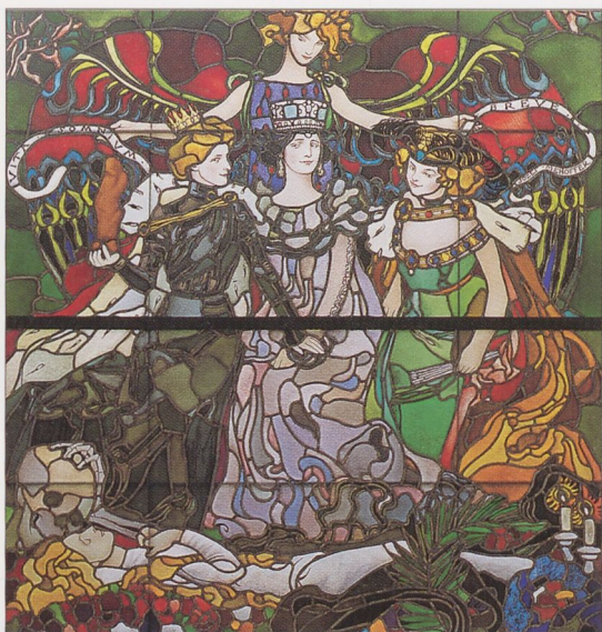
J. Mehoffer: Vita somnium breve , 1904 — Muzeum Narodowe, Kraków