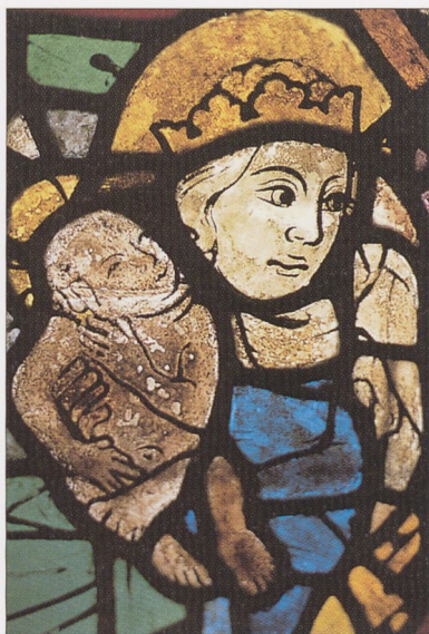
Witraż w kościele Mariackim, fragment, XIV w.

dób i pór roku światła przenikającego z zewnątrz. W Kr. malarstwo witrażowe pojawiło się zapewne jednocześnie z budownictwem chrześc. (początkowo w najważniejszych, prezbiterialnych oknach kościołów). Najstarsze znane dzieła pochodzą z końca XIII w. (zapewne istniały także wcześniejsze przykłady) i znajdowały się pierwotnie w oknach prezbiterium kościoła Dominikanów (powstały najprawdopodobniej z fundacji Leszka Czarnego) — medalion ze sceną Ukrzyżowania (w oknie wsch.) oraz wyobrażenia św. Augustyna i św. Stanisława w jednym z okien bocznych (ob. w Muzeum Nar. w Kr.); z ok. 1320 pochodzi kwatery z przedstawieniem Matki Boskiej z Dzieciątkiem o wł. inspiracjach stylowych i ikonograficznych (ob. w Mu-