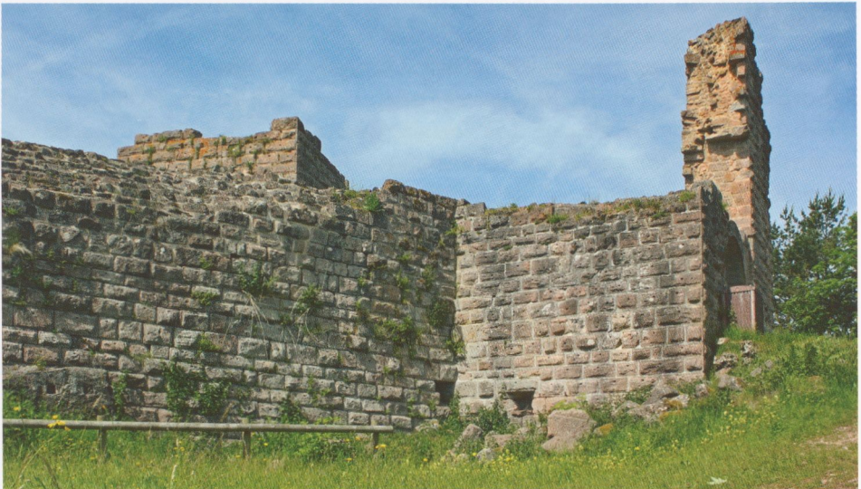
Abb. 6: Hohnack, die nordöstliche Ringmauer und die Ostseite der Ruine des Torturms, dahinter der Stumpf des Bergfrieds.

Der quadratische Torturm (4) springt in fast voller Breite vor die Nordseite der Ringmauer vor und weist im Grundsatz dieselben Merkmale eines Flankierungsturmes auf wie die anderen drei Türme der Burg; allerdings besitzt er eine etwas geringere Mauerdicke (2,20 m) als der östliche „Kapellenturm“ und der südliche „Hexenturm“. Sein Untergeschoss, das unter der ehemals von einer Balkendecke gebildeten 121 Durchfahrt lag, besaß beidseitig Scharten in innen erweiterten, stichbogigen Innennischen, die für eine effektive Flankierung dicht vor der anschließenden Kurtine liegen; im Osten findet man noch eine rechteckige Maulscharte (Abb. 6), das Pendant im Westen ist verschüttet. Das äußere, 3,16 m breite Rundbogentor, dessen Gewände voll erhalten ist, lag in einer Blende. Dass diese zu einer Zugbrücke mit Schwungruten gehörte, ist an der höher erhaltenen Nordwestecke des Turmes ablesbar, an der nämlich eine Seite des hohen Schlitzes für die westliche Schwungrute erhalten ist. Im Gegensatz zum erhaltenen Torgewände zeigt die Zeichnung von 1655 allerdings ein Tor und eine Fußgängerpforte mit jeweils eigener Zugbrücke nebeneinander, wobei die Ansicht keine Spur des erhaltenen breiten Rundbogens zeigt; man wird sie (nicht nur) in diesem Punkte als ungenau bzw. schematisch ansprechen müssen. Dass es beide Zugbrücken – und daher auch Tor und Pforte – wirklich