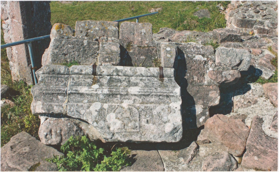
Abb. 16: Hohnack, ein Kaminsturzrest mit dem Rappoltsteiner Wappen, der 1938 gefunden und dann über einer wiederhergestellten Pforte eingemauert wurde. Durch den Einsturz dieser Pforte geriet er in die heutige Lage.

Saal) lag, im südöstlichen ein kleinerer (Schlafkammer). Zwischen der südöstlichen Giebelwand des Wohnbaues und der dort zum „Kapellenturm“ abknickenden Ringmauer dürfte nach dem Plan von 1655 eine wohl hölzerne Plattform gelegen haben, über die die Treppen zu den höheren Geschossen des „Kapellenturms“ führten.