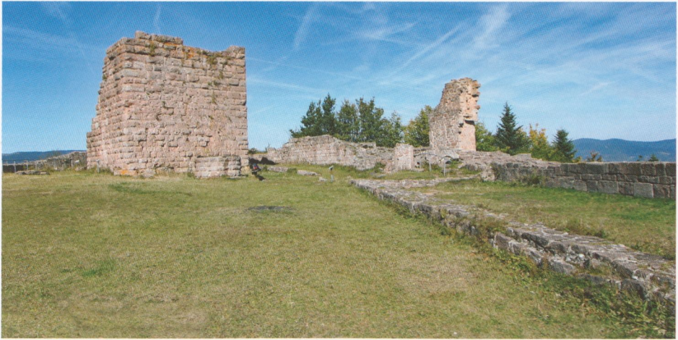
Abb. 3: Hohnack, das Innere der Burg gegen Nordwesten. Rechts vom Bergfriedstumpf sieht man den Rest der romanischen Ringmauer, dann den Mauerzacken, der von der Front des Torturms erhalten ist. Ganz rechts die restaurierten Grundmauern des Wohnbaues.