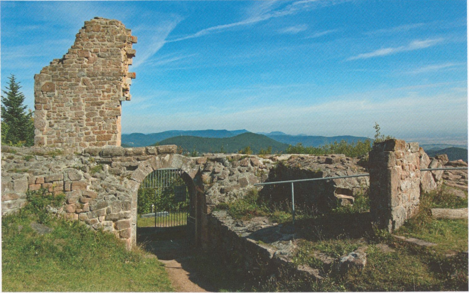
Abb. 8: Hohnack, die Ruine des Torturms und die Mauerreste der östlich dahinter liegenden Räume (rechts) vom Hof her. Hinter dem Mauerpfeiler rechts, an dem zwei Türgewände erhalten sind, erkennt man den „auf dem Kopf“ liegenden Kaminsturz (vgl. Abb. 16). Die Hohkönigsburg liegt auf dem isolierten, länglichen Berg ganz hinten.

weit darüber ein Rechteckfenster und auf der Höhe der Wehrgänge der Ringmauer einen breiten Wurferker; den Abschluss bildete ein niedriges Zeltdach.