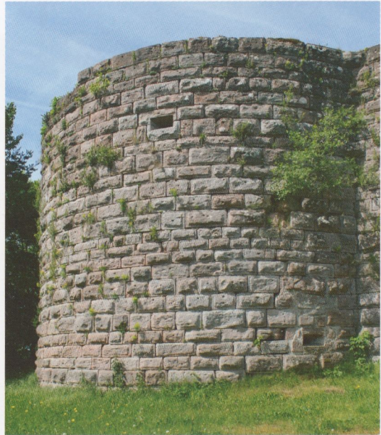
Abb. 9: Hohnack, der „Kapellenturm“ von Nordosten. Die untere Scharte ist schief eingebaut, um die Flankierung zu optimieren.

Ins Untergeschoss des „Kapellenturmes“, dessen heute schuttbedeckter Boden etwa 6 m unter dem Burghof liegt, führt eine relativ gut erhaltene zweiläufige Treppe, die sich an die hofseitige Wand des Geschosses lehnt. Das teils in den Fels gearbeitete Untergeschoss mit 3,80 m dicken Wänden besitzt gegen Norden und gegen Südwesten je eine außen erweiterte Maulscharte, die dicht über dem heutigen Außenniveau liegt und die anschließenden Kurtinenabschnitte flankiert; beim Gewände der nördlichen, rechteckigen Scharte fällt auf, dass sie – nachdem schon die Nische sehr schräg geführt ist – noch etwas schräger eingebaut wurde, offenbar um die Bestreichung zu optimieren; 124 die südliche Scharte besitzt dagegen außen die Form eines liegenden Ovals (Abb. 10), hinter ihr ist die Vertiefung für ein ehemals eingemauertes Prellholz erhalten. Die tiefen Nischen beider Scharten sind stichbogig überdeckt, beide sind innen leicht erweitert. Im ersten Obergeschoss des Turmes, das etwa auf Höhe des Burghofes lag, dessen auf breitem Absatz ruhende Balkendecke heute aber fehlt, lagen drei Scharten entsprechender Art in erweiterten inneren Stichbogennischen (Abb. 11); die südwestliche ist mit einem großen Teil der äußeren Mauerschale abgestürzt, nur der innere Teil ihrer Nische ist erhalten. Die Ausrich-