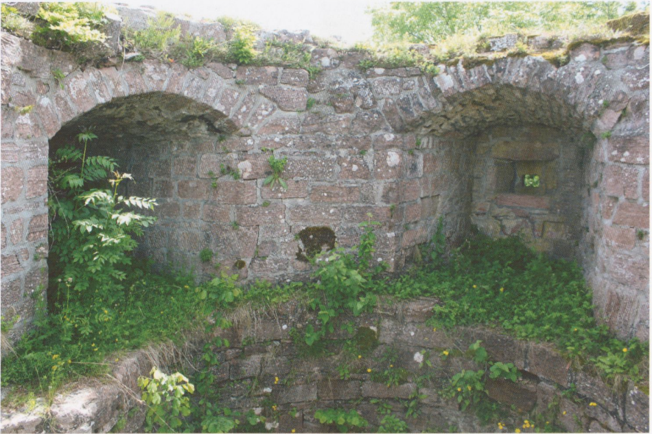
Abb. 11: Hohnack, zwei Schartennischen im Obergeschoss des „Kapellenturmes“ von Westen; die dritte Scharte, rechts außerhalb des Bildes, ist bis auf Nischenreste abgestürzt. Auf dem breiten Absatz ruhte die Balkendecke über dem hohen Untergeschoss.

wand an die Ringmauer – durch ein Glockentürmchen mit geschweiftem Dach und aufgesetztem Kreuz überragt wurde. Das andere Mauerwerk und die Gesims- und Dachformen legen es nahe, dieses Geschoss bzw. den Kapellenraum als nachträgliche Ergänzung anzusehen; allerdings wäre auch diese schon vor die Ersterwähnung des Kapellenturms 1516 zu datieren.