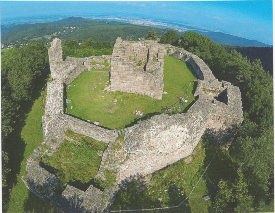
Abb. 1: Hohnack, Luftaufnahme der Ruine von Nordwesten, vorne die Reste des „Mühlenturms“, rechts des „Hexenturms“, links des Torturms. Im Hintergrund erkennt man Colmar.