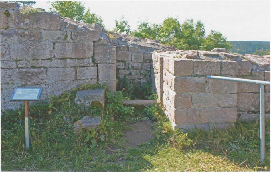
Abb. 14: Hohnack, Reste eines kleinen, ehemals durch eine Pforte verschließbaren Raumes in der südöstlichen Seitenwand des „Hexenturmes“; der Zweck des Raumes bleibt unklar. Die beiden Quader links von der Pforte gehören zu einer Treppe ins verschwundene Obergeschoss des Turms.