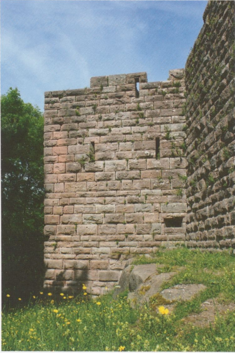
Abb. 12: Hohnack, der „Hexenturm“ von Südosten. Die Schlitzschartenform im Erd- und 1. Untergeschoss – für Armbrustschützen? – ist nur noch an diesem Turm festzustellen; im 1. Untergeschoss handelt es sich um eine von außen nicht erkennbare Hosenscharte.

wuchs verdeckt. Im 1. Untergeschoss, das immer noch unterhalb des Burghofniveaus liegt und dessen abgestürzte Südwestfront 1983 mit alten Buckelquadern neu verkleidet wurde, tritt dagegen eine Schartenform auf, die an den anderen Türmen nicht festzustellen ist 127 , nämlich Hosenscharten mit querrrechteckiger Innenöffnung (Abb. 13), die außen senkrechte Schlitze bilden; im Vergleich zu Scharten des 13./14. Jh. sind sie relativ breit (Abb. 12). An der Ostseite und der Südwestfront findet man je eine dieser Scharten, an der Westseite jedoch nur eine einfache Schlitzscharte. Vielleicht waren diese Scharten nur für Armbrustschützen vorgesehen, wofür auch das fehlende Prellholz spricht; gerade an der Südseite war ja ein Infanterieangriff weniger wahrscheinlich als im Osten oder Norden, wo der Burgweg das Plateau erreichte.