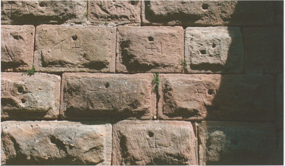
Abb. 5: Hohnack, Buckelquadern der Außenseite der südlichen Ringmauer, direkt westlich vom „Kapellenturm“. Charakteristisch für die späte Bauzeit sind einerseits die vergleichsweise kleinen und meist weit oben liegenden Zangenlöcher. Die Zeichen sind einerseits Steinmetzzeichen, andererseits Schichthöhenzeichen; sie sind nur deswegen gut erhalten, weil dieser Teil der Mauerschale bis Ende des 20. Jh. durch einen Schutthaufen geschützt war.

Mit den Steinmetz- und Schichthöhenzeichen, die man neben den Hebelöchern auf den Buckelquadern der Ringmauer findet, haben sich bereits 1980 René Kill und Bernard Haegel vergleichend auseinandergesetzt. 120 Sie betonten die beachtliche Zahl von vierzehn verschiedenen Schichthöhen, die sie mit Arbeitersparnis auf der Grundlage verschiedener Rohlinge aus dem Steinbruch erklären. Diese große Zahl verschiedener Höhen führte zu recht komplizierten Schichthöhenzeichen, zumal da diese auch in unterschiedlicher Weise mit den ebenfalls vorhandenen Steinmetzzeichen kombiniert wurden (Abb. 5). Dies muss hier nicht im Detail wiederholt werden, aber der von Kill und Haegel vorgetragene Vergleich mit Bauteilen zweier anderer elsässischer Burgen (Hohbarr, Hohkönigsburg) belegt jedenfalls, dass wir auch im Falle des Neubaus von Hohnack mit einer Bauzeit zu rechnen haben, die in die zweite Hälfte des 15. Jh. oder – was aber aufgrund der Quellenlage weniger