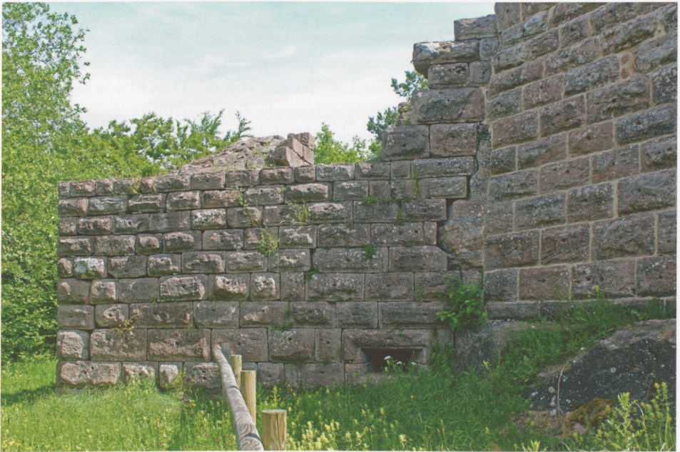
Abb. 15: Hohnack, die Südseite des „Mühlturns“; es ist wenig mehr als das 2. Untergeschoss erhalten. Aussagekräftig für die ursprüngliche Bergform ist aber der anstehende Fels, der im Winkel zwischen Turm und Kurtine sichtbar wird.

Für den heute noch ablesbaren, größeren Teil des Wohnbaues, an der Ringmauer östlich vom Torturm, zeigt der Plan von 1655, dass die Quermauer einen kleinen Vorraum ( vorhauf ; 9) abgrenzte, den man vom Hof betrat, 130 um dann nach rechts in eine größere Stube (10) weiterzugehen; in ihrem Bereich ist ein Pflaster aus gro-