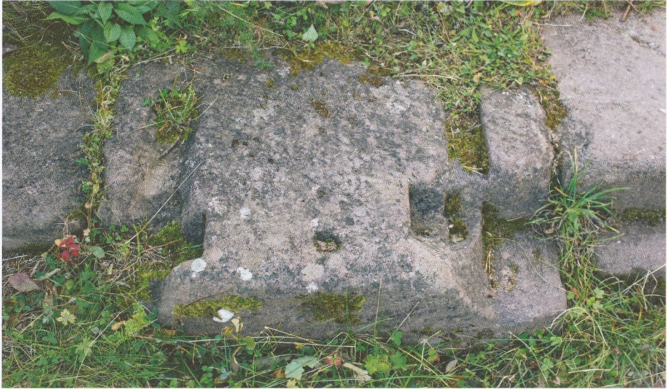
Abb. 7: Hohnack, das mittlere Auflager der beiden Zugbrücken in der Schwelle des äußeren Tores im Torturm.

gegeben hat, belegt jedoch das leicht vorkragende, monolithische Auflager, das zwischen beiden Durchlässen die Achsen der Zugbrücken aufnahm (Abb. 7). Man wird demnach vermuten dürfen, dass der als Ergebnis einer Restaurierung erhaltene, unprofilierte Rundbogen 122 das ursprüngliche Tor war, und dass das schmalere Tor und die Fußgängerpforte erst bei einem Umbau in dessen Gewände eingesetzt wurden; die Zeichnung von 1655 lässt dies aber nicht erkennen.