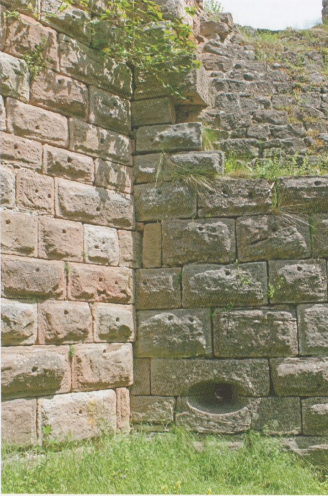
Abb. 10: Hohnack, die untere Scharte an der Südwestseite des „Kapellenturms“, die einzige ovale Scharte, die auf der Burg erhalten ist.

tion dieser Scharten ist gegenüber den unteren Scharten verschoben – sie zielten nach Osten, Süden und Südwesten, d. h. aus erheblicher Höhe auf den vorgelagerten steilen Berghang.