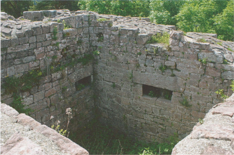
Abb. 13: Hohnack, Blick von Norden ins Innere des „Hexenturms“. Die beiden querrechteckigen Öffnungen im 1. Untergeschoss gehören zu zwei außen als senkrechte Schlitze erscheinenden Hosenscharten (vgl. Abb. 12), die Schartenreste im Erdgeschoss darüber sind stark restauriert.

Lage können sie keine Scharten enthalten haben. Besser erhalten ist die östliche Kammer, mit Resten des Gewändes der Pforte vom Hof (Abb. 14). Auf dem Plan von 1655 ist eine Treppe eingezeichnet, die zu einer zweiten Kammer über dieser teils erhaltenen geführt haben kann; geringe Reste dieser Treppe sind noch zu sehen. Man könnte erwägen, dass die beidseitigen Kammern Aborte enthielten, aber dafür fehlen Abflüsse in den unteren Turmteilen. Die niedrigen Reste der westlichen, 1655 nicht dargestellten Kammer stammen sehr weitgehend von der Restaurierung 1983; sie besaß keinen Zugang vom Hof. 128 Über die verschwundenen Obergeschosse des Turmes wissen wir nichts mehr, denn der Plan von 1655 zeigt diese Seite der Burg nicht.