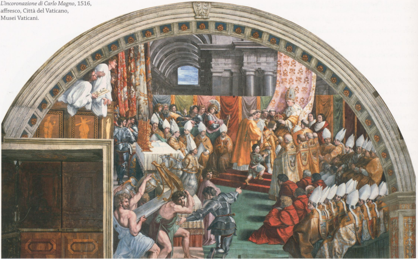
Raffaello Sanzio, L'incoronazione di Carlo Magno , 1516, affresco, Città del Vaticano, Musei Vaticani.

al massimo, ma le proporzioni vitruviane sono maggiormente rispettate in confronto ad altri maestri che l'hanno preceduto. Le dimensioni modeste dell'arco fanno sembrare ancora più grandi le divinità nelle nicchie e i personaggi sottostanti.