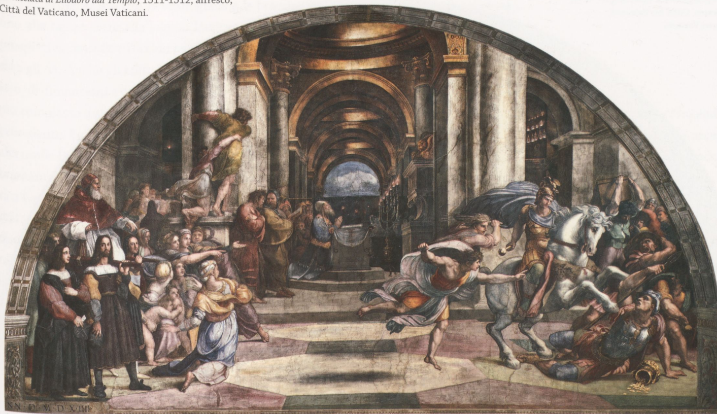
Raffaello Sanzio, La cacciata di Eliodoro dal Tempio , 1511-1512, affresco, Città del Vaticano, Musei Vaticani.

così, per la prima volta, l'architettura in costruzione assume in un dipinto un significato simbolico. Del resto, il gruppo riunito all'aperto e il pilastro incompiuto potrebbero avere suscitato critiche ciniche, poiché il coro parzialmente distrutto era esposto alle intemperie e la nuova costruzione della basilica si era fatta attendere.