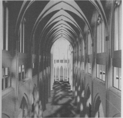
Abb. 2 Prototyp des als »Mindmap« verwen-deten virtuellen Dommodells (Autoren)

Als Schwierigkeit haben sich bei der Vorberei-tung unterschiedliche Vorstellungen der betei-ligten Disziplinen von Datenverknüpfungen herausgestellt. Während in der Geisteswissen-schaft solche Verknüpfungen als Interpreta-tion verstanden werden, ist die abstrakte Verknüpfung von Dateneinheiten in der Informa-tik ein Strukturierungsproblem, das zwar sichtlich Folgen für die betreffenden Inhalte hat, das diese aber nicht umstandslos erzeugt. Die ursprünglich von den Informatikern favo-risierte Strukturierung von Daten nach einem im voraus standardisierten Inhalts-Modell, die der informationstechnischen Erfassung entge-