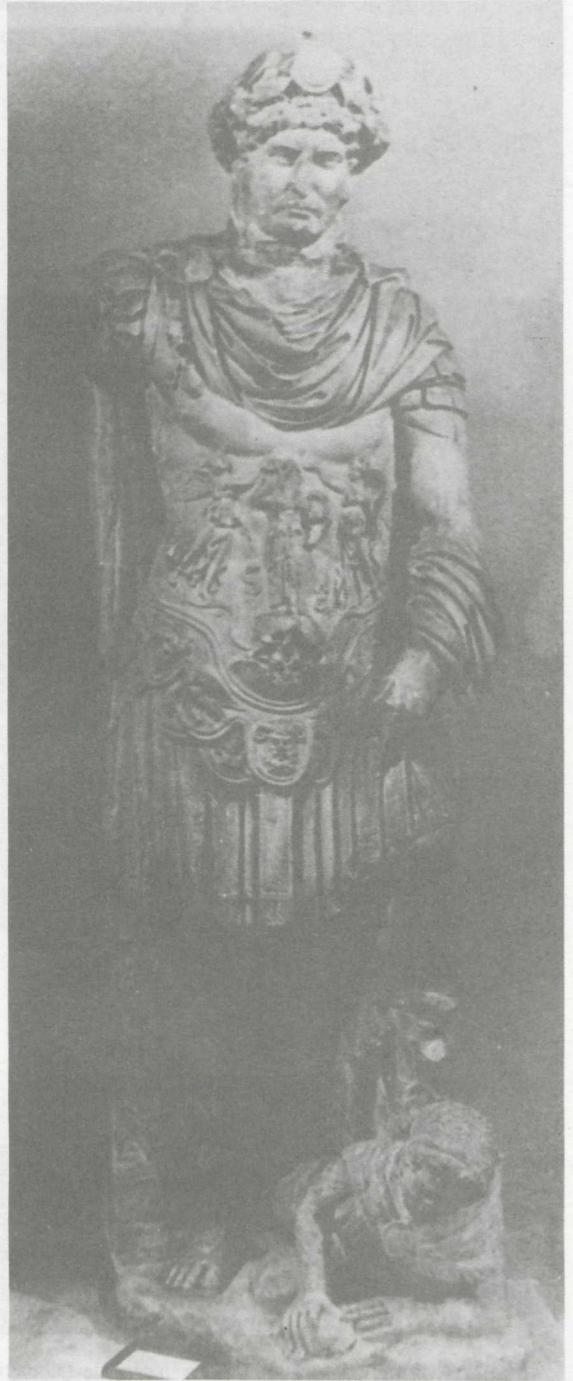
3. La statue d'Hadrien de Hierapytna. Musée Archéologique d'Istanbul, d'après Vermeule, op.cit. , pl. 105.

l'étouffement de l'insurrection de Simon Bar-Kochba (fig. 3). Les représentations sur les monnaies nous renseignent que sous la statue de Marc Aurèle, installée à présent à la Place du Capitole, un barbare était couché et sur son dos le sabot du cheval impérial était appuyé 21 . Au cours du III e siècle l'effigie d'un ennemi concret disparaît pour être remplacée par une conception généralisée: l'empereur en tant que victor omnium gentium foule des sabots de son cheval ou piétine un personnage qui personnifie tous les ennemis de l'Empire (parfois, comme p.ex. sur les reliefs de l' Arcus Novus de Dioclétien ou sur les socles des colonnes de l'arc de Constantin, ils sont différenciés et divisés en deux groupes: ennemis d'Orient — des Parthes et plus tard des Perses, et ennemis du Nord — des Germains) 22 . Quelquefois à la place de l'empereur on trouve la Victoire, aux