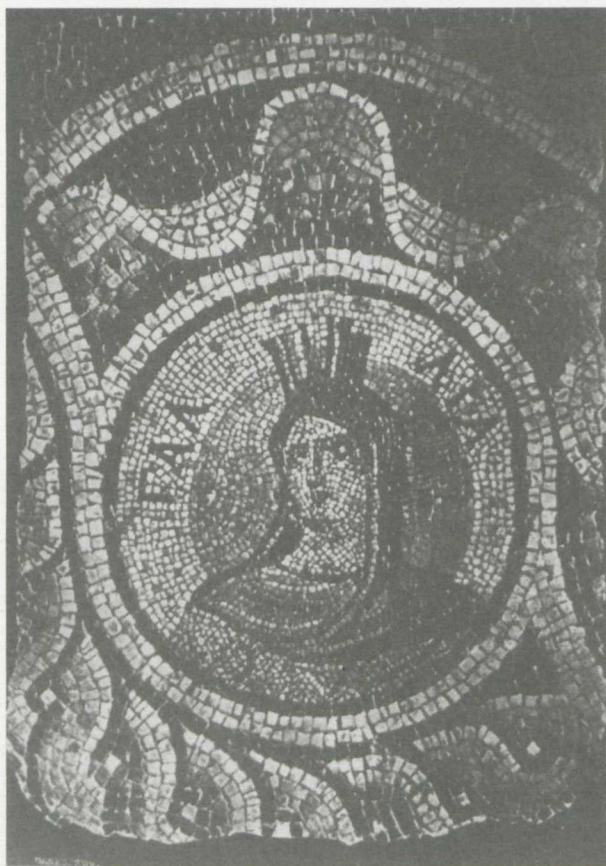
10. La Gaule. La mosaïque de Belkis (Zeugma). Berlin, Staatliche Museen, d'après Jatta, op.cit. , fig. 2.