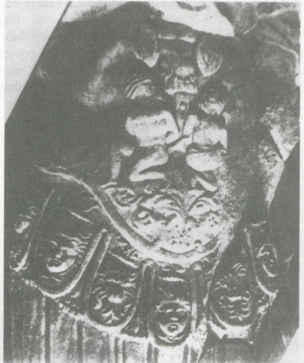
1. Statua loricata du trophée de Saint-Bertrand-de-Comminges (Lugdunum Convenarum antique) d'après Picard, op.cit. , pl. 16.

Ils se trouvent sur de nombreuses statues du type statua loricata représentant les empereurs. Sur la célèbre statue d'Auguste de Prima Porta il y a des effigies des deux femmes assises, personnifiant deux provinces: l'Espagne et la Gaule ou la Dalmatie et la Pannonie 12 . Elles sont exécutées selon la convention idéaliste, mais sur la cuirasse du grand trophée de Saint-Bertrand-de-Comminges (Lugdunum Convenarum antique) provenant de la même période (27—20 av.n.è.) on voit deux captifs qui ont les mains liées (fig. 1). Le même motif apparaît sur la cuirasse de la statue de Domitien au Louvre 13 , ou sur celle de la statue du