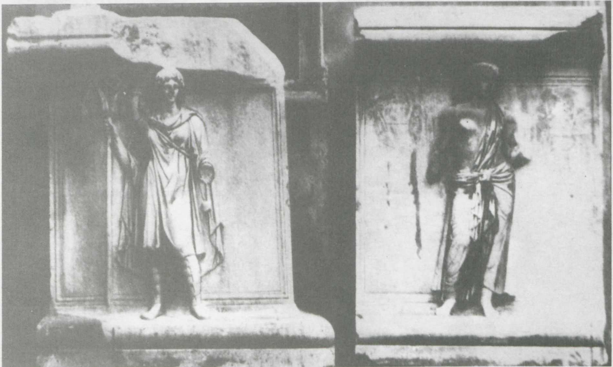
8. La Mauritanie et l'Égypte. Bas-relief de l'Hadrianeum. Rome, Palais des Conservateurs, d'après Nash, op.cit. , fig. 560.