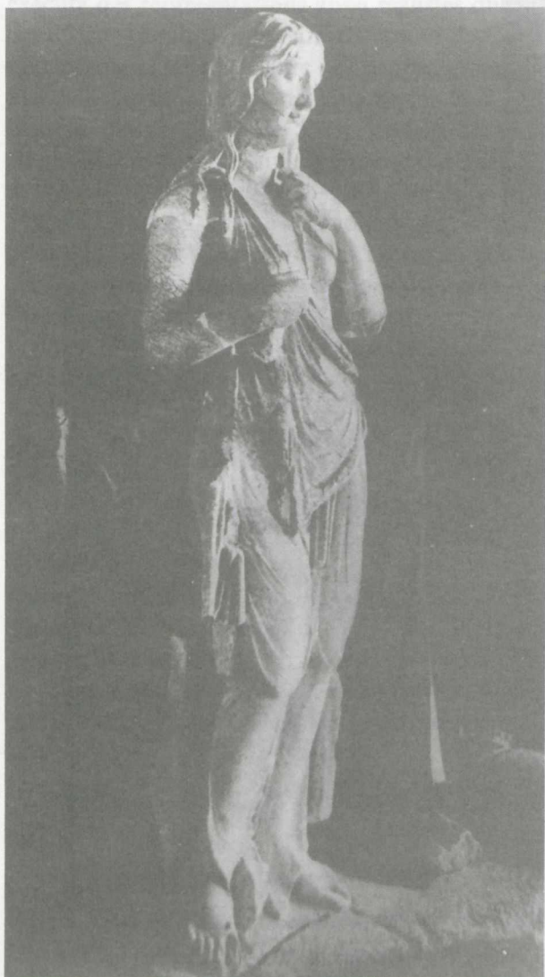
6. L'Espagne. Statue du trophée de Saint-Bertrand-de-Comminges, d'après Picard, op. cit. , pl. 10.