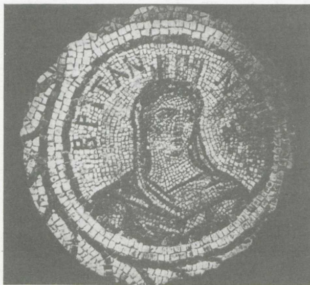
9. Britannia. La mosaïque de Belkis (Zeugma). Berlin, Staatliche Museen, d'après Jatta, op.cit. , fig. 1.