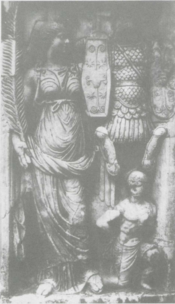
4. Le socle d'une colonne de l' Arcus Novus de Dioclétien. Florence, Jardin de Bobolo, d'après Nash, op.cit. , fig. 129.

pieds de laquelle est agenouillé un captif personnifiant le peuple (fig. 4); ce motif est aussi pris de l'iconographie impériale comme en témoigne par exemple la statue de Domitien d'Olympie au pied duquel Germania est agenouillée 23 .