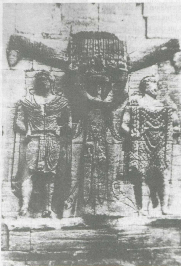
2. Les bas-relief de l'arc de Carpentras, d'après Campbell, op.cit. , fig. 14.

Une autre manière de symboliser la victoire apparaît au I er siècle: l'empereur terrasse un barbare, met son pied sur la nuque de celui-ci ou le foule des sabots de son cheval. Nous trouvons ce motif sur les monnaies de Domitien ayant comme légende „Germania capta” et sur celles de Trajan avec la légende „Dacia capta”. La statue d'Hadrien de Hierapytna représente l'empereur posant le pied sur un ennemi renversé, ce qui très probablement accentue d'une manière symbolique