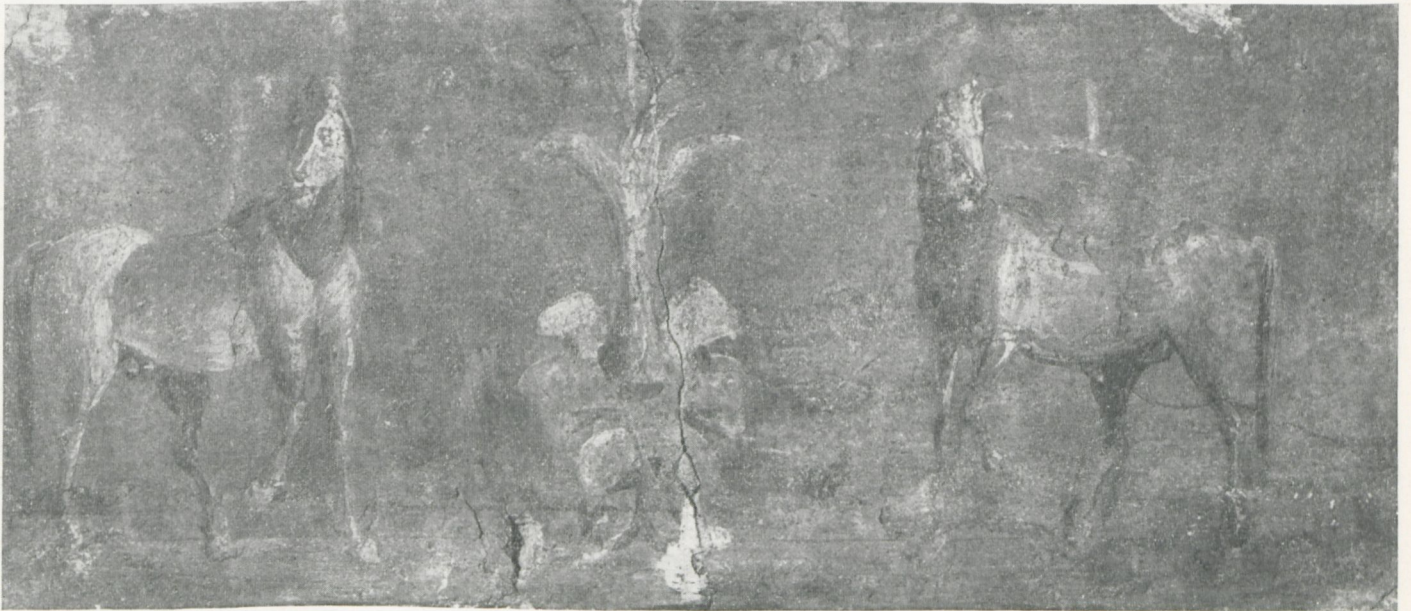
Neapel, Museo Archeologico Nazionale, Inv. Nr. 8669 (aus Raum 17 der Casa dei Cervi)