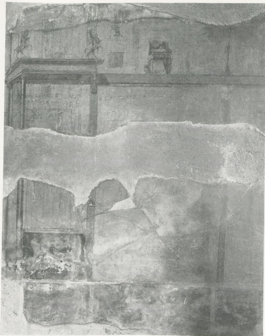
Herculaneum, Raum 16 der Casa dei Cervi (rechtes Seitenfeld der Westwand)

oder auf der Strasse, sondern in einem Wohnhaus gefunden wurde, dann war höchstwahrscheinlich Q. Granius Verus dessen Eigentümer.