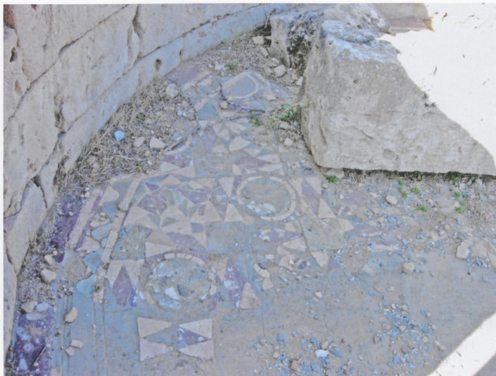
Fig. 5. TOLEMAIDE, Casa T. Pavimentazione in opus sectile nell'abside della sala E IV.

(Fig. 5). Nell'ala meridionale della stessa casa, in una delle stanze che si aprono sul cortile lastricato (SP IB), sono i resti di un altro pavimento in opus sectile , ancorché molto più semplice da quello della sala E IV. Questi pavimenti non sembrano contemporanei, anche se, come si è detto, la loro datazione e la cronologia relativa non è stata ancora stabilita con certezza.