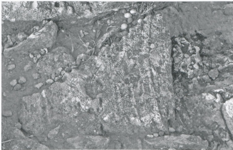
Fig. 8. TOLEMAIDE, Casa T. Solchi di ruota nella parete occidentale del cortile vicino al blocco di porfido.

quella di rinfrescare gli ambienti riscaldati dalla fornace o per spegnere un eventuale incendio, più che per il bagno. Non sappiamo comunque da dove vi si accedesse. Può darsi che l'attività artigianale fosse qui più ampia, non limitandosi al taglio della pietra, anche se è certo l'impiego dell'energia idraulica, come si può dedurre dal complesso sistema di canali che, partendo dall'edificio SP III attraversavano due o tre ambienti ad est dell'edificio SP III e correvano poi lungo il lato sud del grande peristilio per finire nella piscina. Lo stato attuale delle nostre conoscenze delle rovine della casa T non permette ancora di comprendere e ricostruire il funzionamento di questo complesso artigianale.