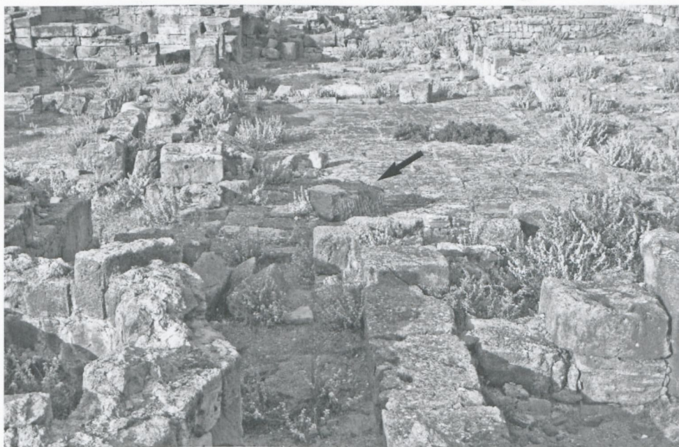
Fig. 4. TOLEMAIDE, House T. Cortile S IX con il blocco di porfido al centro (Foto autore).

momento che il porfido era riservato esclusivamente agli imperatori. Secondo Sandro Stucchi il blocco provverebbe l'ipotesi, già sostenuta dal Goodchild che la casa T fosse, nella prima metà del V secolo, il palazzo del Dux Pentapoleos , inviato a Tolemaide da Costantinopoli per governare tutta la provincia Libya Superior 15 . Un blocco sporadico non costituisce tuttavia un argomento forte per indicare la funzione di una struttura architettonica né per proporre l'identità del suo utilizzatore. Può darsi che il blocco di porfido sia stato importato più tardi, dalla fine del V secolo in poi, quando le cave del Mons Porphyrites erano già chiuse e il controllo del commercio di questa pietra pregiata, rimasta in deposito nelle botteghe alessandrine, non veniva più rigorosamente applicato. Ciò poteva riguardare blocchi di porfido di dimensioni minori, non adatti alla realizzazione di statue, colonne o sarcofagi imperiali né delle famose rotae nei palazzi degli imperatori bizantini, tuttavia ancora utilizzabili per la decorazione architettonica delle sontuose residenze private. L'uso comune delle lastre di porfido nei mosaici pavimentali di opus sectile degli edifici tardo antichi è testimoniato in numerosi siti archeologici del Mediterraneo, anche a Tolemaide dove, proprio nella casa T – precisamente nella grande sala absidata E IV – si trova un bell'esempio di opus sectile di ottima qualità