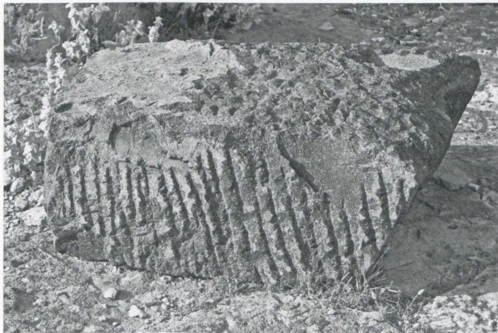
Fig. 6. TOLEMAIDE, Casa T. Lato occidentale del blocco di porfido con le incisioni.

delle lastre in pietra 16 . Il problema maggiore è costituito dalla mancanza di resti di botteghe dei tagliapietre e di studi sui blocchi di pietra tagliati per le lastre musive. Due tronchi delle colonne di calcare appena incisi da Gerasa 17 e altri due blocchi di marmo nello stesso stato di elaborazione da Efeso sono finora le sole e molto modeste testimonianze su questo argomento 18 . Molto meglio conosciuti e più studiati sono gli strumenti necessari per tagliare la pietra, soprattutto le seghe a ruota azionate dall'energia idraulica 19 . Esistono numerosi commenti del celebre brano di Ausonio, dal poema La Mosella del 371, che menziona una sega a ruota per tagliare il marmo 20 .