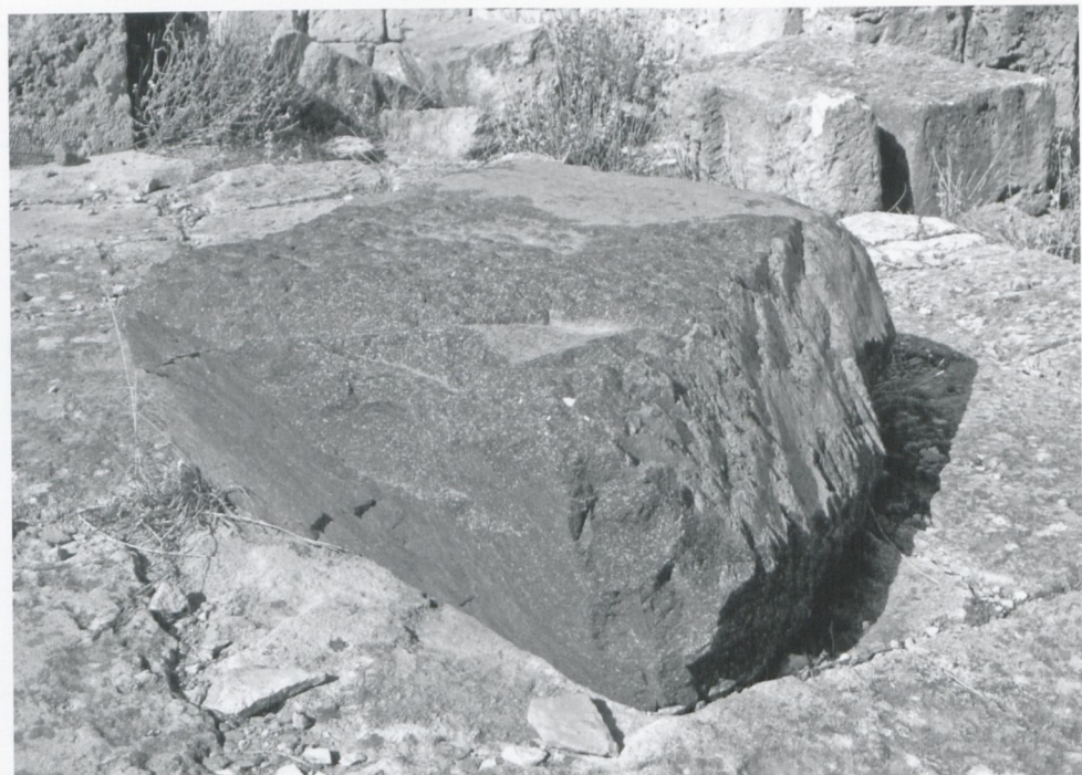
Fig. 1. TOLEMAIDE, Casa T. Blocco di porfido (Foto autore).

In quel periodo gli abitanti della casa erano già cristiani, come testimoniano due blocchi di calcare locale che recano simboli cristiani scolpiti, rinvenuti nella casa T. Vorrei comunque sottolineare che questi blocchi non provano una funzione sacra ecclesiastica della struttura 7 . Il primo di questi blocchi si trova vicino all'ingresso ed è decorato con una specie di graffito, molto ben eseguito, con una rappresentazione della sezione interna di una basilica a tre navate, o della sua facciata: tre arcate fra le colonne sono decorate con le croci pendenti 8 . Il secondo blocco recava un graffito con una croce a braccia patenti, iscritta in un cerchio, oggi scomparso 9 . Sulla soglia della casa è visibile una croce, molto più primitiva, all'interno di un cerchio 10 . Tutti questi esempi di decorazione architettonica dimostrano solamente che in questa casa hanno vissuto dei cristiani, fatto usuale