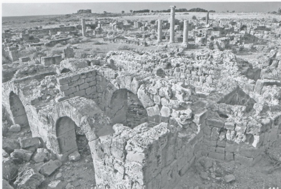
Fig. 7. TOLEMAIDE, Casa T. area SP III.

nate da una cascata d'acqua, muovevano le seghe che a loro volta tagliavano in lastre sottili colonne o altri blocchi provenienti da edifici romani. Le lastre, di diverse dimensioni a seconda delle necessità, erano poi usate per il rivestimento interno delle pareti e dei pavimenti di diversi edifici tardo antichi 21 . L'immagine di una sega di questo tipo è stata riconosciuta appena due anni fa nel rilievo funerario di M.A. Ammianos, il taglia-pietre di Hierapolis in Frigia, accanto alla sua iscrizione datata alla fine del III secolo 22 . Si deve sottolineare che il taglio dei blocchi di calcare o di marmo era senz'altro più agevole che non quello del porfido, la pietra più dura in uso nell'antichità. Forse per questo le tracce di sega sul blocco di Tolemaide hanno un aspetto diverso da quelle visibili sul calcare o sul marmo.