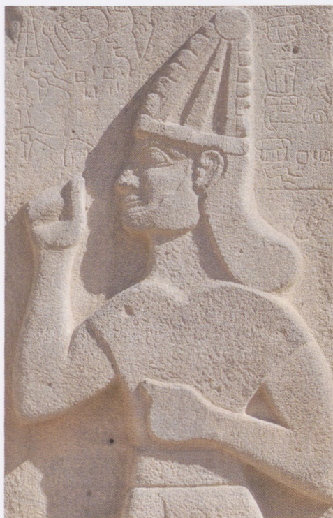
Fig. 2 | Détail d'un relief sculpté mis au jour dans le temple du dieu de l'Orage à Alep. Il représente le roi Taita, qui régna sur le royaume du Palastin au XI e siècle avant J.-C.

Dans les décennies autour de 1200 avant J.-C., le système des grands empires du Proche-Orient, globalement stable pendant plus de cent vingt ans grâce à l'équilibre des forces en présence 1 , s'effondre. L'Assyrie et la Babylonie accusent des pertes territoriales, et en partie aussi structurelles, mais parviennent à conserver leur intégrité et leur existence au-delà de cette période de crise. En revanche, l'Élam et l'Égypte connaissent un rapide déclin jusqu'à la dissolution de leurs structures étatiques; l'Empire hittite et l'Ahhiyawa, qu'il convient d'identifier à la Grèce mycénienne, cessent même totalement d'exister. Le phénomène s'accompagne d'une désurbanisation de larges territoires de l'Anatolie et du Levant, avec l'abandon ou la réduction massive de nombreuses cités.