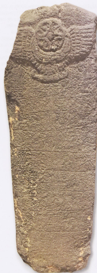
Fig. 4 | Stèle en basalte provenant de la cour du temple du dieu de l'Orage à Karkemish, conservée à Istanbul, musée des Civilisations anatoliennes (inv. 34)

Vers le milieu du X e siècle avant J.-C. commence la fondation de principautés par des tribus et des clans araméens, décrite plus haut. C'est par exemple de cette époque qu'il convient de dater l'extension d'une colonie modeste déjà implantée à Tell Halaf près de Guzana, capitale du pays de Palê. Le personnage important était ici un prince du nom de Kapara 34 .